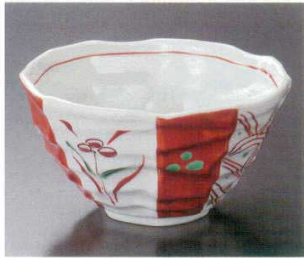
40611-149 赤絵間取波八角丼(大) 3,350円 30入 (17×9cm・850cc)