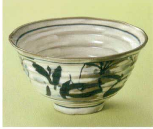
40617-259 呉須流し6.0高台丼 3,150円 40入 (17.5×8.8cm)