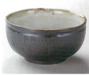
40615-259 赤絵十草変型6寸丼 3,500円 30入 (18.5×18.5×9cm・1,000cc)