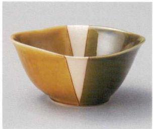
40606-579 黄瀬戸塗分多用丼 4,300円 30入 (17×16.2×8cm)