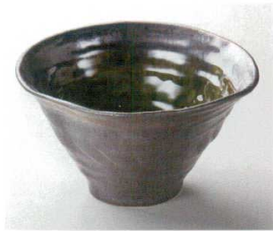
40607-149 いぶし銀彩鉢(大) 3,980円 20入 (21.5×21×12cm・1,350cc)