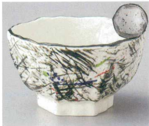
40601-149 筆なぶり六角丼(大) 4,600円 25入 (18×17.3×10.5cm・950cc)