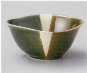
40605-579 織部塗分多用丼 4,300円 30入 (17×16.2×8cm)