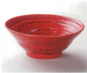
40609-189 赤ゆず刷毛7.0丼 3,900円 20入 (21.8×8.2cm)