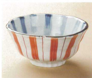
40608-149 いぶし銀彩鉢(小) 3,300円 30入 (20×19×10.5cm・850cc)