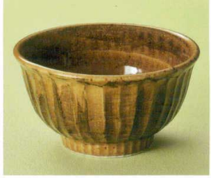
40618-259 呉須千段6.0平身丼 3,000円 50入 (18×7.5cm)