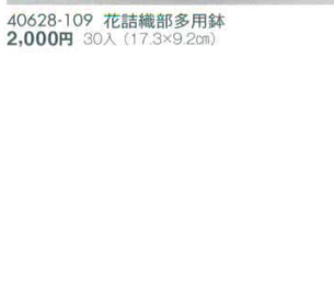
40624-189 白粉引草花反5.5丼 2,750円 30入 (17×9.2cm)