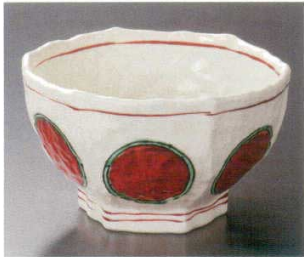
40603-189 赤絵丸紋六角6.0丼 4,850円 30入 (18×10cm)