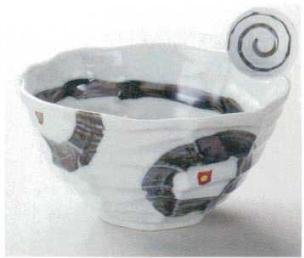
40613-149 呉須丸紋八角丼(大) 3,350円 30入 (17×9cm・850cc)