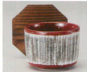
43006-449 結晶マグナ木蓋付飯器 3,100円 40人 (11×8.5cm) 43007-449 木蓋 550円 200人 (12.5×11.5×2cm)