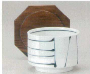
43004-439 黒一珍飯器蓋付(小) 2,900円 60人 (10.5×8.5cm) 43005-439 木蓋(小)(段付) 600円 100人