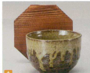
土 43034-179 信楽流し4.0飯器(蓋付) 2,050円 30人 (12×8.8cm) 43035-179 木蓋(大) 650円 120人 (13.5×12.5×1.8cm)