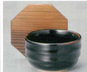
43038-269 ゆず天目削り六兵衛飯器蓋付 1,800円 40人 (11×6.3cm) 43039-269 ゆず天目焼杉蓋 400円 (12.3×11.3cm)