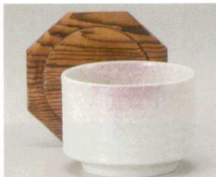
43016-439 紫吹き飯器蓋付(小) 2,500円 60人 (12.5×8.5cm) 43017-439 木蓋(小)(段付) 620円 100人