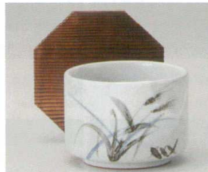
43020-299 益子芦飯器蓋付 2,060円 30人 (10.5×8cm) 43021-299 飯器焼杉蓋 560円 571人 (11.5×11.5×2.2cm)