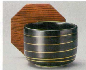
43014-029 金筋ゆず黒飯器蓋付 2,500円 40人 (10.6×7.5cm) 43015-029 木蓋 450円 300人 (12.5×11.5cm)