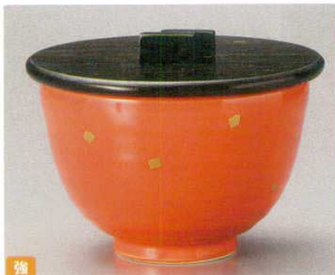
強 43001-259 オレンジ釉金粉姫井蓋付飯器 4,150円 60人 (11.2×7.5cm・400cc)