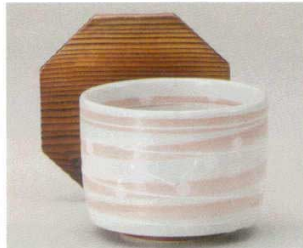
43010-449 一珍秋色うずお好み碗(木蓋付) 3,000円 40人 (11×8.2cm) 43011-449 飯器木蓋 550円 300人 (12.5×11.5×2cm)