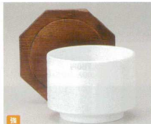
強 43018-439 白磁筒型飯器(小) 蓋付 2,450円 60人 (10.3×7.4cm) 43019-439 木蓋(小)のみ 620円 100人