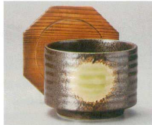
43012-549 鉄仙花ヒワ筒型飯器(大)のみ 2,000円 20人 (11.5×8.5cm) 43013-549 木蓋(大)(段付) 870円 150人 (13.2×1.9cm)