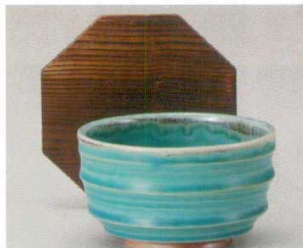
43032-269 トルコブルー削り六兵衛飯器(蓋付) 1,950円 40人 (11×6.3cm) 43033-269 トルコブルー焼杉蓋 400円 (12.3×11.3×1.8cm)