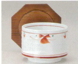
43002-549 赤紅小花飯器(大)のみ 3,200円 20人 (11×10.2cm) 43003-549 木蓋(大)(段付) 870円 150人 (13.5×12.5×2cm)