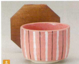
土 43008-299 赤染十草飯器蓋付 2,810円 40人 (11×8cm) 43009-299 飯器焼杉蓋 560円 571人 (11.5×11.5×2.2cm)