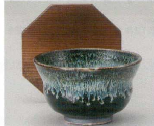
43028-269 飯器ヒサコユズ天目(蓋付) 1,800円 40人 (11×10cm) 43029-269 焼杉蓋 400円 (12.3×11.3×1.8cm)