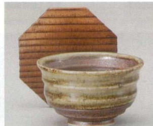
43036-269 オフケ信楽飯器蓋付 1,800円 36人 (11.8×7.5cm) 43037-269 焼杉蓋 400円 (12.3×11.3×1.8cm)