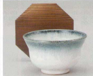
43030-269 青靑ひざご飯器(蓋付) 1,700円 40人 (11×10cm) 43031-269 焼杉蓋 400円 (12.3×11.3×1.8cm)