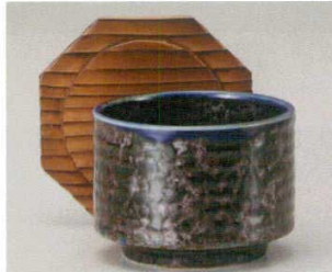
43024-439 いろり筒型飯器小 蓋付 2,600円 60人 (10.4×7.6cm) 43025-439 木蓋(小)(段付) 620円 100人