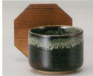
43026-299 ゆず天目乳白流飯器蓋付 2,060円 48人 (10.5×8cm) 43027-299 木蓋 560円 571人 (11.5×11.5×2.2cm)