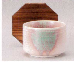
43111-239 ヒスイ吹き飯器(蓋付) 2,000円 40入 (10.7×9.6cm・480cc) 43112-239 焼杉木蓋 480円 300入 (12.3×11.3×1.8cm)