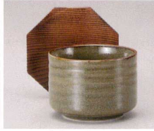
43113-239 唐津飯器(蓋付) 2,000円 40入 (10.5×9.6cm・480cc) 43114-239 焼杉木蓋 480円 300入 (12.3×11.3×2cm)