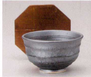
43105-269 鉄錆削り飯器(蓋付) 1,700円 60入 (11×7.5cm) 43106-269 焼杉蓋 400円 (12.3×11.3×1.8cm)