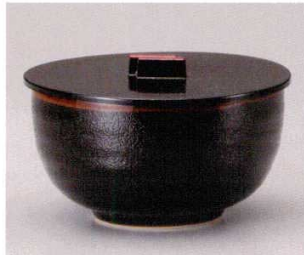
43123-299 天目多用鉢(P蓋付) 1,070円 40入 (13×7cm) 43124-299 P飯器蓋 320円 600入 (13.5×1.5cm)