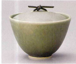
43117-239 灰オリベ蓋付カップ 2,000円 64入 (12×8cm・370cc)