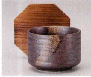
43109-239 備前飯器蓋付 2,000円 40入 (10.7×9.6cm・480cc) 43110-239 焼杉木蓋 480円 300入 (12.3×11.3×1.8cm)