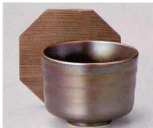
43128-459 窯変玉虫飯器 950円 50入 (10.5×8.1cm) 43129-459 焼杉木蓋 460円 100入 (12×11.5×1.8cm)