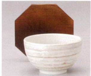
43125-179 東風4.0飯器(蓋付) 1,650円 80入 (12.5×7.5cm)