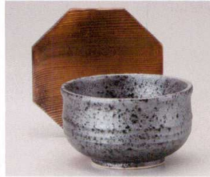
43103-269 銀彩油滴削り飯器(蓋付) 1,700円 40入 (11×6.3cm) 43104-269 焼杉蓋 400円 (12.3×11.3×1.8cm)