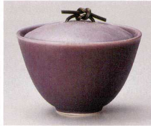
43118-239 紫蓋付カップ 2,000円 64入 (12×8cm・370cc)