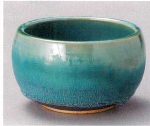
43119-269 トルコブルーたつぷり碗 1,500円 40入 (11.1×6.3cm)