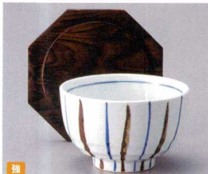
43126-559 染付二色十草飯器蓋付 2,940円 40入 (11.5×10cm) 43127-559 焼杉蓋八角13.5cm(段付) 950円 (14×13.5×2cm)