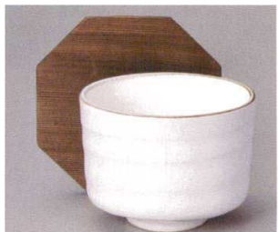
43132-459 白釉口錆飯器 950円 50入 (10.5×8.1cm) 43133-459 焼杉木蓋 460円 100入 (12×11.5×1.8cm)