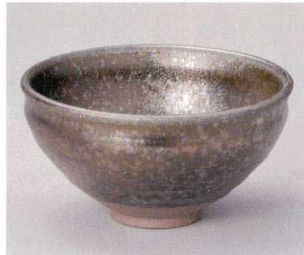
43122-469 鉄結晶京型抹茶碗 1,600円 48入 (12.6×6.5cm・350cc)