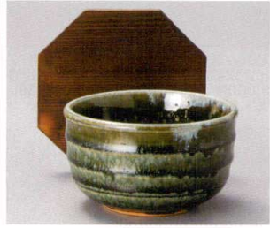
43115-269 織部おふけ六兵衛飯器(蓋付) 1,600円 40入 (11×6.3cm) 43116-269 焼杉蓋 350円 (12.3×11.3×1.8cm)