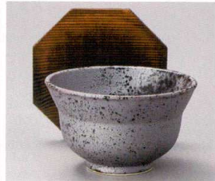
43107-269 銀彩結晶ひざご飯器(蓋付) 1,550円 40入 (11×10cm) 43108-269 焼杉蓋 350円 (12.3×11.3×1.8cm)