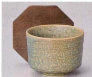
43130-459 イラボ飯器 950円 50入 (10.5×8.1cm) 43131-459 焼杉木蓋 460円 100入 (12×11.5×1.8cm)