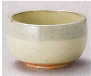
43120-269 グリーン志野たつぷり碗 1,350円 40入 (11.1×6.3cm)