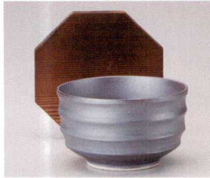
43101-269 鉄釉削り飯器(蓋付) 1,800円 40入 (11×6.3cm) 43102-269 焼杉蓋 400円 (12.3×11.3×1.8cm)