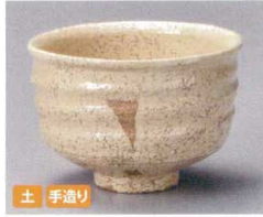
43401-519 伊賀志野茶碗(木)(手造り) 18,000円 30入(12×8.5cm)