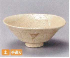
43402-519 伊賀志野平夏茶碗(木)(手造り) 18,000円 30入(15×6.3cm)