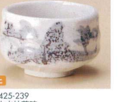
43425-239 白山水抹茶碗 3,500円 30入(11×8cm・530cc) ※1ヶ入