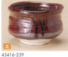
43416-239 朝焼け抹茶碗 3,500円 30入(12×8cm・530cc) ※1ヶ入