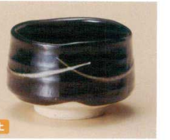
43405-029 天目抹茶(化) 3,500円 1×30入(11.3×7.7cm・500cc)