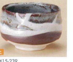
43415-239 新春抹茶碗 3,500円 30入(12×8cm・530cc) ※1ヶ入