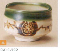
43413-239 抹茶織部 3,500円 30入(11×8cm・530cc) ※1ヶ入