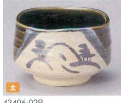
43406-029 織部山水抹茶碗(化) 3,500円 1入(11.3×7.7cm・500cc)