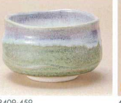
43409-459 新海抹茶碗 2,950円 30入(12×7.8cm・440cc)