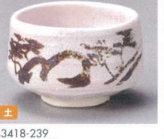
43418-239 桜志野抹茶碗 3,500円 30入(11×8cm・530cc) ※1ヶ入