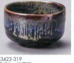
43423-319 黒ブルー抹茶碗 2,750円 1×30入(11.3×7cm・550cc)