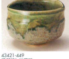
43421-449 織部流し抹茶碗 2,700円 30入(12.5×8.3cm・550cc)