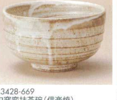
43428-669 白窯変抹茶碗(信楽焼) 2,750円 50入(12.8×7.5cm)