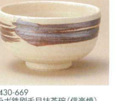
43430-669 イロボ鉄刷毛目抹茶碗(信楽焼) 2,750円 50入(13×8cm)