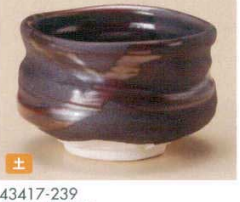
43417-239 赤流し抹茶碗 3,500円 30入(11×8cm・530cc) ※1ヶ入