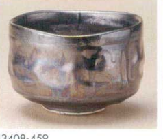
43408-459 黒パール削ぎ型 抹茶碗 2,950円 30入(12.5×8.5cm・460cc)