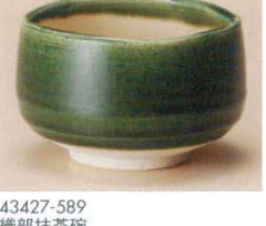
43427-589 織部抹茶碗 2,650円 40入(12×7.6cm・450cc)