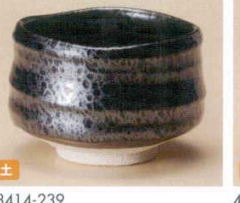
43414-239 油滴抹茶碗 3,500円 30入(12×8cm・530cc) ※1ヶ入