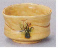
43403-519 黄瀬戸杓型小抹茶碗 9,000円 20入(10×6.5cm・250cc)