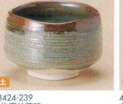
43424-239 緑均窯削抹茶碗 3,500円 30入(11×8cm・530cc) ※1ヶ入