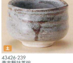
43426-239 青志野抹茶碗 3,500円 30入(11×8cm・530cc) ※1ヶ入