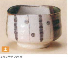
43407-029 夢織部抹茶(化) 3,500円 1×30入(11.3×7.7cm・500cc)