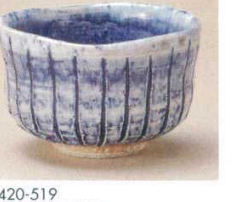
43420-519 青均窯削十草彩碗 2,800円 40入(11.3×7.2cm・480cc)