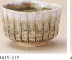
43419-519 鏝均窯削十草彩碗 2,800円 40入(11.3×7.2cm・480cc)