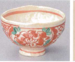
43404-519 赤彩丸紋手引き大碗 6,000円 40入(12×7.8cm・480cc)