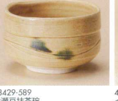
43429-589 黄瀬戸抹茶碗 2,650円 40入(11.6×7.7cm・450cc)