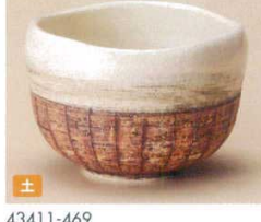
43411-469 火色十草大福碗 2,850円 60入(11.5×7.5cm・460cc)