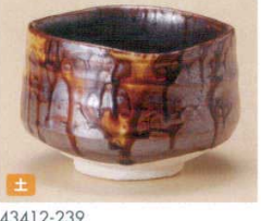
43412-239 鮎流し抹茶碗 3,500円 30入(11×8cm・530cc) ※1ヶ入