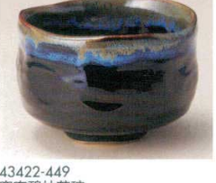
43422-449 窯変碧抹茶碗 2,700円 30入(12.5×8.3cm・550cc)