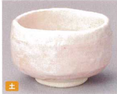
43503-459 曙手造り抹茶碗 2,500円 60入 (12.5×8cm・450cc)