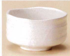
43512-299 粉引抹茶 2,100円 60入 (11.6×7.2cm・480cc) ※1ヶ入