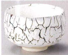
43501-459 粉引黒流し抹茶碗 2,600円 30入 (12.1×7.7cm・480cc)