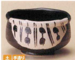
43520-109 黒織部抹茶碗 1,850円 50入 (12×7.2cm・280cc)