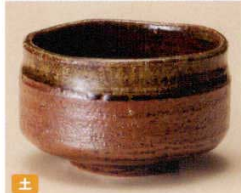
43513-109 備前流し抹茶碗 2,000円 40入 (12×7.4cm・500cc)