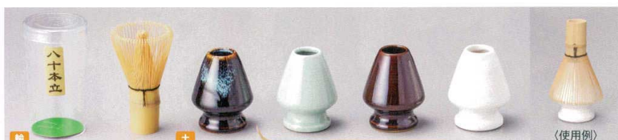
43527-459 八十本立茶筥 3,900円 25入 (6×11cm)