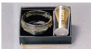
43526-459 柚子天目白流し抹茶セット 7,900円 24入 (抹茶碗12.5×7.8cm・470cc・茶杓7.0×2.1×16×8.5cm)