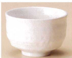
43525-239 越後白野点碗 500円 80入 (10×6.8cm・310cc)