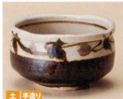
43518-109 唐草辰砂抹茶碗 1,850円 50入 (12×7.2cm・500cc)