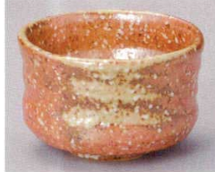
43506-239 野点信楽 2,700円 36入 (10.5×6.5cm・250cc) ※1ヶ入