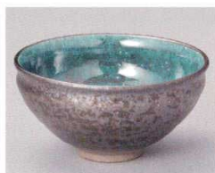
43522-469 鉄結晶塗分(トルコ)京型抹茶碗 1,600円 48入 (12.6×6.5cm・350cc)