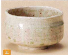
43514-109 ヒワビードロ抹茶碗 2,000円 40入 (12×7.4cm・550cc)