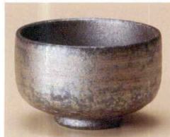
43516-669 黒窯変抹茶碗(信楽焼) 2,000円 40入 (12×7.8cm・500cc)