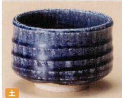
43515-239 藍釉抹茶碗 2,500円 30入 (11×7.5cm・520cc) ※1ヶ入