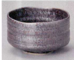
43511-299 錆油錆抹茶 2,100円 30入 (12×7cm・480cc) ※1ヶ入