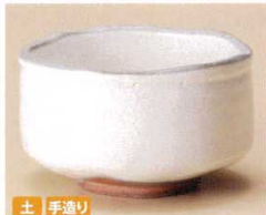
43519-109 粉引抹茶碗 1,850円 50入 (12×7.2cm・500cc)