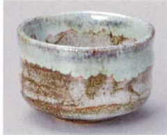
43504-299 青均窯ニ抹茶 2,500円 66入 (10×6.5cm・300cc) ※1ヶ入