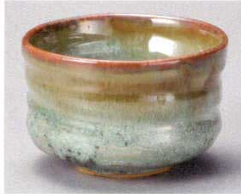
43505-319 青均千筋野点 2,500円 1×30入 (10×6.5cm・300cc)