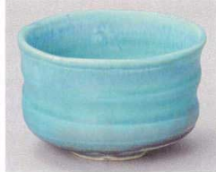
43507-239 野点トルコ 2,700円 36入 (10.5×6.5cm・250cc) ※1ヶ入