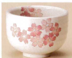
43523-579 うたげ桜野点碗 1,650円 83入 (10.7×7.5cm・390cc)