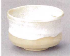
43509-239 野点はぎ 2,700円 36入 (10.5×6.5cm・250cc) ※1ヶ入