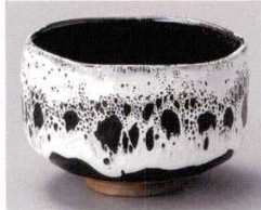
43502-459 天目白流し抹茶碗 2,600円 30入 (12.1×7.7cm・450cc)