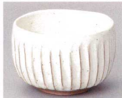
43517-339 粉引ソギ目小抹茶 2,000円 60入 (9.7×6.5cm・320cc)