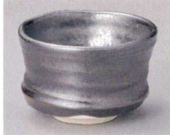
43508-239 野点黒ラスター 2,700円 36入 (10.5×6.5cm・250cc) ※1ヶ入