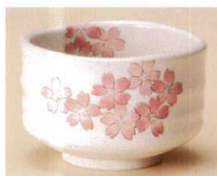
43521-579 うたげ桜抹茶碗 1,700円 68入 (11.7×7.6cm・410cc)