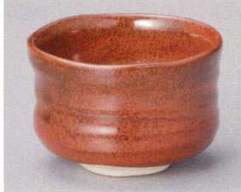
43510-239 野点鉄赤 2,700円 36入 (10.5×6.5cm・250cc) ※1ヶ入