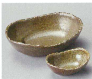
04439-029 窯変織部楕円5.0鉢 1,400円 60入 (17×13×4.5cm) 04440-029 窯変織部楕円3.0小付 600円 200入 (9.5×7.3×3.2cm)