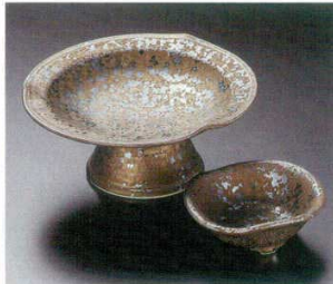
04413-139 金結晶三ツ押高台刺身皿 3,350円 40入 (16.7×7.5cm) 04414-139 金結晶三ツ足千代久 750円 150入 (8.3×3cm)