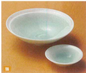
04423-149 ラスターヒワ吹平鉢 2,400円 40入 (16.2×4.5cm) 04424-149 ヒワ吹千代口 1,080円 150入 (6.5×2.5cm)