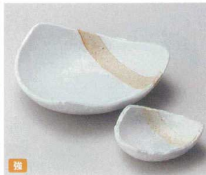
04419-559 粉引塗分5.5三角刺身鉢 2,340円 40入 (16.2×16×4cm) 04420-559 粉引塗分三角千代久 1,350円 120入 (8.5×8.5×2.8cm)