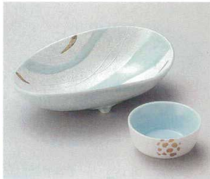
04415-179 流水ラスター楕円中鉢 3,150円 40入 (16.8×10.7×4.8cm) 04416-179 流水ラスター丸千代口 1,200円 200入 (6.7×3cm)