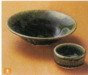
04411-149 織部刺身鉢 3,750円 50入 (16.5×4cm) 04412-149 織部千代久 1,400円 120入 (7×3.5cm)