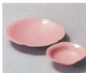
04433-269 窯変ピンク測押刺身皿 1,700円 60入 (16.2×2.5cm) 04434-269 窯変ピンク測押刺身千代口 550円 180入 (10.1×2.8cm)