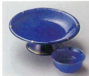
04409-179 エンカ巻刺身 4,400円 40入 (16.5×5.2cm) 04410-179 エンカ巻千代久 1,100円 150入 (7.5×3cm)