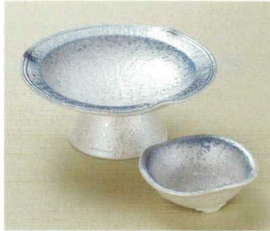
04407-139 コバルト吹ラスター三ツ押高台刺身皿 4,450円 40入 (16.7×7.5cm) 04408-139 コバルト吹ラスター三ツ足千代久 1,480円 150入 (8.3×3cm)