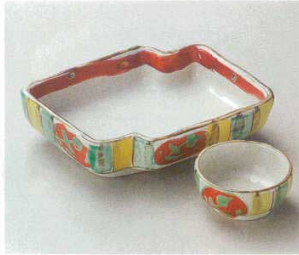
04405-179 十草赤丸紋刺身鉢 4,600円 40入 (16.7×13×4.5cm) 04406-179 十草赤丸紋千代久 1,600円 100入 (7.2×3.5cm)