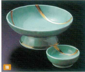
04403-299 雅高台向付 5,400円 40入 (16.8×6.9cm) 04404-299 雅千代久 1,300円 150入 (8.1×3cm)