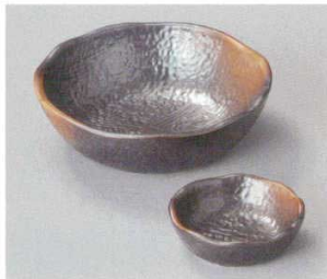
04421-549 やきしめ木の葉型刺身鉢 2,480円 30入 (16.3×5cm) 04422-549 やきしめ木の葉型丸チョコ 720円 150入 (8.5×3cm)