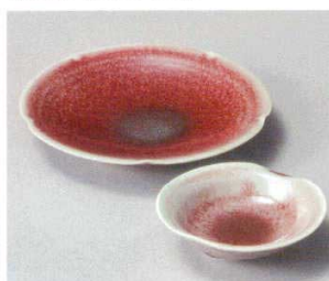
04435-269 辰砂たわみ刺身皿 1,650円 80入 (16.2×2.5cm) 04436-269 辰砂たわみ刺身千代口 600円 180入 (10.1×2.8cm)