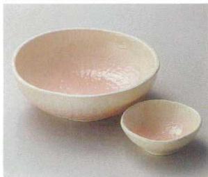
04431-589 桜志野刺身鉢 1,840円 40入 (16.6×15.9×5.5cm) 04432-589 桜志野豆千代久 560円 100入 (9×8.5×3.4cm)