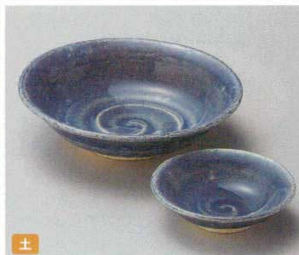
04429-309 藍染ウズ刺身 1,850円 40入 (16×4.5cm) 04430-309 藍染ウズ千代久 920円 150入 (10×2.7cm)