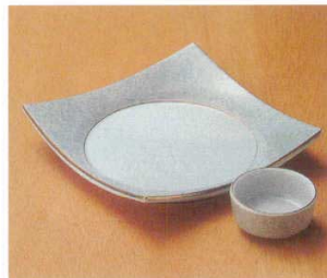
04417-029 測金グリーン吹き刺身皿 2,500円 30入 (16.5×16.5×3cm) 04418-029 測金グリーン吹き千代久 920円 200入 (6×2.8cm)