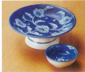
04401-739 古染濃唐草 高台向付(有田焼) 6,000円 5×12入 (16.5×6cm) 04402-739 古染濃唐草千代口(有田焼) 1,900円 5×24入 (7.5×3cm)