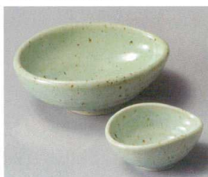
04437-029 益子均窯たまご5.0鉢 1,500円 60入 (17×14×6cm) 04438-029 益子均窯たまご3.0鉢 620円 100入 (10×8×4.1cm)