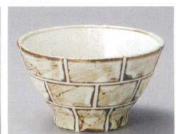
44632-319 クラフトレンガ(白)高台茶碗 1,100円 60入(11.5×6.5cm)