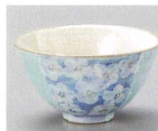
44614-519 粉引花畑飯碗 青 1,650円 60入(12×6.5cm)