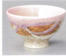
44603-519 ピンク釉刻紋飯碗 2,700円 40入(12.7×7cm)