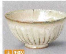
44618-109 黒乳流し茶碗 1,300円 80入(12×6cm)