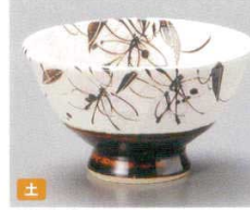
44609-279 アメ釉花紋飯碗 2,500円 100入(11.8×6.5cm)