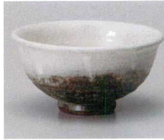
44601-669 灰釉粉引めし碗(大)(信楽焼) 3,300円 100入(12.5×6cm) 44602-669 灰釉粉引めし碗(小)(信楽焼) 3,200円 120入(11×5.7cm)