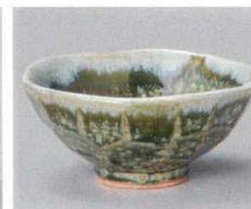
44638-269 織部おふけ中平茶碗 630円 100入(12.5×5.5cm)