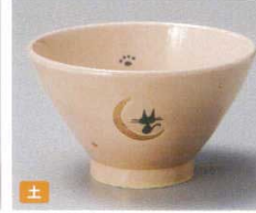
44610-339 月と猫茶碗 ピンク 2,100円 60入(12.5×7cm)