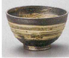
44607-669 灰刷毛目飯碗(信楽焼) 2,600円 100入(12×7.5cm)