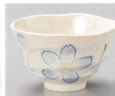
44637-319 山城桜茶碗 870円 130入(11.7×7.4cm)