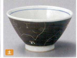
44611-339 サビ猫茶碗 1,800円 60入(12.5×7cm)