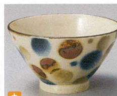
44613-339 ボカシ水玉茶碗 1,800円 60入(12.5×7cm)