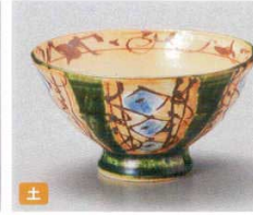
44605-279 織部ベルシヤ紋飯碗 2,700円 100入(11.8×6.5cm)