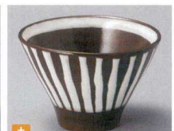
44616-449 白十草反り茶碗 1,700円 80入(11×7.3cm)