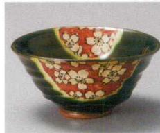
44617-589 織部舞桜茶碗 1,520円 60入(12.8×6.2cm・300cc)