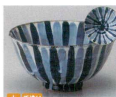
44624-109 染付十草大平 1,250円 100入(12.3×6.3cm) 44625-109 染付十草中平 1,200円 120入(11.2×5.6cm)