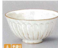
44619-109 粉引しのぎ茶碗 1,300円 80入(12×6cm)