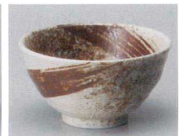
44639-279 志野サビ刷毛飯碗大 500円 100入(12×6cm)