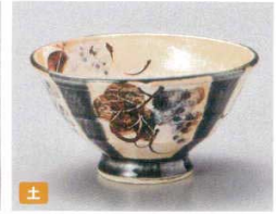
44606-279 間取藍ぶどう飯碗 2,700円 100入(11.8×6.5cm)