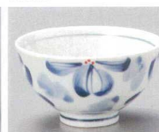
44630-149 花水木茶碗(大) 1,180円 60入(11.3×6.5cm) 44631-149 花水木茶碗(小) 1,060円 80入(11.2×5.6cm)