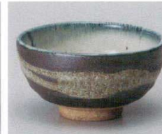
44620-319 黒銀彩雲大平 1,200円 120入(11.5×6.2cm) 44621-319 黒銀彩雲中平 1,100円 120入(11×5.6cm)