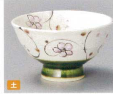
44608-279 織部花唐草飯碗 2,500円 100入(11.8×6.5cm)