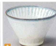
44615-449 窯変流十草反り小井 小 1,700円 80入(11×7.4cm)