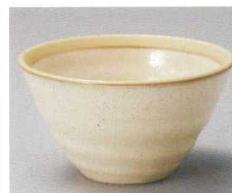
44635-579 唐津茶碗(大) 900円 60入(13.5×7.6cm・515cc) 44636-579 唐津茶碗(小) 750円 80入(11.1×7cm・330cc)