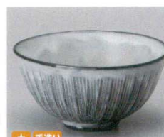
44628-109 黒土粉引串目大平 1,250円 80入(12×6cm) 44629-109 黒土粉引串目中平 1,200円 100入(11.4×5.6cm)