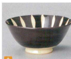
44612-449 黒釉十草飯茶碗 2,000円 80入(12.3×5.6cm)