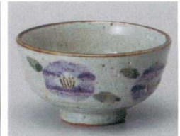
44622-319 紫椿大平 1,200円 120入(11.5×11.5×6.2cm) 44623-319 紫椿中平 1,100円 120入(11×11×5.6cm)