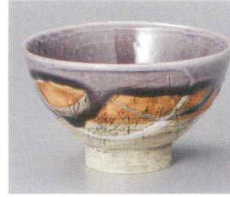
44604-519 紫釉刻紋飯碗 2,700円 40入(12.7×7cm)