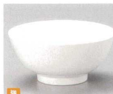
44633-199 高強度磁器WHITE丸碗 800円 150入(11.6×5.4cm) 44634-199 高強度磁器WHITE乳児用茶碗 900円 180入(10.6×4.8cm)