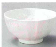
44840-459 色釉白型入茶碗 460円 120入 (11.5×5.8cm・300cc)