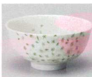
44842-409 花吹雪中平 370円 120入 (11.3×5.5cm)