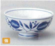
44806-109 ざくろ丸碗 1,100円 160入 (11.3×5.1cm)