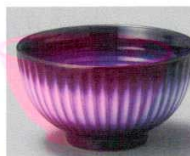
44832-579 オーロラ飯碗 550円 100入 (10.4×6.3cm)