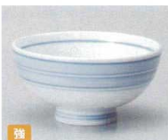
44824-579 駒筋丸碗 720円 111入 (11.5×5.8cm)