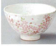
44816-579 桜すずく飯碗(大) 930円 90入 (11.6×6.6cm)