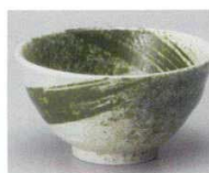
44838-279 志野サビ刷毛飯碗小 480円 120入 (10.7×6.3cm)