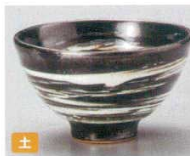
44807-279 黒釉刷毛目飯碗 1,130円 100入 (11.5×6.6cm・300cc)