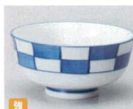
44819-559 染付市松汁碗 850円 100入 (12×6cm)