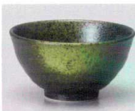
44836-279 黒金彩手引3.6飯碗 500円 100入 (11.7×6.2cm)