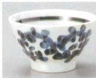
44809-139 たご唐草くらわんか茶碗 980円 80入 (11.3×6.8cm)