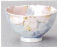
44801-519 ピンク花飯碗 2,400円 60入 (11.3×6.3cm)