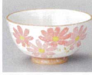
44815-199 粉引コスモス茶碗 820円 120入 (11.2×5.8cm)