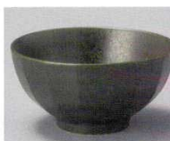
44841-459 色釉黒型入茶碗 460円 120入 (11.5×5.8cm・300cc)