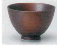
44813-459 黒伊賀吹飯碗 950円 120入 (10.4×7.1cm)