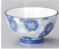
44803-319 華々(青)高台茶碗 1,300円 100入 (11.2×6cm)