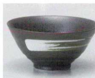
44833-469 黒斑点白刷毛平成茶碗 480円 120入 (11.9×6cm)