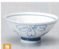
44823-559 一珍花割中平 700円 120入 (11.5×5cm)