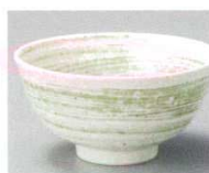
44837-199 刷毛目粉引茶碗(大) 500円 100入 (12.2×6.5cm)