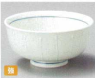
44812-559 ヒワ磁一珍十草汁碗 930円 (11.7×6cm)