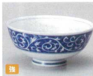
44808-149 唐草丸碗 1,050円 120入 (11.3×5.1cm・220cc)