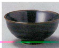
44827-139 ゆず天目茶碗 500円 (11.3×5.5cm)