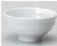
44810-029 白ろくろ目飯碗 960円 120入 (11.8×6cm)