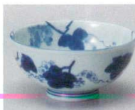
44828-179 藍染ぶどう軽量茶碗 570円 120入 (11.5×5.6cm)