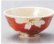
44802-579 赤絵桜飯碗 1,450円 111入 (12.4×6cm)