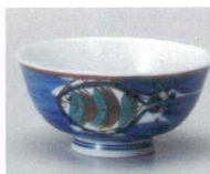
44821-549 厚口魚汁碗 880円 120入 (12×5.6cm)