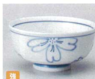
44820-559 一珍花割汁碗 850円 120入 (12×6cm)