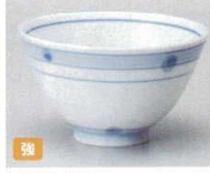
44814-559 タミライン夏目型飯碗(大) 920円 80入 (11.7×6.9cm)