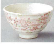
44817-579 桜すずく飯碗(小) 880円 120入 (10.1×6.3cm)