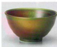
44834-279 朱金彩飯碗大 500円 100入 (11.7×6.2cm)