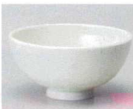
44830-199 雪粉引軽量茶碗 550円 120入 (12×6cm)