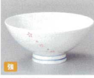
44818-559 小町ピンク中平 780円 100入 (11.7×5cm)