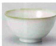
44839-279 粉引手引3.6飯碗 470円 100入 (11.7×6.2cm)