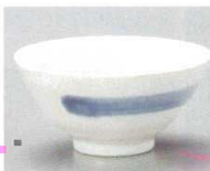
44829-319 清瀬平成茶碗 570円 100入 (11.9×6cm)