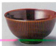
44825-409 アメ十草中 660円 100入 (11.2×5.9cm)