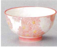
44804-319 華々(赤)高台茶碗 1,300円 100入 (11.2×6cm)