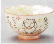
44805-579 はじめ招き猫茶碗 1,400円 95入 (11×6.5cm)