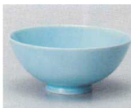
44822-029 深山青磁茶碗 770円 120入 (12×5.4cm)