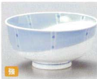
44811-559 内外水玉汁碗 930円 80入 (11.7×6cm)