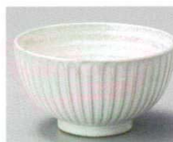
44831-579 粉引飯碗 550円 100入 (10.4×6.3cm)