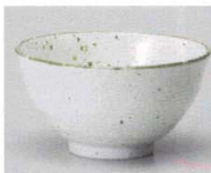
44835-279 白唐津手引3.6飯碗 500円 100入 (11.7×6.2cm)