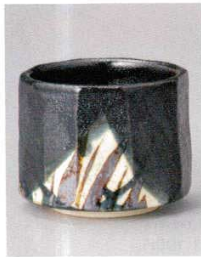
45501-519 黒織部面取一客湯呑 4,000円 40入 (9×7.8cm・300cc)