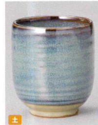
45525-199 灰織部寿司湯呑 850円 60入 (8×9.3cm・360cc)