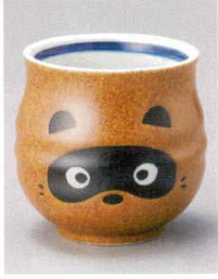
45517-199 たぬき寿司湯呑 1,200円 60入 (8.5×9cm・340cc)