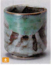
45505-309 青志野塗分平型寿司湯呑 1,250円 10×6入 (9×9.7cm・360cc)