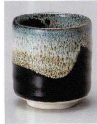
45513-459 黒釉流平型寿司湯呑 1,200円 60入 (8.9×9.7cm・360cc)