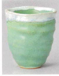
45522-269 深海マツ新六兵衛中寿司湯呑 880円 80入 (8.3×9.7cm・230cc)