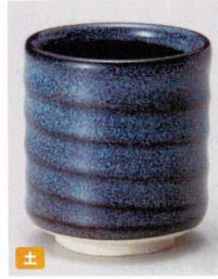
45515-309 紺なまこ平形寿司 1,250円 60入 (9×10cm・360cc)