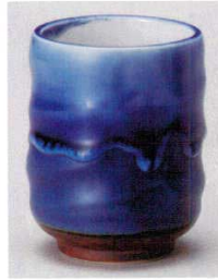
45514-319 ブルー六兵寿司湯呑 1,150円 10×6入 (8×10.5cm・380cc)