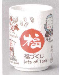
45528-239 福づくし中寿司湯呑 820円 80入 (7.2×10cm・270cc)