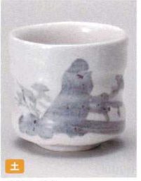
45506-309 白志野山水筒茶碗 2,200円 40入 (10.2×10.2cm・500cc)