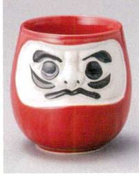
45510-199 だるま(赤)寿司湯呑 1,400円 50入 (7.5×9.5cm・350cc)