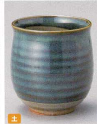
45527-199 緑袖寿司湯呑 800円 60入 (8.2×9.3cm・350cc)