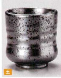
45516-309 油滴天目平型寿司湯呑 1,250円 10×6入 (9×9.8cm・330cc)