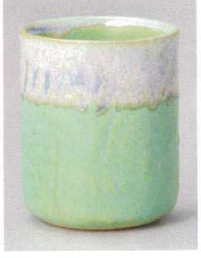
45524-269 深海マツ布目中寿司湯呑 880円 80入 (7.5×7.5×9.5cm・310cc)