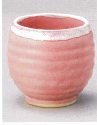
45523-269 窯変ピンクタル型寿司湯呑 850円 60入 (9×8.2cm・300cc)