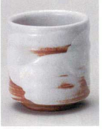
45512-459 志野刷毛平型寿司湯呑 1,200円 60入 (8.9×9.7cm・360cc)