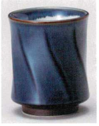
45518-309 ナマコ八角寿司 1,050円 10×6入 (8.7×10.8cm・380cc)