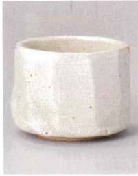
45503-519 錆かいらぎ面取一客湯呑 4,000円 40入 (9×7.8cm・300cc)