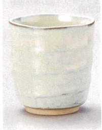
45530-209 均窯グリーン寿司湯呑 700円 10×6入 (8.6×9.3cm・320cc)