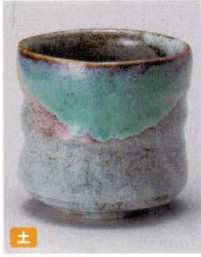
45504-309 青志野筒茶碗 2,200円 40入 (10.2×10.2cm・500cc)