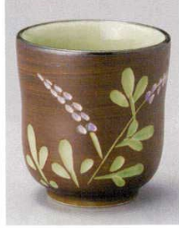
45509-259 サビダミはぎ瓢箪型寿司湯呑 1,300円 60入 (8×9cm・300cc)