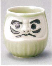
45511-199 だるま(若緑)寿司湯呑 1,400円 50入 (7.5×9.5cm・350cc)