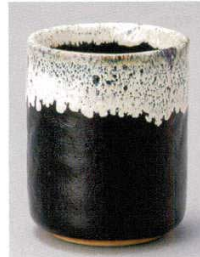
45526-269 ゆず天目白糸布目中寿司湯呑 800円 80入 (7.5×9.5cm・310cc)