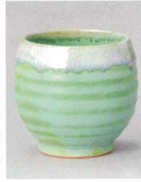
45521-269 深海マツたる湯呑 880円 80入 (9×8.2cm・300cc)