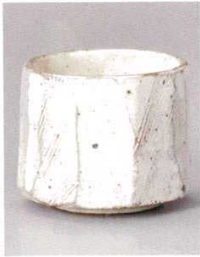
45502-519 粉引面取一客湯呑 4,000円 40入 (9×7.8cm・300cc)