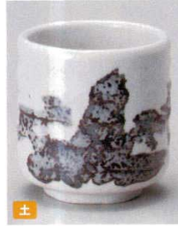
45507-309 白志野山水平形寿司 1,250円 60入 (9×10cm・360cc)