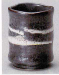
45508-319 ねずみ白帯寿司湯呑 1,400円 10×6入 (8.2×10.8cm・350cc)