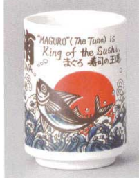
45529-239 まぐろ中寿司湯呑 820円 80入 (7.2×10cm・270cc)