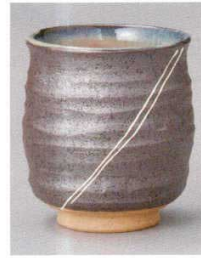
45519-319 黒流星六兵寿司 930円 10×8入 (8×9.2cm・320cc)