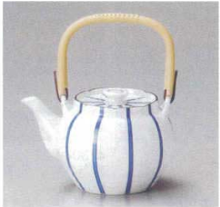
47406-739 一珍十草10号土瓶(有田焼) 8,900円 1入 (17×14cm・1,800cc)