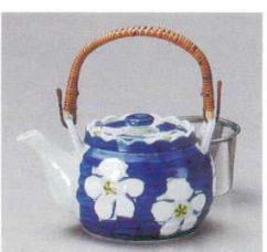
47424-739 りぼんU付6号土瓶(有田焼) 5,200円 1×24入 (13.5×11cm・900cc)