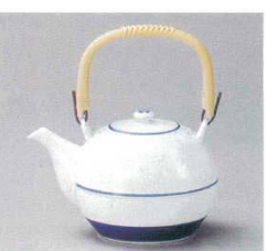
47426-739 丸数カゴU付6号土瓶(有田焼) 5,300円 1×24入 (13.5×11cm・900cc)