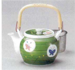
47417-739 グリーン巻蝶U付10号土瓶(有田焼) 8,200円 1×12入 (16.5×13.5cm・1,800cc)