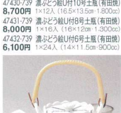
47430-739 濃ぶどう絵U付10号土瓶(有田焼) 8,700円 1×12入 (16.5×13.5cm・1,800cc)