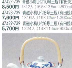
47427-739 青磁小梅U付10号土瓶(有田焼) 8,500円 1×12入 (16.5×13.5cm・1,800cc)