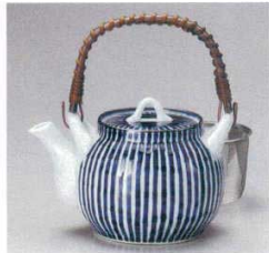
47401-739 鎌倉十草U付8号土瓶(有田焼) 9,600円 1×16入 (15.5×14.5cm・1,400cc)