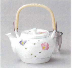
47423-739 りぼんU付8号土瓶(有田焼) 6,700円 1×16入 (15.5×12.5cm・1,400cc)