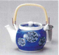
47425-739 丸数カゴU付8号土瓶(有田焼) 6,900円 1×16入 (15.5×12.5cm・1,100cc)