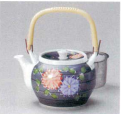
47412-739 一珍菊絵U付8号土瓶(有田焼) 7,200円 1×16入 (15.5×12.5cm・1,400cc)