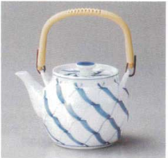
47409-739 京網10号土瓶(有田焼) 8,900円 1入 (16.5×14.5cm・1,800cc)