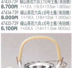
47433-739 緑山茶花六兵衛10号土瓶(有田焼) 8,700円 1×12入 (16.5×13.5cm・1,800cc)