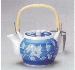
47420-739 呉須巻蝶U付10号土瓶(有田焼) 8,200円 1×12入 (16.5×13.5cm・1,800cc)