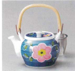
47414-739 唐草花U付10号土瓶(有田焼) 8,200円 1×12入 (16.5×13.5cm・1,800cc)