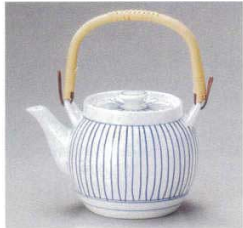
47403-739 立杵10号土瓶(有田焼) 8,900円 1入 (16.5×14.5cm・1,800cc)