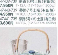
47439-739 夢路10号土瓶(有田焼) 7,950円 1×12入 (17×15cm・1,900cc)