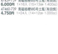
47446-739 ゴス巻U付8号土瓶(有田焼) 7,600円 1入 (16×12cm・1,300cc)