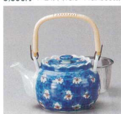
47415-739 唐草花U付8号土瓶(有田焼) 7,000円 1×16入 (15.5×12.5cm・1,400cc)