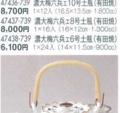
47436-739 濃大梅六兵衛10号土瓶(有田焼) 8,700円 1×12入 (16.5×13.5cm・1,800cc)