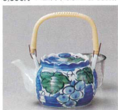
47418-739 グリーン巻蝶U付8号土瓶(有田焼) 7,000円 1×16入 (15.5×12.5cm・1,400cc)