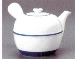
47907-739 夢路M急須 (有田焼) 3,200円 2×15入 (11×10cm・500cc)