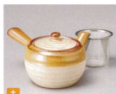
47930-199 白萩茶流し急須 2,200円 40入 (17×11×9cm・420cc)