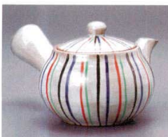
47926-319 染錦十草急須3号 2,750円 6×8入 (10×8.5cm・580cc)