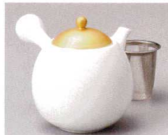
47918-139 金彩玉急須 (カゴアミ付) 3,400円 36入 (13×10.5×11.3cm・470cc) (給付日本) 中国製