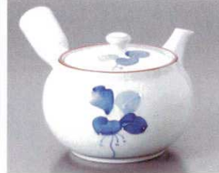
47908-739 まんりょう中急須 (有田焼) 3,600円 2×15入 (11×8.5cm・400cc)