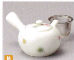
47920-139 クローバー急須 2,000円 24入 (350cc)