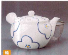
47916-279 一珍梅急須 2,700円 1×30入 (10.8×9cm・400cc)