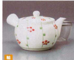
47914-279 祥瑞急須 2,700円 1×30入 (10.8×9cm・400cc)