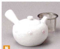
47924-139 紅梅急須 2,000円 24入 (350cc)