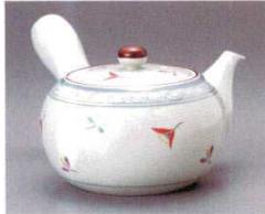
47901-739 花小紋M中急須 (有田焼) 4,500円 2×15入 (11.5×8.5cm・350cc)