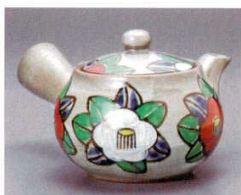
47927-319 染錦椿急須3号 2,750円 6×8入 (10×8.5cm・580cc)