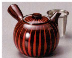
47923-139 赤十草豆急須 (カゴアミ付) 4,200円 24入 (13×10×9cm・420cc)