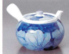
47909-739 濃葉彩M中急須 (有田焼) 4,100円 2×15入 (11.5×8.5cm・450cc)