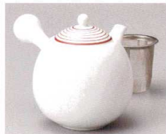
47919-139 赤駒筋玉急須 (カゴアミ付) 3,400円 36入 (13×10.5×11.3cm・470cc) (給付日本) 中国製