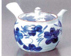
47906-739 染花紋M急須 (有田焼) 3,500円 2×15入 (11×9.5cm・350cc)