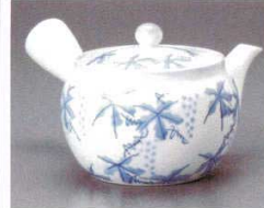
47910-739 ぶどうM中急須 (有田焼) 3,400円 2×15入 (11×8.5cm・350cc)