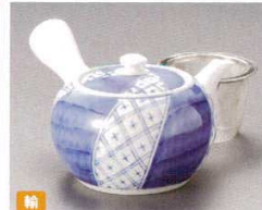
47915-139 祥瑞急須 2,000円 2×12入 (350cc)