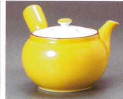
47905-739 黄釉草花M急須 (有田焼) 3,800円 2×15入 (11.5×8.5cm・450cc)