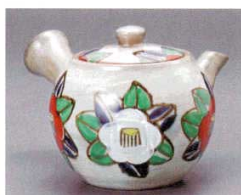
47928-319 染錦椿2号急須 2,500円 6×10入 (9.5×9cm・360cc)