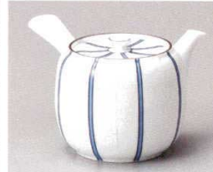
47904-739 一珍十草中急須 4,500円 2入 (10×9cm・450cc)