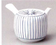
47902-739 立枠中急須 4,500円 2入 (10×9cm・450cc)