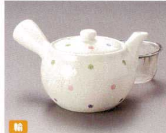
47912-189 水玉淡雪急須 (アミ付) 2,300円 2×12入 (350cc)