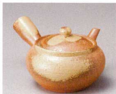
47922-669 信楽急須 (小) 7,000円 (21×18×10cm)