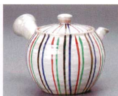
47929-319 染錦十草急須2号 2,500円 6×8入 (9.5×9cm・360cc)