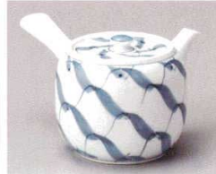
47903-739 京網中急須 4,500円 2入 (10×9cm・450cc)