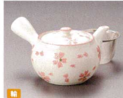
47913-189 さくら淡雪急須 (アミ付) 2,300円 2×12入 (350cc)