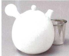
47911-139 白磁玉急須 (カゴアミ付) 2,800円 (13×10.5×11.3cm・470cc)