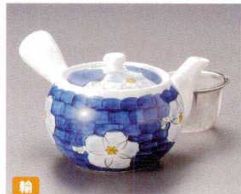
47917-189 タミ間取花急須 (アミ付) 2,300円 2×12入 (350cc)