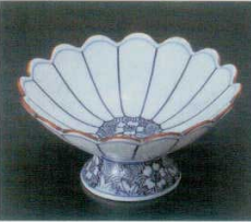
49004-719 染付線割菊型中付(有田焼) 4,200円 80入(12×5.5cm)