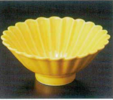
49022-719 黄釉菊彫中付(有田焼) 2,000円 80入(12.5×5cm)