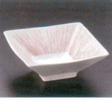
49013-719 淵赤十草ナブリ角中付(有田焼) 2,800円 80入(11.5×11.5×4.2cm)