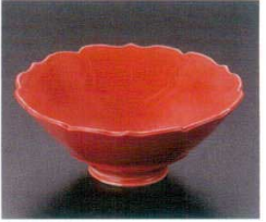
49025-719 赤釉桔梗淵中付(有田焼) 1,800円 80入(12.3×5cm)