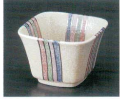
49011-719 虹十草正角中付(有田焼) 3,000円 80入(7.5×7.5×5.3cm)