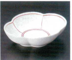
49020-719 赤線淵取木甲中付(有田焼) 2,300円 80入(12.3×10.3×3cm)