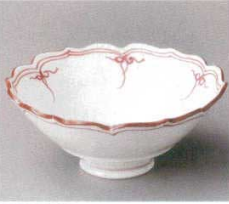
49023-719 環紋絞高台中付(有田焼) 2,000円 80入(12.5×5cm)