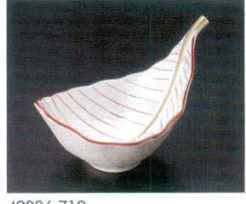
49006-719 ラスター朱金葉型中付(有田焼) 4,100円 80入(14.5×9×10cm)