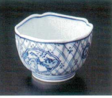
49012-719 地紋山水角中付(有田焼) 3,000円 80入(7×7×5.3cm)