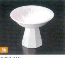
49007-719 白砂ピンク雲母八角高台中付(有田焼) 4,000円 80入(10×7.4cm)