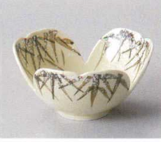
49014-719 雪管割山椒中付(有田焼) 2,800円 80入(12×6cm)