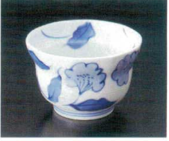
49015-719 唐花ナブリ中付(有田焼) 2,700円 80入(10.6×7cm)