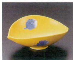
49026-719 黄釉木の葉レモン型中付(有田焼) 1,800円 80入(13.5×10.5×4.5cm)