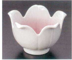
49021-719 白磁ピンク花型中付(有田焼) 2,100円 80入(9×5.7cm)