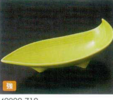
49009-719 ヒワ釉一方上り笹型中付(有田焼) 3,400円 80入(16.5×7×5.5cm)