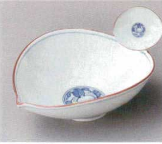
49024-719 見込牡丹レモン型中付(有田焼) 1,800円 80入(13.5×10.8×4.5cm)