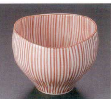
49027-719 内外十草壺型中付(有田焼) 1,800円 80入(10×8cm)