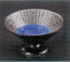
49002-719 天目ルリプラチナ菊型中付(有田焼) 4,300円 80入(11.2×6cm)