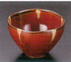
49018-719 南天赤流中付(有田焼) 2,300円 80入(9.5×6cm)