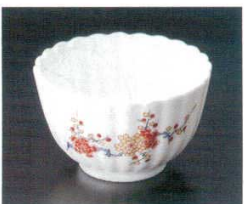
49030-719 柿右衛門写 梅中付(有田焼) 700円 80入(7.8×6cm)