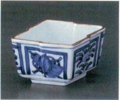
49005-719 染付芙蓉手中付(有田焼) 4,200円 80入(11×8.7×5.7cm)