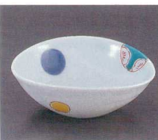
49029-719 花丸紋変型中付(有田焼) 1,600円 80入(13×11×4.6cm)