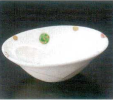
49003-719 四色丸紋双葉中付(有田焼) 4,300円 80入(13.3×9.7×4.3cm)