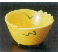
49028-719 黄釉グリーン流のし型中付(有田焼) 1,800円 80入(9.5×9×5cm)