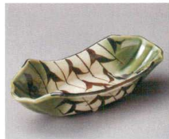
49016-719 織部袖掛分芦船型中付(有田焼) 2,700円 80入(18.5×7.5×4.5cm)