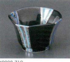
49008-719 プラチナブルー流水黒釉中付(有田焼) 3,800円 80入(9×9×5.7cm)