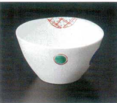
49019-719 錦丸紋中付(有田焼) 2,300円 80入(11×5.8cm)