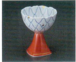
49001-719 金箔アミ絵赤吹中付(有田焼) 4,700円 80入(8.8×11cm)