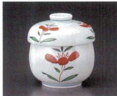
49111-719 錦万歴むし碗(有田焼) 3,800円 80入 (8.5×9cm・200cc)