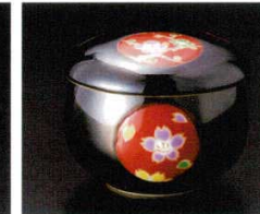
49115-719 江戸小紋(小)むし碗(有田焼) 2,600円 80入 (7.8×6cm・150cc)