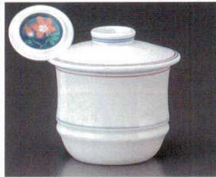
49106-719 花絵グリーン濃むし碗(有田焼) 5,600円 80入 (9×9.5cm・200cc)