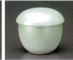
49109-719 シルバーグリーンむし碗(有田焼) 3,600円 80入 (8×7.5cm・130cc)