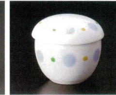
49110-719 コバルト水玉ミニむし碗(有田焼) 3,600円 80入 (7.3×6.2cm・110cc)