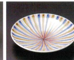
49120-719 錦十草5寸皿(有田焼) 2,800円 80入 (15×2.8cm)