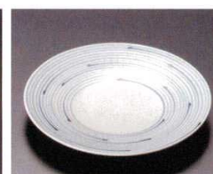
49128-719 うなぎ線5寸皿(有田焼) 2,200円 80入 (15.5×2cm)