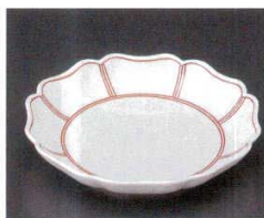
49121-719 錦木甲フルーツ皿(有田焼) 2,800円 80入 (13.5×2.8cm)