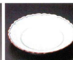
49129-719 測錆見込筋桔梗測5寸皿(有田焼) 2,000円 80入 (15×2.2cm)