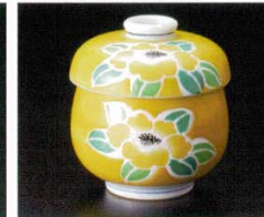
49114-719 黄巻一珍山茶花むし碗(有田焼) 3,200円 80入 (8.5×8.8cm・200cc)