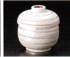
49103-719 レッドパール乱線むし碗(有田焼) 5,400円 80入 (7×7.8cm・130cc)