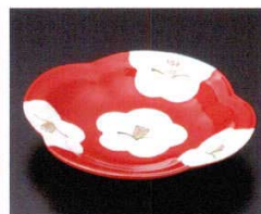
49122-719 紅赤梅円測木甲皿(有田焼) 2,700円 80入 (15×14×2cm)