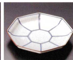
49123-719 間取八角皿(有田焼) 2,700円 80入 (17×16×2.5cm)