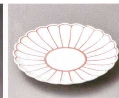
49124-719 菊割赤線取皿(有田焼) 2,500円 80入 (15×2cm)