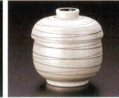
49104-719 ブラックパール乱線むし碗(有田焼) 5,400円 80入 (7×7.8cm・130cc)