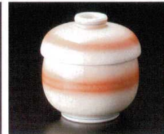
49113-719 赤帯ぼかしむし碗(有田焼) 3,400円 80入 (7.5×7.5cm・140cc)