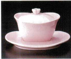
49101-719 薄ピンク釉花ツミ(台付)むし碗(有田焼) 6,300円 80入 (9.8×8×6.5cm・150cc)