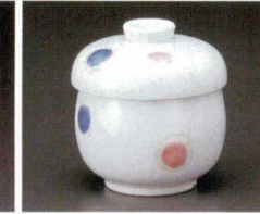
49105-719 白磁紅彩しゃぼん玉むし碗(有田焼) 5,400円 80入 (7×7.8cm・130cc)