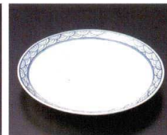
49118-719 測青海波5寸皿(有田焼) 3,200円 80入 (15.5×2cm)