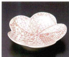
49116-719 銀彩祥瑞捻梅型皿(有田焼) 3,800円 80入 (15×3cm)