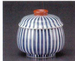
49112-719 十草むし碗(有田焼) 3,400円 80入 (8×8cm・180cc)