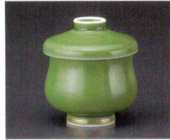
49102-719 緑釉新型むし碗(有田焼) 5,000円 80入 (8.5×8cm・200cc)