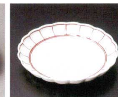
49125-719 赤絵測取5寸皿(有田焼) 2,500円 80入 (15×2cm)