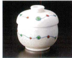
49107-719 二色玉つなぎ紅彩むし碗(有田焼) 4,700円 80入 (7.6×7.5cm・130cc)