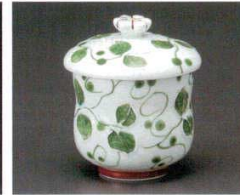
49108-719 一珍木の葉むし碗(有田焼) 3,800円 80入 (6.7×8cm・100cc)