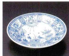
49117-719 芙蓉手測段5寸皿(有田焼) 3,700円 80入 (15×3cm)