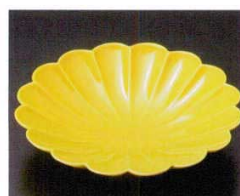
49127-719 黄釉(中)菊紋皿(有田焼) 2,300円 80入 (17×3.5cm)