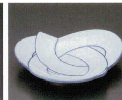
49119-719 ゴス線結び皿(有田焼) 3,100円 80入 (15.3×15×3.3cm)