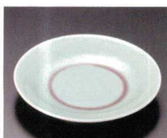
49126-719 青磁内ぼかし中皿(有田焼) 2,300円 80入 (17×2.6cm)