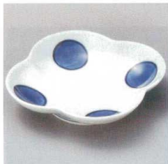
49229-719 丸紋濃木甲小皿(有田焼) 1,400円 100入 (11×10×2.3cm)