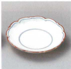
49231-719 見込筋瀏鏗桔梗瀏小皿(有田焼) 1,000円 100入 (9.5×1.8cm)