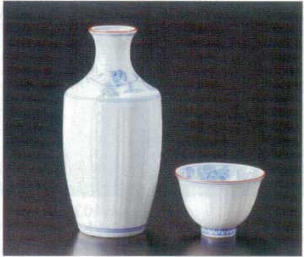
49206-719 瀏唐草徳利(有田焼) 2,300円 150入 (180cc) 49207-719 瀏唐草盃(有田焼) 2,000円 500入