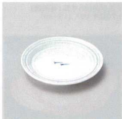
49226-719 メダカ リム3寸小皿(有田焼) 1,600円 100入 (9.2×1.2cm)