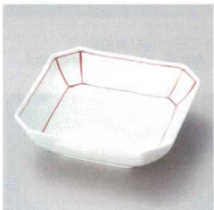
49222-719 赤絵淵取隅切小皿(有田焼) 2,300円 100入 (10×10×3cm)