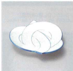
49220-719 ゴス線結び小皿(有田焼) 2,600円 100入 (11×9.5×1.8cm)