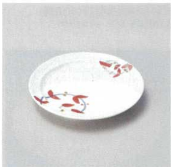
49227-719 鏗唐草リーフ リム3寸小皿(有田焼) 1,600円 100入 (9.2×1.2cm)