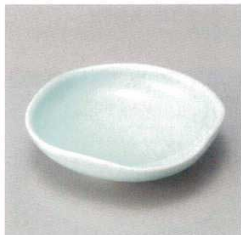
49224-719 青白磁四方ナブリ小皿(有田焼) 1,900円 100入 (8.8×8.8×2.3cm)