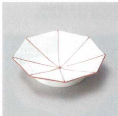
49225-719 太白赤絵八角小皿(有田焼) 1,900円 100入 (10.6×2cm)