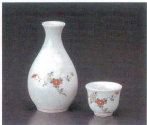
49212-719 柿右衛門写 菊徳利(有田焼) 1,600円 150入 (200cc) 49213-719 柿右衛門写 菊盃(有田焼) 1,200円 500入