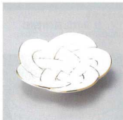
49218-719 金線梅結び小皿(有田焼) 3,500円 100入 (11×1.8cm)