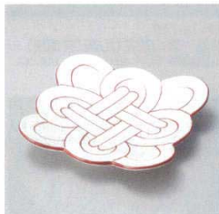
49219-719 赤線吉祥結び小皿(有田焼) 3,000円 100入 (10.5×10.5×2.3cm)