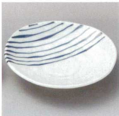
49232-719 つれづれ十草小皿(有田焼) 900円 100入 (10.5×2.5cm)