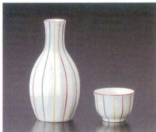
49210-719 アイボリー三色十草徳利(有田焼) 2,000円 150入 (150cc) 49211-719 アイボリー三色十草盃(有田焼) 1,400円 500入