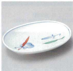
49221-719 ナス胡椒小判小皿(有田焼) 2,500円 100入 (14.3×9.7×2cm)