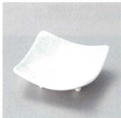
49223-719 一珍格子三つ足正角小皿(有田焼) 1,900円 100入 (8.5×8.5×3cm)