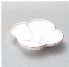
49228-719 格子紋木甲小皿(有田焼) 1,600円 100入 (11×10×2cm)