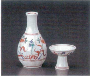
49204-719 白万歴徳利(有田焼) 3,400円 150入 (150cc) 49205-719 白万歴盃(有田焼) 1,700円 500入