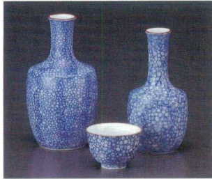
49201-719 油滴2合徳利(有田焼) 3,500円 80入 (270cc) 49202-719 油滴1合徳利(有田焼) 2,000円 150入 (150cc) 49203-719 油滴盃(有田焼) 900円 500入