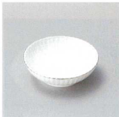
49230-719 白マット瀏銀小皿(有田焼) 1,200円 100入 (8.5×2.5cm)