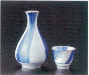
49208-719 流水徳利(有田焼) 2,100円 150入 (130cc) 49209-719 流水盃(有田焼) 1,500円 500入