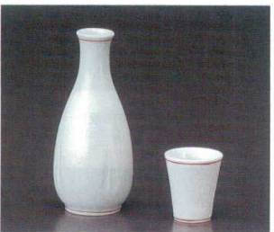
49216-719 朱線腰彫徳利(有田焼) 1,400円 150入 (150cc) 49217-719 朱線腰彫盃(有田焼) 900円 500入