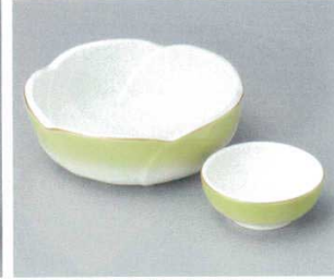
05031-589 梅型グリーン刺身鉢 1,530円 40入 (14.3×4.6cm) 05032-589 梅型グリーン丸千代口 830円 120入 (7.5×2.8cm)