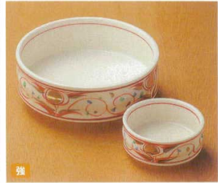
強 05007-589 赤絵華紋刺身鉢 4,430円 40入 (14.2×5.5cm) 05008-589 赤絵華紋千代久 1,640円 120入 (7.8×3.7cm)