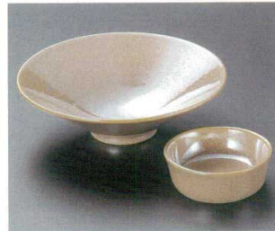
05025-469 虹彩白浅鉢 1,600円 60入 (14.3×4.2cm) 05026-469 虹彩白千代口 800円 120入 (7×2.5cm)