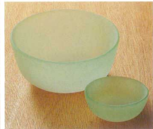
05015-279 ガラス若草刺身鉢 3,900円 60入 (13×5.5cm) ※ガラス 05016-279 ガラス若草千代口 2,500円 5×18入 (7.5×3.5cm) ※ガラス