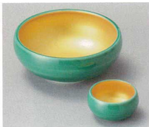
05011-459 緑交趾内金彩丸刺身鉢 3,750円 50入 (13.7×5.1cm) 05012-459 緑交趾内金彩千代口 1,800円 100入 (6.1×3cm)