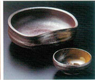
05023-319 備前刺身鉢 2,700円 80入 (14.3×13.3×4.5cm) 05024-319 備前千代口 880円 120入 (7.2×3cm)