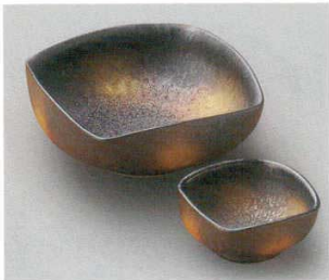
05003-739 黒柚子結晶金彩向付(有田焼) 5,500円 5×12入 (13×13×5cm) 05004-739 黒柚子結晶金彩千代口(有田焼) 2,400円 5×24入 (7.5×7.5×3cm)