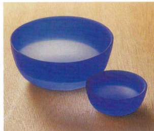
05013-279 ガラス桃山刺身鉢 4,000円 5×8入 (13×5.5cm) ※ガラス 05014-279 ガラス桃山千代口 2,500円 5×18入 (7.5×3.5cm) ※ガラス