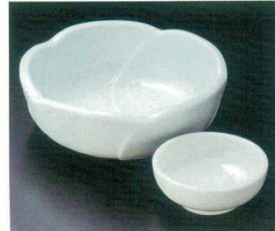
05033-559 青磁梅型刺身鉢 1,150円 60入 (14.4×5cm) 05034-559 青磁丸千代久 850円 150入 (7.5×3cm)