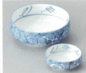
05035-579 やり梅刺身鉢 1,080円 60入 (13.5×5cm) 05036-579 やり梅丸千代口 580円 100入 (7.7×2.8cm)