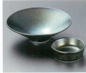
05029-469 虹彩黒浅鉢 1,600円 60入 (14.3×4.2cm) 05030-469 虹彩黒千代口 800円 120入 (7×2.5cm)