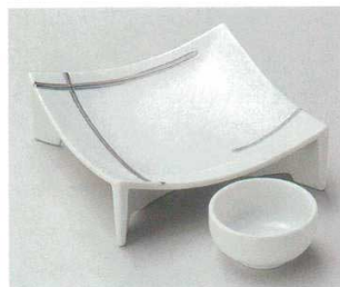
05017-139 一珍白磁プラチナ線高台四方向付 3,100円 50入 (14.1×14.1×4.7cm) 05018-139 白磁丸千代久 750円 280入 (6.3×3.3cm)