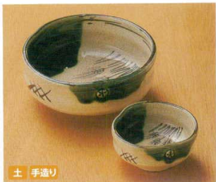
土 手造り 05001-589 両織部麦紋刺身鉢 5,130円 60入 (13.3×5cm) 05002-589 両織部麦紋千代久 2,320円 200入 (8×3.8cm)