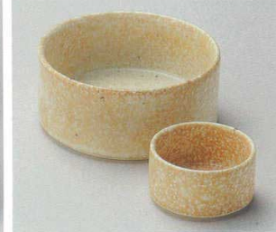
05039-409 窯変志野重ね鉢(大) 830円 60入 (11.2×5.1cm) 05040-409 窯変志野重ね鉢(小) 470円 100入 (8.3×3.4cm)