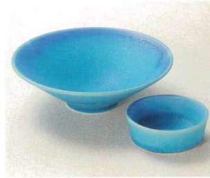
05027-469 トルコブルー浅鉢 1,600円 60入 (14.3×4.2cm) 05028-469 トルコブルー千代口 800円 120入 (7×2.5cm)