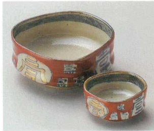
05005-179 文字入赤濃刺身鉢 4,500円 40入 (13.8×12.7×6cm) 05006-179 文字入赤濃千代久 1,550円 100入 (8×7.5×4cm)