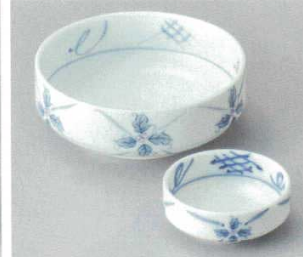
05037-549 千両丸刺身鉢 1,100円 60入 (13.5×4.8cm) 05038-549 千両丸千代久 570円 180入 (7.8×2.7cm)