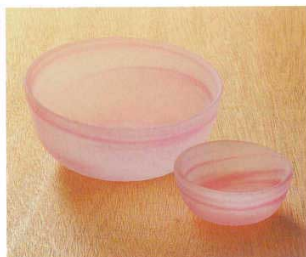
05009-279 ガラスサクラ刺身鉢 4,000円 5×8入 (13×5.5cm) ※ガラス 05010-279 ガラスサクラ千代口 2,550円 5×18入 (7.5×3.5cm) ※ガラス