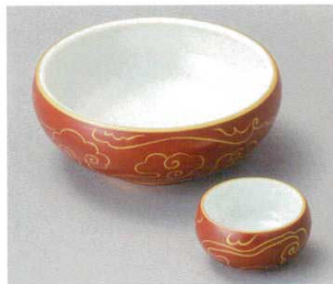
05019-459 朱巻金 瑞雲丸刺身鉢 3,250円 50入 (13.5×5.1cm) 05020-459 朱巻金 瑞雲千代口 1,600円 100入 (6.1×3cm)