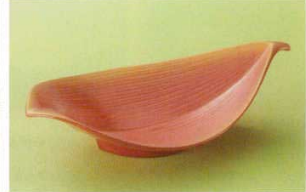
05209-179 金彩赤釉葉型8.5寸鉢 4,300円 40入 (26×15.5×6cm)