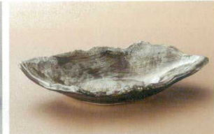
05225-459 梅花皮 黒ちぎり角中鉢 2,100円 40入 (23.4×14.5×4.7cm)