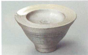
05201-669 黒窯変刷毛目7.4高台皿(信楽焼) 11,000円 12入 (22.4×13.2cm) 05202-669 黒窯変刷毛目6.0高台皿(信楽焼) 6,000円 18入 (18.2×10.7cm)