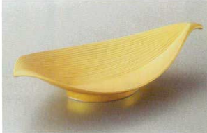
05208-149 金彩葉型8.5寸向付 4,750円 40入 (25.5×15×5.6cm)