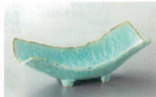
05219-139 潤錆マリンブルー一両上り向付 3,180円 50入 (24.7×10.6×8.5cm)