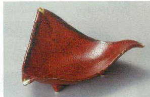
05224-149 紅柚子天目三角向付 2,800円 40入 (23×17.7×7.8cm)