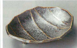
05217-149 孔雀じゃばら浅皿 3,400円 40入 (23.5×19×4.8cm)