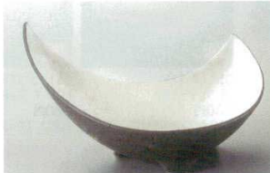
05212-139 雲母銀三日月鉢 3,950円 40入 (22.5×11×12cm)