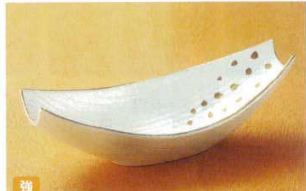
05211-589 金吹雪向付 4,020円 60入 (22.8×10×7cm)