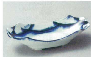
05218-579 呉須刷毛目金彩舟形向付 3,200円 40入 (23.5×10×6cm)