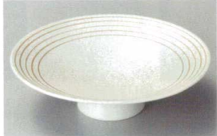
05207-479 銀河金線高台向付 4,500円 20入 (23×6.3cm)