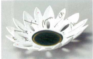
05203-149 透かし黒散し菊型前菜皿 5,600円 30入 (28.2×21.6×6.2cm)