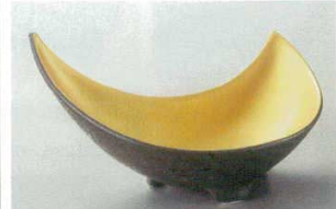
05213-139 雲母金三日月鉢 3,950円 40入 (22.5×11×12cm)