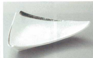
05222-149 潤プラチナ三角向付 3,100円 50入 (23.3×14×4.7cm)