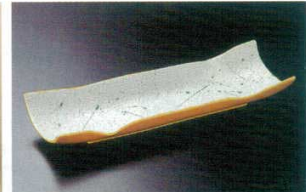
05221-179 黄釉緑散ラスター笹舟向付 3,000円 40入 (28.2×9×3.6cm)