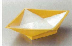
05205-149 黄釉ラスター菱型向付 4,700円 40入 (26.5×20×5cm)