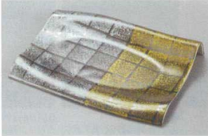
05204-179 瓦型 金銀市松向付 5,300円 (25×19×3.5cm)