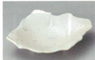
05223-479 銀河一珍菱葉向付 3,500円 30入 (24×19.5×5.2cm)