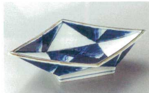
05210-149 濃菱型向付 4,250円 40入 (26.5×20.3×5.5cm)