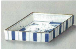
05216-149 染付山水菱形向付 3,550円 40入 (24×13.7×3.6cm)