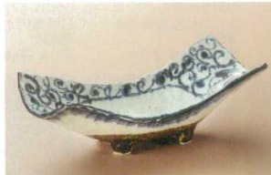
05220-149 たこ唐草足付長皿 3,100円 40入 (24.7×10.5×8cm)