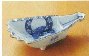
05215-179 染付春秋丸紋半開扇型向付 3,650円 40入 (22.3×11.8×5.5cm)