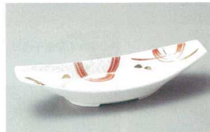
05214-479 朱刷毛目金彩舟型向付 3,800円 (29.3×10.1×6cm)