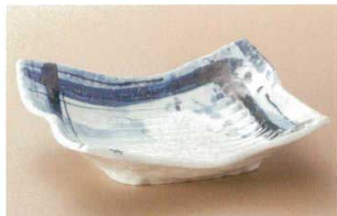
05413-149 呉須刷毛目筋彫長角鉢 3,100円 40入 (19×16.5×5cm)