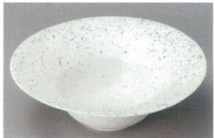
05416-469 吹き墨スینگ鉢(大) 2,300円 36入 (19.5×6.4cm) 05417-469 吹き墨スینگ鉢(小) 1,800円 48入 (16.1×4.2cm)