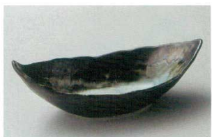
05425-109 窯変(白)舟型小鉢 950円 80入 (20.5×9.6×6.7cm)