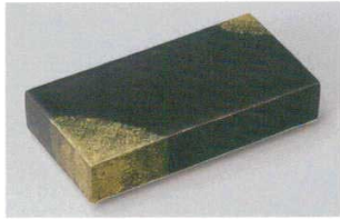
05401-179 黒金散し箱型向付 5,000円 (19.5×10×4.5cm)