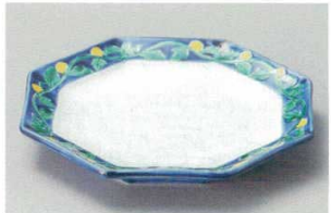
05412-149 交趾窯変草八角6.0皿 3,300円 30入 (18.7×17.5×2.5cm)