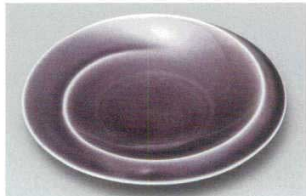
05409-469 艶紫渦巻向付 4,500円 (21.8×3.7cm)