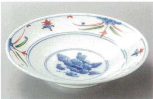
05415-449 錦牡丹草花向付 2,650円 36入 (19.5×4.5cm)