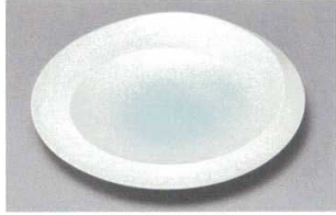
05405-469 内青白渦巻向付 4,500円 (21.8×3.7cm)