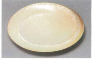
05408-469 黄地窯変渦巻向付 4,500円 (21.4×3.8cm)