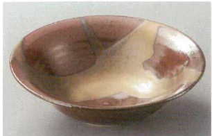
05410-669 柿釉金彩6.4丸鉢(信楽焼) 4,000円 60入 (19.3×5.6cm)