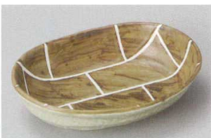
05420-319 クラフトレンガ(茶)小判鉢 1,150円 40入 (21×15.5×4.5cm)