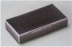
05403-469 艶紫角柱台皿 4,600円 (19.5×10×4.3cm)