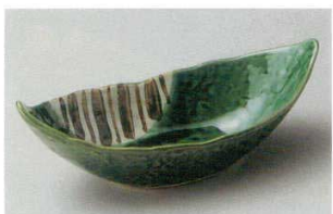
05423-109 織部十草舟型小鉢 950円 80入 (20.5×9.6×6.7cm)