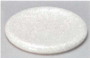
05411-469 墨貫入ロック20cm皿 3,900円 (20×2cm)