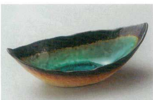
05424-109 緑彩舟型小鉢 950円 80入 (20.3×9.3×6.7cm)