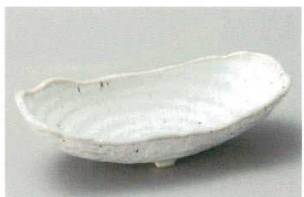
05421-579 白うのふ舟型長鉢 1,000円 50入 (19.3×9×5.3cm)