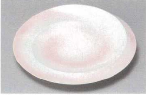
05407-469 ピンク吹渦巻向付 4,500円 (21.8×3.7cm)