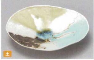
05406-149 萌たたら皿 4,200円 30入 (19.5×19×3.7cm)