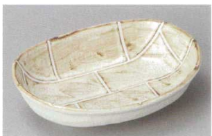
05419-319 クラフトレンガ(白)小判鉢 1,150円 40入 (21×15.5×4.5cm)