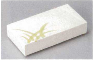
05402-189 ヒワ草紋ボックス皿 4,600円 20入 (19.5×10×4.8cm)