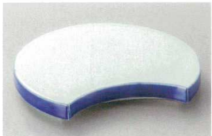
05414-179 青磁測ゴス半月皿 3,000円 36入 (19×17×2.7cm)