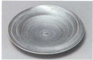
05404-469 銀彩渦巻向付 4,600円 (21.8×3.7cm)