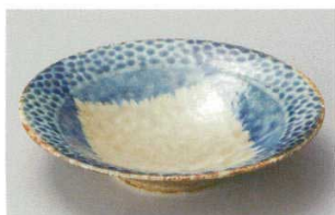
05422-109 藍染井桁目型多用鉢 860円 80入 (14.3×2.2cm)