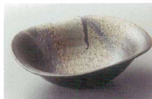
05613-669 窯変6.3変形鉢(信楽焼) 4,250円 80入 (19×18.7×5.7cm)