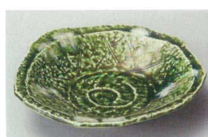
05621-579 織部結晶五角鉢 2,450円 50入 (18×17×4cm)