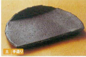
05602-309 黒陶半月皿 5,850円 30入 (18×11×4cm)