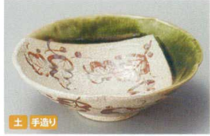
05608-149 織部草紋しぶ入花型6.0鉢 4,300円 30入 (18×6cm)