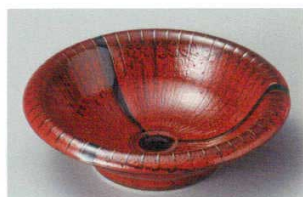
05620-149 紅柚子天目十草彫5.5向付 2,530円 50入 (17.8×5cm)