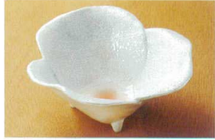
05604-149 ラスター三つ葉向付 4,700円 30入 (18×17.5×8cm)