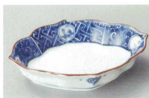
05618-149 染付丸紋山水木甲型向付 3,150円 70入 (18.5×14.5×3.8cm)