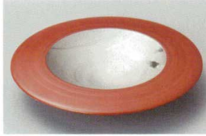
05607-149 瀬朱内プラチナ向付 4,400円 60入 (18.5×3.5cm)