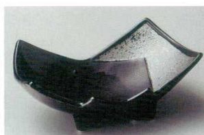
05619-109 プラチナブラック重ね鉢 3,400円 70入 (18.5×11.5×6.5cm)