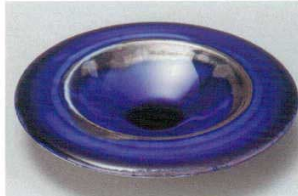
05610-149 金流しリム付向付 4,100円 (18.5×3.5cm)