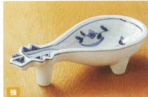
05609-149 びわ型向付 4,700円 80入 (18.5×8×4.5cm)