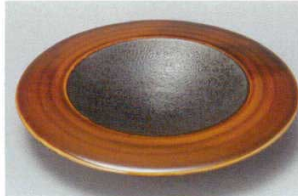
05611-149 あめ釉木目リム向付 3,900円 (18.5×3.5cm)