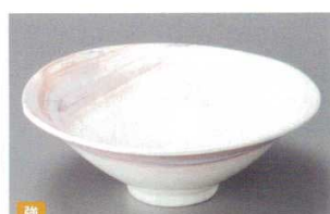
05624-259 強化バステルバイオレット厚口6寸反鉢 2,800円 50入 (18×6.5cm)