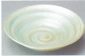
05601-459 ヒワ釉金彩六寸浅鉢 3,850円 40入 (18.5×4.3cm)