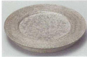
05605-669 黒窯変楠目6.0高台皿 4,500円 (18.5×3cm)