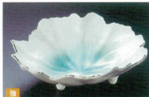
05615-249 ブルーマリン向付 3,400円 50入 (18.1×16.9×6.1cm)