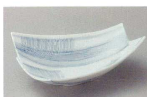
05622-199 青灰須三角向付 2,400円 60入 (18×14×6cm)