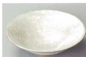
05617-519 粉引渦55平鉢 3,000円 60入 (18×5.3cm)