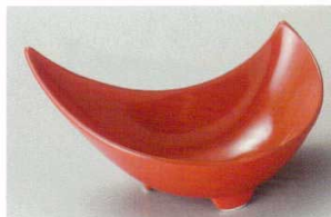
05614-149 赤釉三日月向付 3,250円 60入 (18.5×9.6×9.4cm)