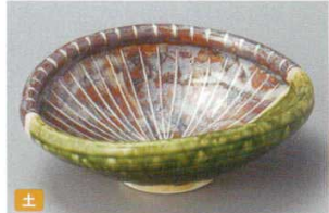
05612-519 織部線紋玉淵中鉢 4,000円 40入 (18×16×6cm)