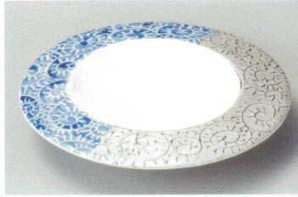
05606-149 プラチナ唐草丸向付 4,500円 60入 (18.5×3.5cm)