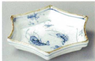
05616-149 吹墨えび絵六角6.0皿 3,250円 50入 (18.5×3.2cm)