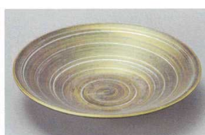
05623-459 黒御影緑金彩6寸鉢 2,250円 50入 (18×3.7cm)