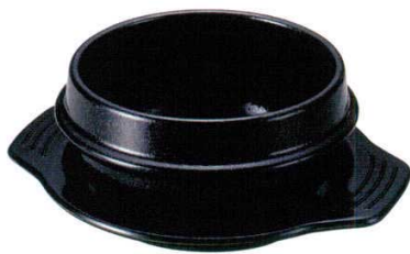
輪 57343-819 [陶器]耐熱陶器19cmチゲ鍋 3,250円 (19×9cm) 57344-819 [M]19cm用チゲ鍋受皿 1,150円 (25.6×21.7×2.9cm) 57345-819 [陶器]耐熱陶器17.5cmチゲ鍋 2,550円 (17.5×8cm) 57346-819 [M]17.5cm用チゲ鍋受皿 700円 (22.8×18.9×2.6cm) 57347-819 [陶器]耐熱陶器15.5cmチゲ鍋 2,150円 (15.5×7.2cm) 57348-819 [M]15.5cm用チゲ鍋受皿 700円 (18.8×15.7×2.4cm) 57349-819 [陶器]耐熱陶器13.5cmチゲ鍋 1,800円 (13.5×7cm) 57350-819 [M]13.5cm用チゲ鍋受皿 500円 (16×13.4×2.4cm)