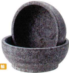
直 輪 57301-029 長水ビビンバ石鍋18cm 5,500円 10人 (18×7.5cm) 57302-029 長水ビビンバ石鍋20cm 6,600円 8人 (20×7.5cm)