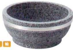
直 輪 57310-479 18cmベルト付石焼ビビンバ鍋(韓国製) 7,300円 1×8人 (18×8cm)