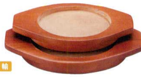
輪 57311-479 18・19cm用木台 2,100円 60人 (23.5×18.2×2.5cm) 57312-479 16cm用木台 1,850円 70人 (19.5×15.2×2.5cm)