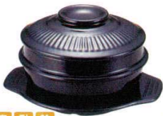
直 耐 輪 57330-029 チゲ鍋18cm蓋付 3,800円 10人 (18.5×14cm) 57331-029 チゲ鍋18cm身 2,600円 14人 (17.7×9cm・1,400cc) 57332-029 18cm用メラミン敷 710円 80人 (22.5×18.8×2.5cm)