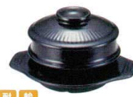
直 耐 輪 57339-029 チゲ鍋12cm蓋付 2,300円 10人 (13×10cm) 57340-029 チゲ鍋12cm身 1,570円 20人 (12×7cm・500cc) 57341-029 12cm用メラミン敷 470円 150人 (17.5×14.8×2cm)