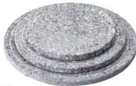
輪 57324-819 [石]18cm丸石焼プレート 3,500円 (18×1cm) 57325-819 [石]15cm丸石焼プレート 2,650円 (15×1cm) 57326-819 [石]12cm丸石焼プレート 2,100円 (12×1cm)