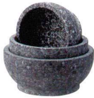
直 輪 57303-029 長水ビビンバ石鍋12cm 3,750円 10人 (12×6.5cm) 57304-029 長水ビビンバ石鍋14cm 4,510円 10人 (14×7cm) 57305-029 長水ビビンバ石鍋16cm 5,060円 10人 (16×7.3cm)