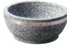
57306-029 長水石鍋18cmステン巻 5,630円 10人 (18×7.5cm)