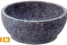
直 輪 57309-479 19cm石焼ビビンバ鍋(韓国製) 6,300円 1×8人 (19×8cm)