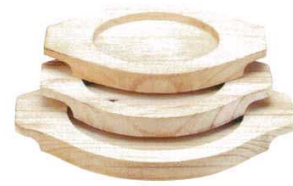
57313-029 15cm平木台 1,900円 80人 (19.6×15×2cm・内径10.8cm) 57314-029 17cm平木台 2,100円 60人 (21.6×17×2cm・内径12.8cm) 57315-029 19cm平木台 2,400円 40人 (23.7×19×2cm・内径14.8cm)