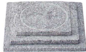
輪 57327-819 [石]18cm角石焼プレート 3,500円 (18×18×1cm) 57328-819 [石]15cm角石焼プレート 2,650円 (15×15×1cm) 57329-819 [石]12cm角石焼プレート 2,100円 (12×12×1cm)