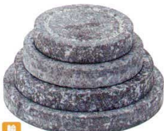
直 輪 57316-029 長水丸ステーキ石10cm 2,500円 10人 (10×2cm) 57317-029 長水丸ステーキ石12cm 2,900円 10人 (12×2cm) 57318-029 長水丸ステーキ石14cm 3,000円 10人 (14×2cm) 57319-029 長水丸ステーキ石16cm 3,400円 10人 (16×2cm)