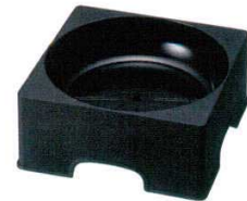
57342-819 [FRP]FRP石焼ビビンバ箱台 4,100円 (20.9×20.9×9.6cm)