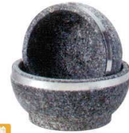
直 輪 57307-029 長水石鍋14cmステン巻 4,800円 10人 (14×7.5cm) 57308-029 長水石鍋16cmステン巻 5,200円 10人 (16×7.5cm)