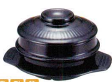
直 耐 輪 57333-029 チゲ鍋16cm蓋付 3,300円 10人 (17×12cm) 57334-029 チゲ鍋16cm身 2,200円 16人 (16×8cm・1,000cc) 57335-029 16cm用メラミン敷 630円 100人 (21.8×19.5×2.5cm)