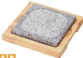
直 輪 57320-029 正角18cm焼肉プレート 7,600円 10人 (18×18×2cm) 57321-029 正角16cm焼肉プレート 6,250円 10人 (16×16×2cm) 57322-029 角23cm木台(18cm用) 3,650円 40人 (23×23×2.5cm・内寸18.7cm) 57323-029 角20cm木台(16cm用) 3,050円 40人 (20×20×2.5cm・内寸16.8cm)