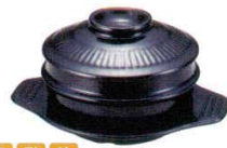
直 耐 輪 57336-029 チゲ鍋14cm蓋付 2,600円 10人 (15.5×11cm) 57337-029 チゲ鍋14cm身 1,770円 20人 (14×7.2cm・770cc) 57338-029 14cm用メラミン敷 500円 120人 (21×17×2.3cm)