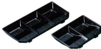
57351-819 [TA]三種タレ皿 黒タタキ 1,050円 (19.2×9×2cm) 57352-819 [TA]二種タレ皿 黒タタキ 850円 (13×9×2.2cm)