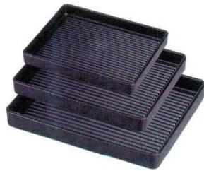
57501-819 長角肉皿 黒(塗無) 小(22cm) 1,250円 (22×17.4×4cm) ※ABS 57502-819 長角肉皿 黒(塗無) 中(26cm) 1,650円 (26×20.6×4cm) ※ABS 57503-819 長角肉皿 黒(塗無) 大(30cm) 2,250円 (30×23.8×4cm) ※ABS