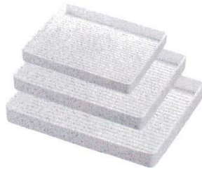
57504-819 長角肉皿 銀たたき 小(22cm) 2,100円 (22×17.4×4cm) ※ABS 57505-819 長角肉皿 銀たたき 中(26cm) 2,800円 (26×20.6×4cm) ※ABS 57506-819 長角肉皿 銀たたき 大(30cm) 3,500円 (30×23.8×4cm) ※ABS