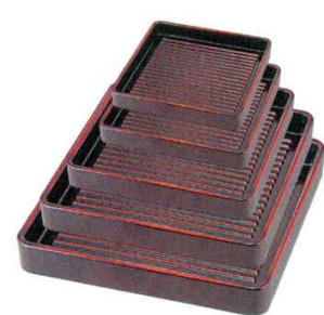
57525-819 正角肉皿 スーパー囉 ミニ(14cm) 2,200円 (14×14×4cm) ※ABS 57526-819 正角肉皿 スーパー囉 1人用(16cm) 2,200円 (16.5×16.5×3.3cm) ※ABS 57527-819 正角肉皿 スーパー囉 2人用(20cm) 2,400円 (19.8×19.8×3.3cm) ※ABS 57528-819 正角肉皿 スーパー囉 3人用(24cm) 3,100円 (24×24×3.3cm) ※ABS 57529-819 正角肉皿 スーパー囉 5人用(27cm) 3,500円 (27×27×3.3cm) ※ABS