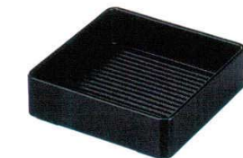
57530-819 20cm深型正角肉皿 黒(塗無) 2,000円 (20×20×6.2cm) ※ABS