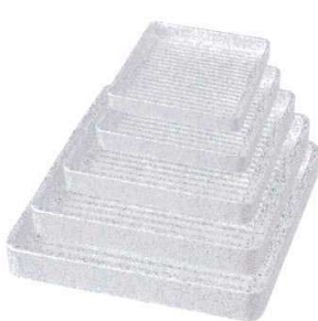
57515-819 正角肉皿 銀たたき ミニ(14cm) 1,600円 (14×14×4cm) ※ABS 57516-819 正角肉皿 銀たたき 1人用(16cm) 1,650円 (16.5×16.5×3.3cm) ※ABS 57517-819 正角肉皿 銀たたき 2人用(20cm) 1,800円 (19.8×19.8×3.3cm) ※ABS 57518-819 正角肉皿 銀たたき 3人用(24cm) 2,800円 (24×24×3.3cm) ※ABS 57519-819 正角肉皿 銀たたき 5人用(27cm) 3,300円 (27×27×3.3cm) ※ABS