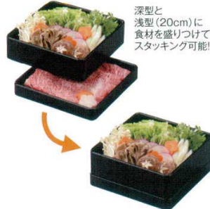
深型と浅型(20cm)に食材を盛りつけてスタッキング可能!