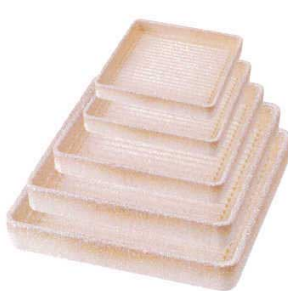
57520-819 正角肉皿 志野 ミニ(14cm) 1,750円 (14×14×4cm) ※ABS 57521-819 正角肉皿 志野 1人用(16cm) 1,750円 (16.5×16.5×3.3cm) ※ABS 57522-819 正角肉皿 志野 2人用(20cm) 2,000円 (19.8×19.8×3.3cm) ※ABS 57523-819 正角肉皿 志野 3人用(24cm) 2,850円 (24×24×3.3cm) ※ABS 57524-819 正角肉皿 志野 5人用(27cm) 3,300円 (27×27×3.3cm) ※ABS