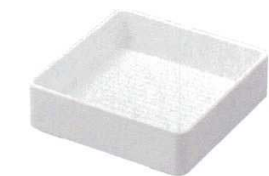
57531-819 21cm深型正角肉皿 白(塗無) 2,400円 (20×20×6.2cm) ※ABS