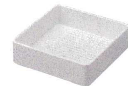
57532-819 22cm深型正角肉皿 銀たたき 3,100円 (20×20×6.2cm) ※ABS