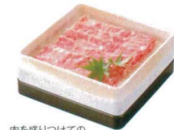
肉を盛りつけてのスタッキング可能!