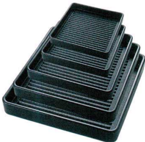
57510-819 正角肉皿 黒(塗無) ミニ(14cm) 850円 (14×14×4cm) ※ABS 57511-819 正角肉皿 黒(塗無) 1人用(16cm) 900円 (16.5×16.5×3.3cm) ※ABS 57512-819 正角肉皿 黒(塗無) 2人用(20cm) 1,050円 (19.8×19.8×3.3cm) ※ABS 57513-819 正角肉皿 黒(塗無) 3人用(24cm) 1,500円 (24×24×3.3cm) ※ABS 57514-819 正角肉皿 黒(塗無) 5人用(27cm) 1,850円 (27×27×3.3cm) ※ABS