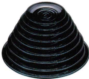
57533-819 7寸神龍鉢 黒パール(全面塗) 2,070円 (φ21×3.6cm) ※ABS 57534-819 8寸神龍鉢 黒パール(全面塗) 2,800円 (φ24.2×3.8cm) ※ABS 57535-819 9寸神龍鉢 黒パール(全面塗) 3,750円 (φ27.2×3.9cm) ※ABS 57536-819 10寸神龍鉢 黒パール(全面塗) 4,500円 (φ30×4.1cm) ※ABS 57537-819 11寸神龍鉢 黒パール(全面塗) 5,300円 (φ33.3×4.4cm) ※ABS 57538-819 12寸神龍鉢 黒パール(全面塗) 6,050円 (φ36×4.5cm) ※ABS 57539-819 13寸神龍鉢 黒パール(全面塗) 6,700円 (φ39.4×5cm) ※ABS 57540-819 14寸神龍鉢 黒パール(全面塗) 8,600円 (φ42×5.2cm) ※ABS 57541-819 15寸神龍鉢 黒パール(全面塗) 10,100円 (φ45.5×5.5cm) ※ABS