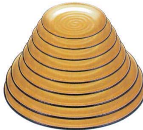
57542-819 7寸神龍鉢 金粉蒔き(全面塗) 2,950円 (φ21×3.6cm) ※ABS 57543-819 8寸神龍鉢 金粉蒔き(全面塗) 3,950円 (φ24.2×3.8cm) ※ABS 57544-819 9寸神龍鉢 金粉蒔き(全面塗) 5,500円 (φ27.2×3.9cm) ※ABS 57545-819 10寸神龍鉢 金粉蒔き(全面塗) 6,600円 (φ30×4.1cm) ※ABS 57546-819 11寸神龍鉢 金粉蒔き(全面塗) 7,700円 (φ33.3×4.4cm) ※ABS 57547-819 12寸神龍鉢 金粉蒔き(全面塗) 8,800円 (φ36×4.5cm) ※ABS 57548-819 13寸神龍鉢 金粉蒔き(全面塗) 9,750円 (φ39.4×5cm) ※ABS 57549-819 14寸神龍鉢 金粉蒔き(全面塗) 12,100円 (φ42×5.2cm) ※ABS 57550-819 15寸神龍鉢 金粉蒔き(全面塗) 14,900円 (φ45.5×5.5cm) ※ABS