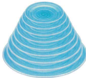
57551-819 7寸神龍鉢 青磁 2,000円 (φ21×3.6cm) ※ABS 57552-819 8寸神龍鉢 青磁 2,650円 (φ24.2×3.8cm) ※ABS 57553-819 9寸神龍鉢 青磁 3,650円 (φ27.2×3.9cm) ※ABS 57554-819 10寸神龍鉢 青磁 4,200円 (φ30×4.1cm) ※ABS 57555-819 11寸神龍鉢 青磁 4,750円 (φ33.3×4.4cm) ※ABS 57556-819 12寸神龍鉢 青磁 5,400円 (φ36×4.5cm) ※ABS 57557-819 13寸神龍鉢 青磁 5,950円 (φ39.4×5cm) ※ABS 57558-819 14寸神龍鉢 青磁 7,350円 (φ42×5.2cm) ※ABS 57559-819 15寸神龍鉢 青磁 9,000円 (φ45.5×5.5cm) ※ABS