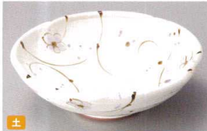
05905-149 粉引小花唐草向付 3,400円 30入 (18×5.7cm)