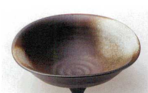
05923-479 白吹天目三ツ足大鉢 960円 70入 (17×17×5.3cm)