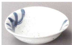
05916-259 呉須流しなぶり向付 1,750円 60入 (17.4×16.5×5.5cm)