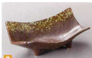
05914-589 信楽吹向付 2,070円 40入 (17.5×10.5×6cm)