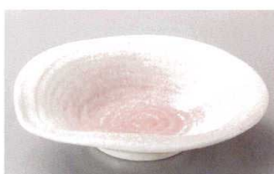
05918-459 桜雪片口刺身鉢 1,730円 50入 (17.5×17×4cm)