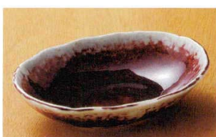
05919-269 辰砂楕円小鉢 1,300円 80入 (17.5×12.7×3.8cm)