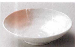
05921-459 春がすみあわせ向付 1,200円 40入 (17.5×16×5.5cm)