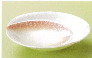
05911-139 オレンジ吹ラスター勾玉平鉢 (中) 2,750円 50入 (16.7×16×4cm)