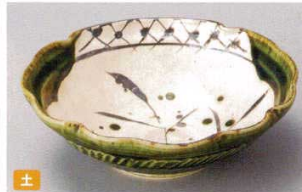
05906-149 織部草花紋向付 3,300円 30入 (18×5.5cm)