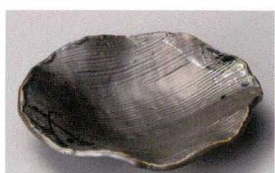
05920-259 黒釉織部流し三つ足6寸鉢 1,150円 60入 (17.5×4cm)