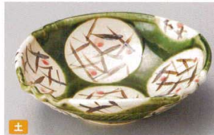
05907-149 丸紋芦向付 3,550円 30入 (18×5.5cm)