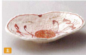
05902-199 志野双葉小鉢 3,500円 90入 (17.5×11×3.5cm)