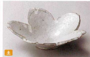
05904-149 粉引花型向付 3,500円 50入 (17.5×5.5cm)