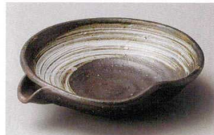
05908-669 炭化刷毛目片口向付 (信楽焼) 3,600円 70入 (17.5×15.5×4cm)