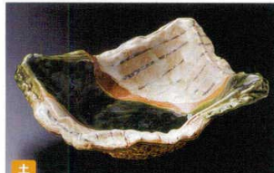
05910-179 織部細十草長角6.0向付 2,800円 40入 (17.5×14.5×6.5cm)