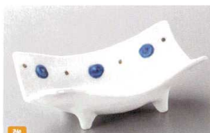
05915-559 二色水玉向付 2,050円 40入 (17.5×10.5×6cm)