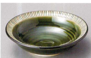
05917-579 織部測十草5.5鉢 1,800円 50入 (17.5×5cm)