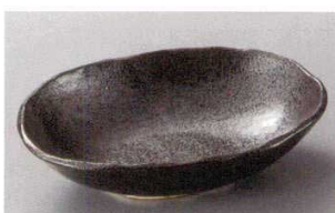
05922-269 黒油滴楕円小鉢 1,000円 60入 (17.5×12.7×3.8cm)