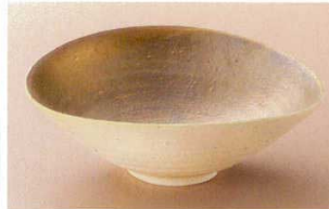
05903-669 焼バ金彩楕円向付 (信楽焼) 3,750円 60入 (17.5×16.2×6.2cm)