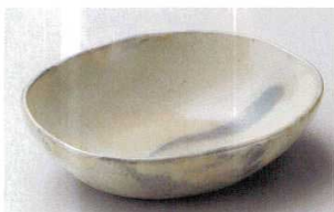
05913-669 白化粧ほかし楕円鉢 (信楽焼) 2,480円 50入 (17.5×13.5×4.5cm)