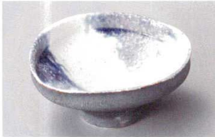
05901-179 内灰釉ナツメ型高台向付 4,100円 (17.5×14.5×8cm)