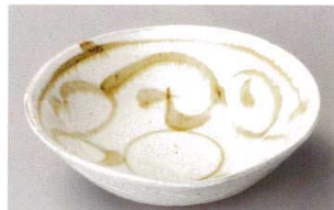
05912-449 あめ唐草貝型向付 2,650円 40入 (15.6×15.3×4.8cm)