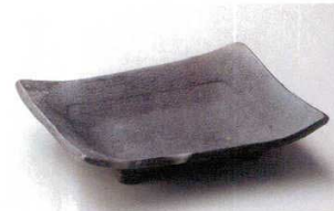
05909-669 炭化長角向付 (信楽焼) 3,600円 60入 (17.5×14×4.5cm)