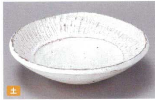
06005-519 粉引くし目55平鉢 3,200円 40入(17.5×4.7cm)