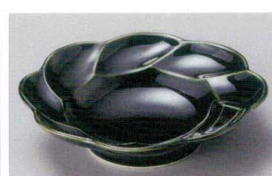
06022-319 オリベ志野花鉢 1,350円 60入(17×4cm)