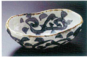
06002-299 新タコ唐草くつ型向付 3,500円 50入(17.3×11×6cm)