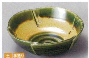
06016-109 織部切合せ向付 2,250円 40入(17×5.6cm)