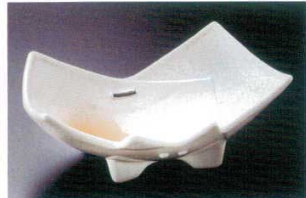
06010-259 オレンジ吹ラスター重ね鉢 2,850円 60入(17.3×11.5×6.3cm)