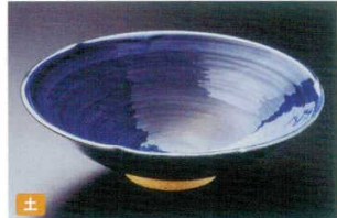
06011-179 藍染5.5刺身 2,650円 60入(17.2×5cm)