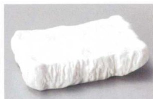
06014-319 岩石(白)角プレート 2,950円 50入(17×15.5×4cm)