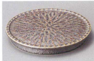
06009-149 金結晶ダリア彫皿 3,000円 40入(17.5×2cm)