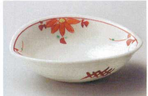
06012-589 赤絵花つなぎすげ傘向付 2,390円 60入(17.3×15×5.3cm)