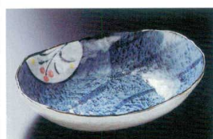
06017-519 ごす濃色絵花楕円鉢 1,900円 40入(17×11.7×3.7cm)