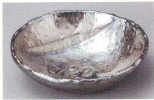
06001-669 銀袖5.5鉢(信楽焼) 3,800円 50入(17.2×4.8cm)