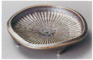
06004-149 孔雀菊彫高台皿 3,000円 50入(17.3×3.6cm)