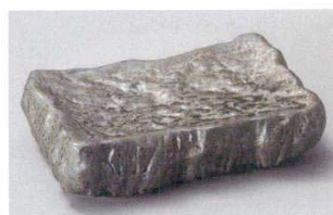
06013-319 岩石(黒)角プレート 2,950円 50入(17×15.5×4cm)