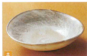
06015-309 粉引櫛目楕円向付鉢 2,420円 50入(17×15.7×5cm)