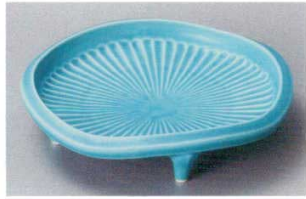
06003-139 トルコブルーマット四ツ足菊彫向付 3,550円 40入(17.5×4cm)