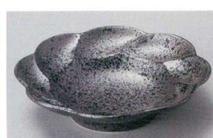
06021-459 黒吹花鉢 1,380円 80入(17.1×4.5cm)