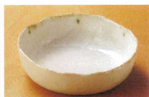
06019-559 水玉ボール(大) 1,650円 40入(17.3×5cm)