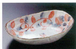
06018-519 古染華 赤楕円鉢 1,900円 40入(17×11.7×3.7cm)