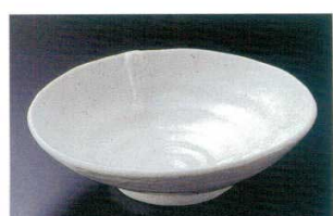
06024-319 さざ波白翔大鉢 1,050円 40入(17.3×16.2×5.9cm)