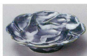
06023-319 オリベ花鉢 1,380円 60入(17×4cm)