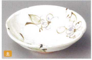
06008-299 粉引ライラック花鉢(中) 3,050円 (17.5×5.4cm)