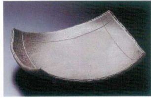
06006-179 炭化土長角向付 3,500円 60入(17.3×15.8×4cm)