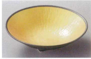
06007-149 雲母金とちり丸鉢 3,050円 40入(17.2×4.7cm)