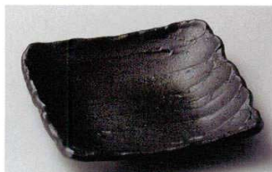
06114-579 荒ソギ黒中鉢 1,450円 40入 (17.2×17.2×4cm)