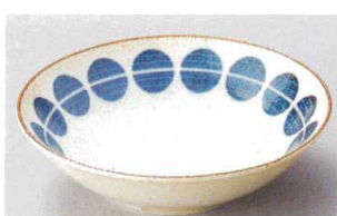
06123-199 リング17cボウル 550円 60入 (17×4.7cm)