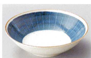
06124-199 バウム17cボウル 550円 60入 (17×4.7cm)