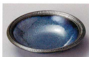
06120-109 深瀬洲十草型50并 620円 80入 (17.3×4cm)