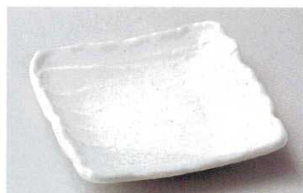
06115-579 荒ソギ白中鉢 1,450円 40入 (17.2×17.2×4cm)