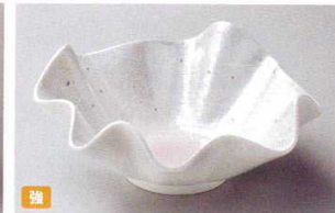
06104-259 水玉一珍ラスター紙銅向付 3,700円 30入 (17×7.5cm)