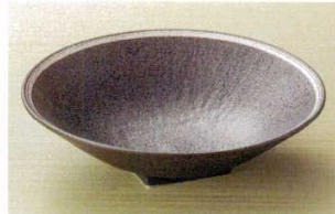
06106-149 黒結晶プラチナとちり丸鉢 2,750円 40入 (17.2×4.7cm)