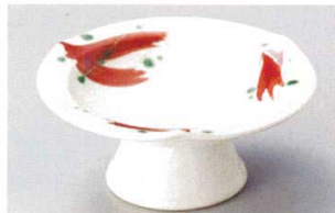
06110-479 染付赤絵刷毛目高台向付(大) 2,700円 (16.5×7cm)