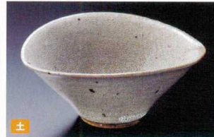
06107-519 錆かいらぎ両口鉢 2,700円 40入 (17×13.5×7cm)