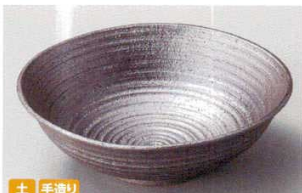
06113-109 焼しめボール 中 1,500円 40入 (17×5.5cm)