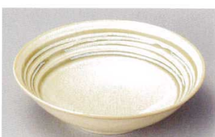
06122-199 ビードロらいん170ボウル 550円 60入 (17×5cm)