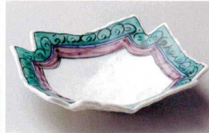
06102-149 九谷風四角鉢 3,850円 50入 (17×16×5cm)