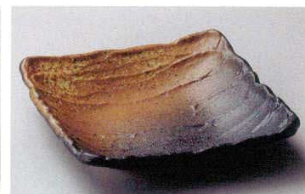
06112-299 黒備前吹き荒ソギ17cm中鉢 1,700円 40入 (17×4.4cm)