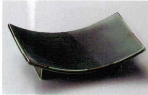
06105-149 織部両洲上り向付 3,150円 50入 (17×12×4.8cm)