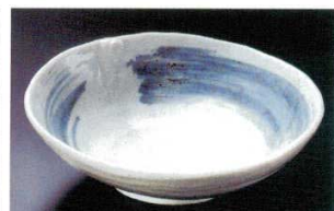
06116-319 清瀬翔煮物鉢 1,100円 60入 (17.4×16×4.8cm)