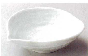
06118-459 さざ波片口煮物鉢 1,200円 60入 (17×16×5cm)