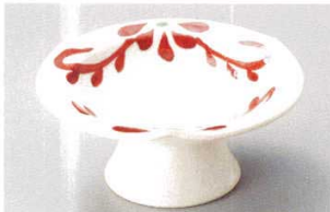
06109-479 染付赤絵葉紋高台向付(大) 2,700円 (16.5×7cm)