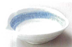
06117-319 清瀬片口煮物鉢 1,100円 50入 (17.2×15.8×5.2cm)