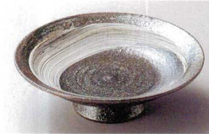
06101-669 刷毛目6.0高台皿(信楽焼) 4,200円 50入 (17×5cm)