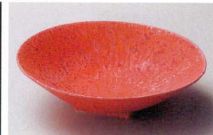
06108-149 朱釉向付 2,550円 60入 (17.2×4.8cm)