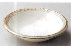
06121-109 潤錆粉引5.0并 620円 75入 (17.3×4cm)