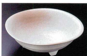
06119-459 春がすみ三つ足向付 1,000円 60入 (17×16.5×5.2cm)