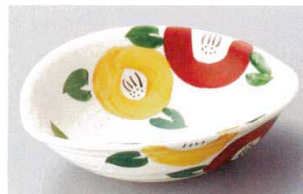
06111-579 赤絵椿楕円向付 1,900円 40入 (17.5×15.2×5.2cm)