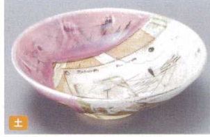
06406-519 ピンク釉刻紋50平鉢 3,400円 60入 (16.5×5.5cm)