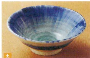
06413-559 御深井平鉢 2,000円 40入 (16.7×5.7cm)