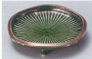
06409-149 織部金流し四つ足菊型高台皿 2,780円 (16.8×3.5cm)