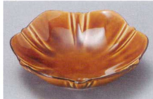
06410-149 あめ釉六つ山花形向付 2,850円 (16.5×16×4.5cm)