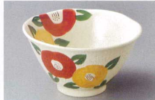
06411-579 赤絵椿 16cm反鉢 2,600円 40入 (16×8.8cm)