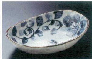
06415-519 古染華 青楕円鉢 1,900円 40入 (17×11.7×3.7cm)