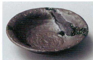
06421-409 彗星石目5.0鉢 800円 50入 (16.7×4.2cm)