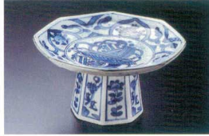
06402-259 染付ふよう高台向付 4,250円 20入 (16.5×8.5cm)