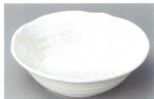
06425-279 粉引釉5.5鉢 530円 80入 (16.8×5cm)