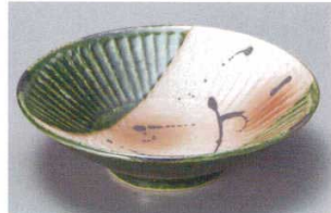
06412-149 織部黒とばし菊型5.5向付 2,550円 (16.8×4.5cm)