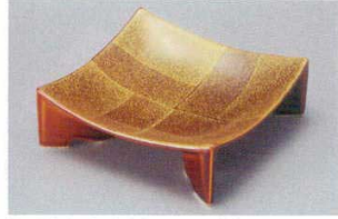
06408-149 あめ細アーチ型金タタキ四足皿 3,600円 30入 (14×14×5cm)