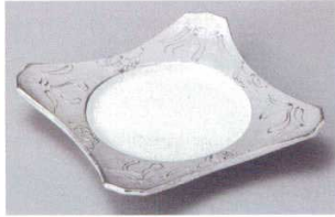
06401-149 ベルシャブラチナ正角皿 5,100円 (16.5×16.5×3cm)