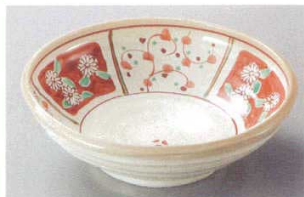
06418-279 間取赤絵浅鉢 1,250円 60入 (16.7×5cm)