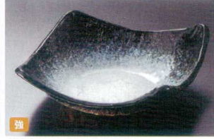
06407-559 雲海菱形7.0鉢 3,050円 40入 (16.6×16×5.2cm)