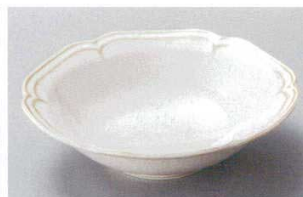
06424-109 アンジュティーク型50浅鉢 570円 80入 (16.8×4.5cm)