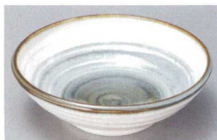
06422-319 さばトラ荒引浅鉢 900円 30入 (16.8×5.4cm)