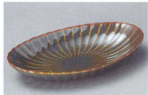
06416-029 かすみ 山藍楕円皿 中 1,400円 80入 (16.5×9.5×3.1cm) 06417-029 かすみ 山藍楕円皿 小 1,100円 100入 (13.2×7.4×3cm)