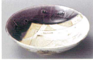
06405-519 紫釉刻紋50平鉢 3,400円 60入 (16.5×5.5cm)