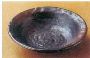
06420-029 備前風石目5.5鉢 1,000円 90入 (16.7×4.2cm)