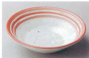
06419-279 朱音5.0鉢 1,050円 60入 (16.7×4.5cm)