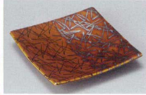
06403-299 二色松葉正角皿 4,000円 (18×2.9cm)