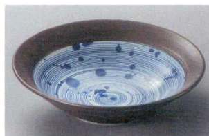
06423-579 漆染リップル5.0鉢 800円 80入 (16.7×4.5cm)