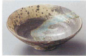
06404-669 窯変刷毛目流し向付(信楽焼) 3,750円 70入 (16.7×5.9cm)