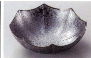
07308-149 孔雀八角鉢 2,450円 60入 (15.2×5.3cm)