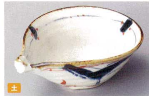
07302-139 安南赤絵染描き手付向付 3,300円 50入 (15.1×12.5×5.5cm)