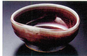
07307-269 辰砂手びねり三角向付 2,500円 40入 (15.3×15.3×6.7cm)