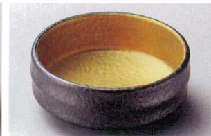
07304-459 天目内金彩向付け 3,150円 40入 (15.3×6cm)