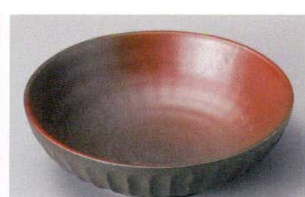
07324-139 鉄砂吹ソギ5寸浅鉢 650円 60入 (15.3×4.6cm)