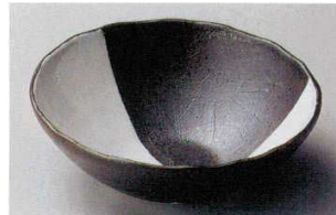
07310-559 市松向付 2,280円 40入 (15.4×5cm)