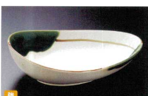
07321-559 織部流し変型小鉢 1,430円 60入 (15.4×11.3×4.4cm)