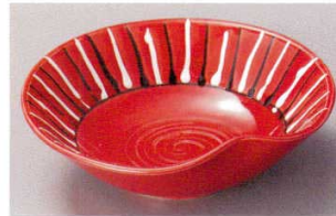
07306-449 朱赤十草15cmなぶり鉢 2,500円 60入 (15×5cm)