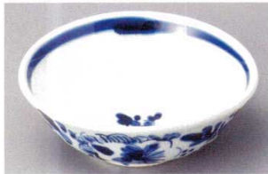
07301-149 染付草花たわみ向付 3,850円 50入 (15.1×14.5×5.3cm)