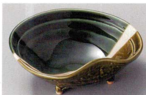
07313-579 織部塗分片押5.0鉢 2,200円 50入 (15×13.3×5.4cm)