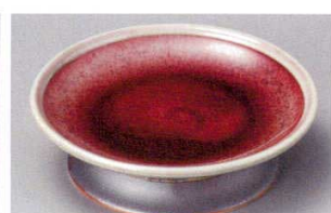
07320-269 辰砂5寸高台刺身皿 1,500円 50入 (15.3×4.5cm)