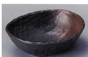
07322-209 黒備前バスケト(小) 750円 40入 (15.1×12.8×5.2cm)