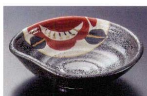
07319-579 赤絵天目 5寸平鉢 1,500円 60入 (15.3×15×4.5cm)