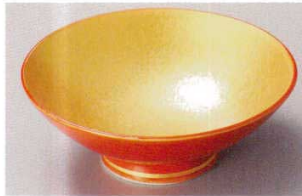
07305-459 朱金溶彩5寸向付 3,000円 40入 (15.5×5.8cm)