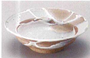
07309-669 灰化粧流し5.0丸鉢(信楽焼) 2,600円 80入 (15.3×4.6cm)