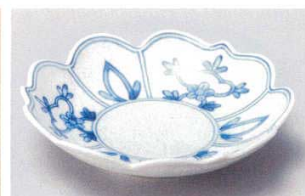
07316-149 本業桔梗間取花向付 2,100円 80入 (15.3×4.6cm)