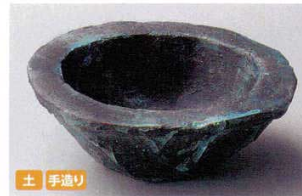
07303-139 焼ぐ削り中鉢 3,200円 24入 (15.4×14.2×5.7cm)