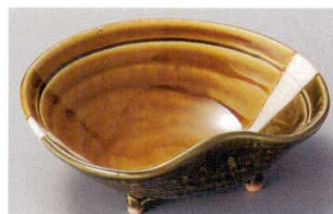
07314-579 黄瀬戸塗分片押5.0鉢 2,200円 50入 (15×13.3×5.4cm)