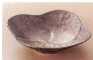
07315-199 金結晶花形5寸中鉢 2,300円 60入 (15×15×4.5cm)