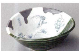
07317-149 織部高山寺たわみ鉢(小) 2,000円 60入 (15.2×13.5×5.8cm)