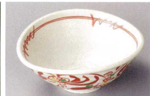
07312-149 粉引赤絵たわみ鉢(小) 2,300円 60入 (15.2×13.5×5.8cm)