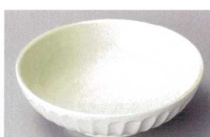
07323-139 若草ソギ5寸浅鉢 650円 60入 (15.3×4.6cm)