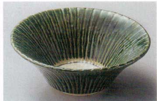
07611-149 織部4.8小鉢 2,150円 60入 (14.7×5.7cm)