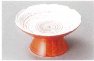
07607-479 朱巻櫛目高台向付 2,800円 (14×7cm)