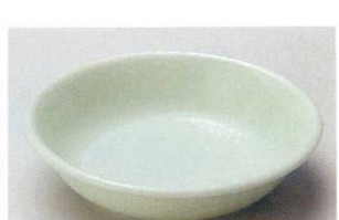
07624-319 グリンフルーツ皿 250円 90入 (14.6×3.5cm)