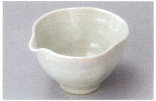
07608-589 うすみどり片口鉢 2,800円 30入 (14.5×13.5×9cm)