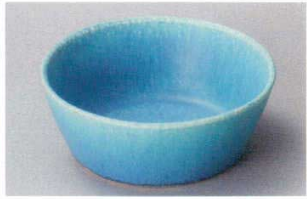
07603-669 トルコブルー4.8浅鉢(信楽焼) 3,250円 (14.5×5.4cm)