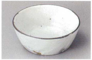
07604-669 白釉4.8浅鉢(信楽焼) 3,250円 (14.5×5.4cm)