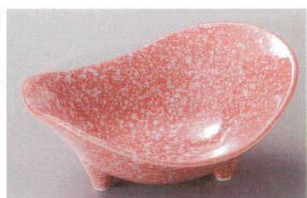
07615-139 柿釉白吹三ツ足向付 1,850円 80入 (14.6×12.1×5.8cm)