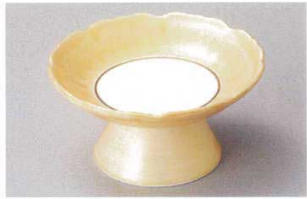
07606-479 雲母金巻高台向付 2,900円 (14×7cm)