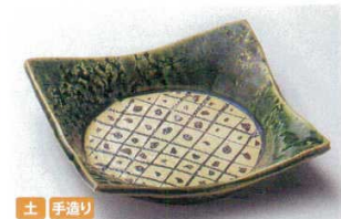
07609-149 丸紋織部正角向付 2,700円 50入 (14.5×14.5×4cm)