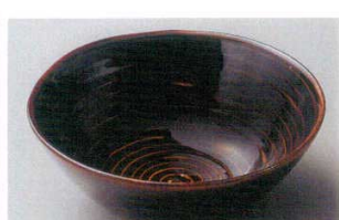
07619-319 和ライン深鉢(小) 1,450円 80入 (14.5×14.5×5cm)