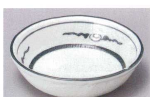
07618-589 瑞雲5.0ボール 1,490円 80入 (14.8×3.8cm)