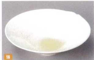
07610-199 黄磁片口4.8鉢 2,300円 110入 (14.5×4cm)