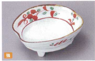
07601-559 赤絵三ツ足向付(小) 3,400円 40入 (14×12.2×6cm)