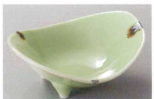
07616-139 ヒワ釉錆流し三ツ足向付 1,850円 80入 (14.5×12.1×5.8cm)