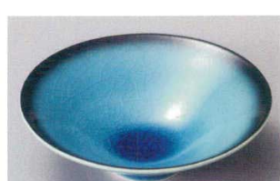
07617-469 ぎやまん浅鉢 1,600円 60入 (14.3×4.2cm)