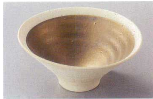
07605-669 焼酎金彩5.1そり鉢(信楽焼) 3,250円 90入 (14.5×6.2cm)