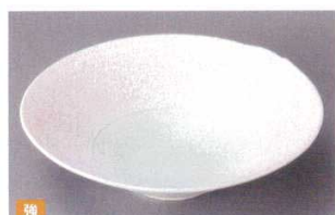
07613-259 二色吹白刷毛片口4.8平鉢 2,100円 125入 (14.6×4cm)