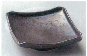
07612-109 金結晶正角向付 2,200円 50入 (14.5×14.3×4.8cm)