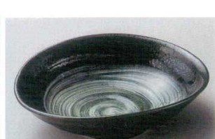
07623-239 刷毛目たわみ小鉢 800円 90入 (14.7×11.3×4cm)