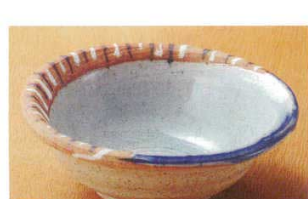
07621-559 二色十草向付 1,200円 50入 (14.3×14.2×5.3cm)