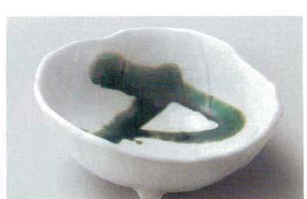
07620-179 白マット織部流し三ツ足向付 1,300円 60入 (14.5×14×5cm)