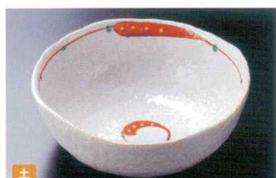
07614-519 粉引色絵丸5寸鉢 2,000円 60入 (14.5×5.5cm)