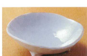
07622-199 均窯三ツ足小鉢 980円 80入 (14.5×14×4.5cm)