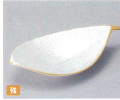
08007-589 ラスター木の葉型小鉢 2,800円 80入(16.7×9.4×3.6cm)