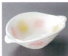
08018-139 二色吹耳付小鉢 1,100円 80入(15×10.6×4.4cm)