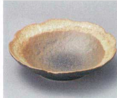
08013-589 夜明け5.0浅鉢 1,590円 60入(16×5cm)