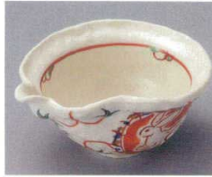
08005-299 片口ひさご唐草小鉢 3,450円 50入(15×10.5×6.8cm)