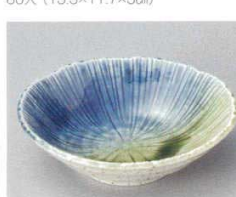
08031-149 二色流し取鉢 650円 80入(15×14.3×4cm)