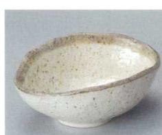
08024-179 白唐津変型小鉢 900円 60入(15×11.8×6cm)