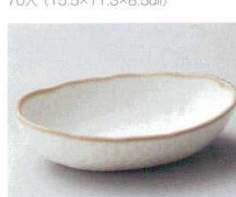
08026-459 錆ボカシ楕円小鉢 880円 100入(16×11×4cm)