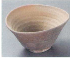
08010-669 炭化5.0楕円鉢(信楽焼) 2,400円 90入(14×12×7.5cm)