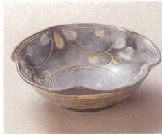
08001-669 黒刷毛目草花向付(信楽焼) 4,300円 90入(15×5cm)