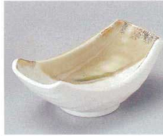
08006-189 金みやび舟形小鉢 3,600円 40入(16×8.4×6cm)