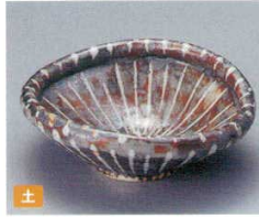
08002-149 ねずみ志野玉淵小鉢 3,650円 50入(15.5×13.5×6cm)