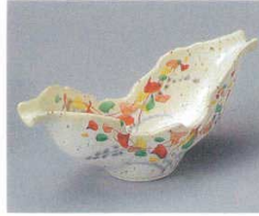
08009-189 変り舟形珍味 2,550円 80入(16×6.4×5.9cm)