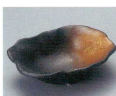
08025-579 黒備前三ツ足長小鉢 1,180円 60入(15.3×11.7×5cm)