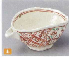
08004-149 線格子片口小鉢 3,950円 60入(16×10.5×7.2cm)