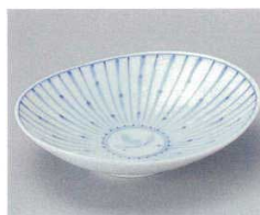
08017-739 十草蘭楕円皿(中)(有田焼) 1,400円 5入(15.5×13×2cm)