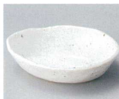
08019-579 白うのふ石目楕円鉢 1,000円 60入(15.5×12.3×4.3cm)