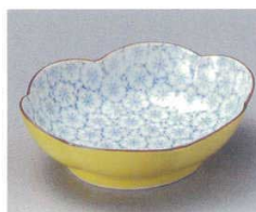
08016-739 黄ざくら 木甲小鉢(有田焼) 1,400円 5×16入(15×12×4.5cm)