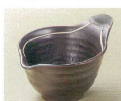
08021-579 鉄鉢ライン納豆鉢 1,000円 70入(15.5×11.3×8.5cm)