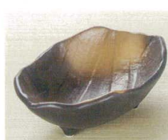
08022-309 布目黒備前変形小鉢 950円 60入(15.5×9.5×5cm)