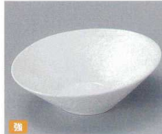
08011-439 白磁石目型5.3寸楕円鉢 2,200円 100入(15.7×12.3×4.3cm)