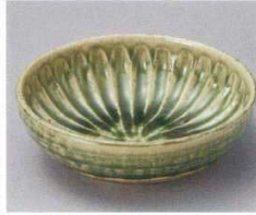
08003-519 総織部しのぎ50ボール 3,500円 40入(15×5.2cm)