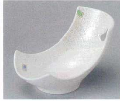
08008-149 ラスター三日月透かし小鉢 2,850円 80入(15.5×8.5×8.5cm)