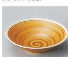
08030-579 カラメル 4.5鉢 650円 60入(14×3.9cm)