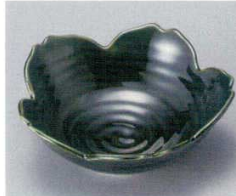
08015-319 オリベ桜鉢 1,200円 50入(14.5×5cm)