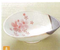
08020-279 粉引舞桜小鉢 1,000円 80入(15.5×13.3×5.3cm)