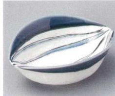
08012-579 藍釉しずく型小鉢 2,150円 80入(15.2×11.6×5.4cm)