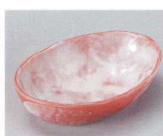
08023-039 赤彩花シリーズタ円小鉢 930円 90入(16×11×3.7cm)