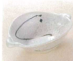
08014-139 筆遊びラスター耳付小鉢 1,500円 120入(15×10.3×4.5cm)