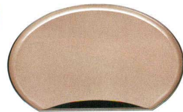
[A] 加賀半月盆 玉虫パール 81153-809 8寸 1,700円 60入 (24.2×21.7×1.1cm) 81154-809 9寸 1,900円 60入 (27.2×24.4×1.2cm) 81155-809 尺0寸 2,400円 60入 (30.2×27×1.3cm) 81156-809 尺1寸 2,700円 50入 (33.3×29.5×1.5cm) 81157-809 尺2寸 3,000円 50入 (36.3×32.3×1.7cm) 81158-809 尺3寸 3,350円 40入 (39×34.9×1.7cm)