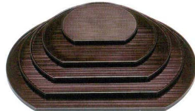
[A] 乱引半月盆 溜パール 81137-809 5寸 380円 100入 (15×13.3×0.8cm) 81138-809 7寸 600円 100入 (22.1×19.8×0.9cm) 81139-809 9寸 900円 60入 (27×23.8×0.9cm) 81140-809 尺0寸 1,150円 60入 (31.5×27.7×1.2cm) 81141-809 尺2寸 1,650円 40入 (36×31.8×1.2cm) 81142-809 尺3寸 2,150円 40入 (39×34.5×1.1cm)