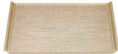
[A] 宴へぎ目盆 パールゴールド艶消NS(ノンスリップ加工) 81113-809 尺1寸 2,500円 50入 (33.5×21.5×2.2cm) 81114-809 尺2寸 2,600円 50入 (36.5×25.6×2.2cm) 81115-809 尺3寸 3,050円 40入 (39.4×27.6×2.2cm) 81116-809 尺4寸 3,400円 40入 (42.6×31×2.3cm) 81117-809 尺5寸 3,750円 30入 (45.3×31.9×2.4cm)