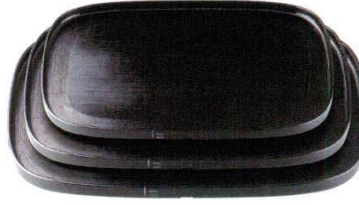
[A] 新小判盆 黒刷毛目NS(ノンスリップ加工) 81134-809 尺2寸 1,750円 50入 (36.5×27.8×2cm) 81135-809 尺3寸 2,100円 40入 (39.2×30×2cm) 81136-809 尺4寸 2,500円 40入 (43×32.8×2cm)