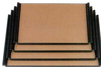
[A] 徳川盆 ページュ真パール黒艶消NS(ノンスリップ加工) 81122-809 尺2寸 3,050円 40入 (36×28.5×2cm) 81123-809 尺3寸 3,200円 40入 (39×31×2.1cm) 81124-809 尺4寸 3,650円 30入 (42×34×2.2cm) 81125-809 尺5寸 4,200円 30入 (45×35.5×2.3cm)