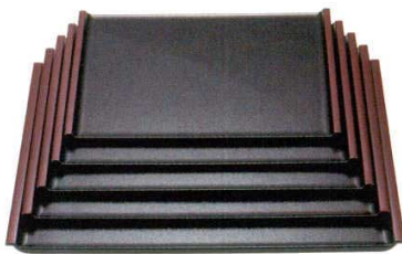
[A] 利久盆 黒石目うるみNS(ノンスリップ加工) 81101-809 尺1寸 2,400円 60入 (33.1×23.8×2cm) 81102-809 尺2寸 2,700円 50入 (36.1×26×2cm) 81103-809 尺3寸 3,000円 40入 (39.2×28.2×2cm) 81104-809 尺4寸 3,700円 40入 (42.2×30.4×2cm) 81105-809 尺5寸 4,100円 30入 (45.2×32.5×2cm) 81106-809 尺6寸 4,700円 20入 (48.3×34.7×2cm)