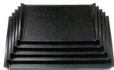
[A] ウェーブ盆 黒石目(ノンスリップ加工) 81126-809 尺2寸 2,400円 50入 (36.5×27×2.8cm) 81127-809 尺3寸 2,850円 40入 (39.5×29.2×2.8cm) 81128-809 尺4寸 3,350円 40入 (42.7×31.5×2.9cm) 81129-809 尺5寸 3,750円 30入 (45.4×33.6×2.9cm) 81130-809 尺6寸 5,000円 20入 (48.5×35.9×3cm)