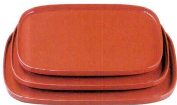
[A] 新小判盆 総朱塗 81131-809 尺2寸 1,550円 50入 (36.5×27.8×2cm) 81132-809 尺3寸 1,850円 40入 (39.2×30×2cm) 81133-809 尺4寸 2,200円 40入 (43×32.8×2cm)