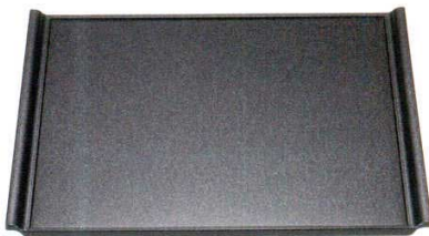
[A] 徳川盆 黒パール黒艶消NS(ノンスリップ加工) 81118-809 尺2寸 3,100円 40入 (36×28.5×2cm) 81119-809 尺3寸 3,250円 40入 (39×31×2.1cm) 81120-809 尺4寸 3,750円 30入 (42×34×2.2cm) 81121-809 尺5寸 4,300円 30入 (45×35.5×2.3cm)