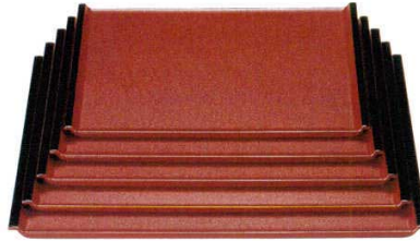
[A] 利久盆 うるみ石目黒NS(ノンスリップ加工) 81107-809 尺1寸 2,400円 60入 (33.1×23.8×2cm) 81108-809 尺2寸 2,700円 50入 (36.1×26×2cm) 81109-809 尺3寸 3,000円 40入 (39.2×28.2×2cm) 81110-809 尺4寸 3,700円 40入 (42.2×30.4×2cm) 81111-809 尺5寸 4,100円 30入 (45.2×32.5×2cm) 81112-809 尺6寸 4,700円 20入 (48.3×34.7×2cm)