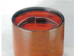
[TA]耐熱式部飯器 研出木目 (内黒) 82022-819 (小) 2,800円 (9.7×7.1cm) 82023-819 (大) 2,900円 (10.6×7.9cm)