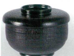
82015-819 [A]助六飯器 黒 1,300円 (12.5×8.5cm・身11.5×7.1cm)