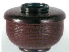
82016-819 [A]助六飯器 溜内朱 1,550円 (12.5×8.5cm・身11.5×7.1cm)