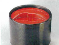
[TA]耐熱式部飯器 日の出 (内黒) 82020-819 (小) 1,900円 (9.7×7.1cm) 82021-819 (大) 2,100円 (10.6×7.9cm)