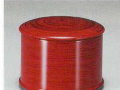
82025-819 [TA]耐熱緑高飯器 朱刷毛目 (内黒) 2,150円 (10.5×8.2cm・身10×7cm)