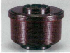
82011-819 [A]ミニ榎目割子 溜 (内朱) 1,100円 (10.7×8.1cm・身9.9×6.9cm)