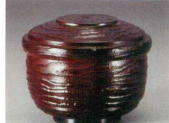
82019-819 [A]荒波飯器 新溜内朱 1,700円 (12.1×9.8cm・身11.4×7.8cm)