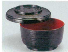
82005-819 [A]ケヤキ割子 黒塗 (内朱) 910円 (13.5×8.3cm・身12.3×6.7cm) 82006-819 [TA]耐熱ケヤキ割子 黒塗 (内朱) 1,030円 (13.5×8.3cm・身12.3×6.7cm)