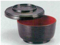
82001-819 [A]ケヤキ割子 (小) 黒塗 (内朱) 900円 (12.4×7.6cm・身11×6.2cm) 82002-819 [TA]耐熱ケヤキ割子 (小) 黒塗 (内朱) 970円 (12.4×7.6cm・身11×6.2cm)