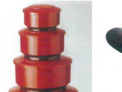
[A]飯器 (杓子付) 玉虫刷毛目 82035-819 1人用 1,850円 (14×8.4cm・身13.1×6.8cm) 82036-819 2人用 2,750円 (17.1×10.9cm・身16.2×9cm) 82037-819 3人用 4,000円 (21.7×11.8cm・身20.5×10.3cm) 82038-819 5人用 5,450円 (25.8×13.5cm・身24.7×11.8cm) 82039-819 10人用 8,500円 (30×15cm・身29×13.4cm)