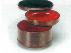
[A]ABS多用飯器 PT溜内朱 82044-819 (大) 1段 3,350円 (11.9×7.1cm・身11.1×6.3cm) 82045-819 (大) 2段 4,600円 (11.9×8.8cm・身11.1×6.3cm)