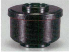
82010-819 [A]ミニ榎目割子 黒 (内朱) 1,100円 (10.7×8.1cm・身9.9×6.9cm)