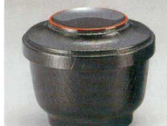
82017-819 [TA]耐熱富士型飯器 黒天朱 (内朱) 1,550円 (11.9×9.3cm・身11×7.6cm)