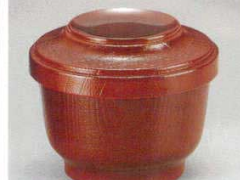
82018-819 [TA]耐熱富士型飯器 板塗 (内朱) 1,500円 (11.9×9.3cm・身11×7.6cm)