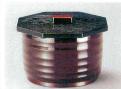
82009-819 [A]初立口クロ目飯器 (小)八角木目蓋付 溜 (内黒) 1,450円 (12×11×8cm・身10×6.8cm)