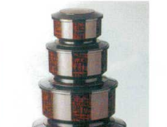
[A]飯器 (杓子付) 朱かすり 82030-819 1人用 1,750円 (14×8.4cm・身13.1×6.8cm) 82031-819 2人用 2,650円 (17.1×10.9cm・身16.2×9cm) 82032-819 3人用 4,000円 (21.7×11.8cm・身20.5×10.3cm) 82033-819 5人用 5,700円 (25.8×13.5cm・身24.7×11.8cm) 82034-819 10人用 8,000円 (30×15cm・身29×13.4cm)