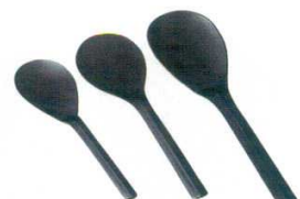
[PP]PP飯ベラ 82040-819 (小) 1~2人用 220円 (16.9×4.6cm) 82041-819 (中) 3人用 280円 (19.5×5.5cm) 82042-819 (大) 5~10人用 390円 (22.3×6cm)