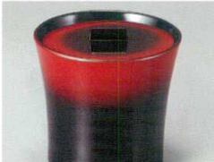
82028-819 [TA]耐熱水仙飯器 朱ぼかし 2,600円 (9.9×9.4cm)