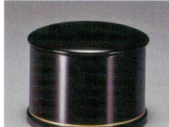
82024-819 [TA]耐熱緑高飯器 黒金ライン (内黒) 1,800円 (10.5×8.2cm・身10×7cm)