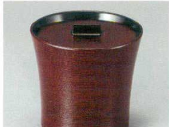
82029-819 [TA]耐熱水仙飯器 溜刷毛目 2,800円 (9.9×9.4cm)