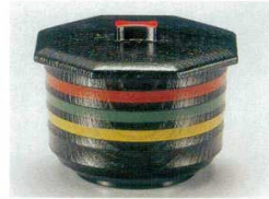
82014-819 [A]元禄木目飯器 三色ライン (内朱) 1,550円 (11.4×10.5×7.8cm・身9.7×7cm)