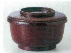
82007-819 [A]ケヤキ割子 ウルミ (内黒) 830円 (13.5×8.3cm・身12.3×6.7cm) 82008-819 [TA]耐熱ケヤキ割子 ウルミ (内黒) 990円 (13.5×8.3cm・身12.3×6.7cm)