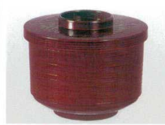
82013-819 [A]榎目割子 溜 (内朱) 1,050円 (11.5×9cm・身10.7×8cm)