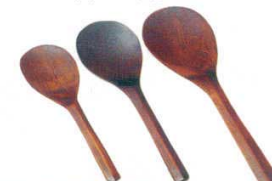
[木]木製摺り漆飯ベラ 82046-819 (小) 1~2人用 770円 (16.9×4.9cm) 82047-819 (中) 3~5人用 830円 (19.2×5.3cm) 82048-819 5~10人用 940円 (21.9×5.8cm)