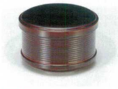
82043-819 [A]ABS多用飯器 (小)溜内朱 1,950円 (10.7×7cm・身10×6.2cm)