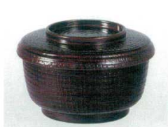
82003-819 [A]ケヤキ割子 (小) 溜塗 (内朱) 940円 (12.4×7.6cm・身11×6.2cm) 82004-819 [TA]耐熱ケヤキ割子 (小) 溜塗 (内朱) 1,020円 (12.4×7.6cm・身11×6.2cm)