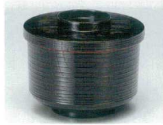
82012-819 [A]榎目割子 黒 (内朱) 1,050円 (11.5×9cm・身10.7×8cm)