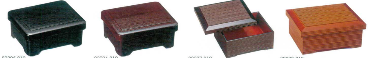
82205-819 [TA] 耐熱木目井重 黒内朱 1,950円 (16.8×14.3×7.2cm・身14.8×12.3×4.7cm) 82206-819 [TA] 耐熱木目井重 溜内朱 2,050円 (16.8×14.3×7.2cm・身14.8×12.3×4.7cm) 82207-819 [A] 源氏井重 溜千筋(内朱) 2,400円 (17.3×14.3×8cm・身15×12×4.4cm) 82208-819 [A] 源氏井重 春慶千筋(内朱) 2,800円 (17.3×14.3×8cm・身15×12×4.4cm)