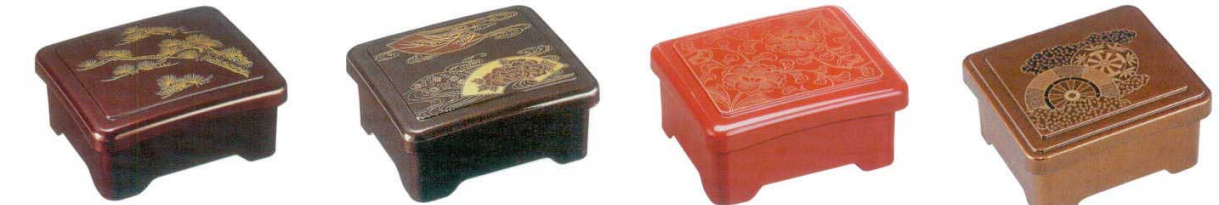
82201-819 [A] 光月井重 溜パール松内朱 1,800円 (16.7×14.3×8cm・身14.3×11.9×4.6cm) 82202-819 [A] 光月井重 扇面菊水内朱 2,050円 (16.7×14.3×8cm・身14.3×11.9×4.6cm) 82203-819 [A] 新光月井重 柿朱金牡丹内朱 2,200円 (16.7×14.3×8cm・身14.3×11.9×4.6cm) 82204-819 [A] ミニ井重 梨地御所車内朱塗 1,650円 (14×12.1×7.3cm)