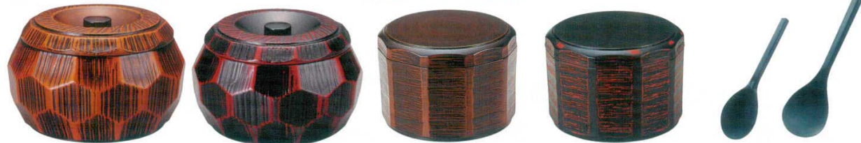
82209-819 [A] はつり亀甲井 板塗(内黒) 4,050円 (15×9.5cm) 82210-819 [A] はつり亀甲井 曜(内黒) 4,150円 (15×9.5cm) 82211-819 [TA] 木彫多用井(中) 板(内黒) 3,050円 (14×9.8cm・身13.1×6.3cm) 82212-819 [TA] 木彫多用井(大) 板(内黒) 3,850円 (17.5×9.8cm・身16.2×6cm) 82213-819 [TA] 木彫多用井(中) 曜(内黒) 3,900円 (14×9.8cm・身13.1×6.3cm) 82214-819 [TA] 木彫多用井(大) 曜(内黒) 5,200円 (17.5×9.8cm・身16.2×6cm) [PP] PP飯ペラ 82215-819 (小) 1~2人用 220円 (16.9×4.6cm) 82216-819 (中) 3人用 280円 (19.5×5.5cm)