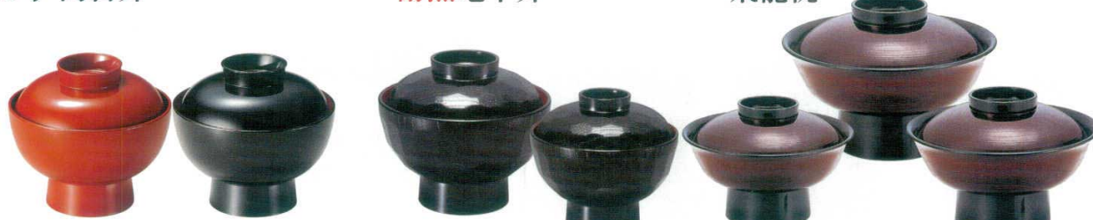
82224-819 [A] 5寸高台井 朱内黒 2,200円 (15.3×13.8cm・身9.9cm・840cc) 82225-819 [A] 5寸高台井 黒内朱 2,200円 (15.3×13.8cm・身9.9cm・840cc) 82226-819 [TA] 耐熱亀甲井(大) 黒内朱 1,550円 (15.6×13.4cm・身9.8cm・870cc) 82227-819 [TA] 耐熱亀甲井(中) 黒内朱 1,500円 (13.2×11.7cm・身8.4cm・550cc) 82228-819 [A] 5.5寸飛龍椀 溜絞り刷毛目 2,950円 (16.2×11.5cm・身8.4cm・590cc) 82229-819 [A] 6寸飛龍椀 溜絞り刷毛目 3,300円 (18×12.8cm・身9.5cm・800cc) 82230-819 [A] 6.5寸飛龍椀 溜絞り刷毛目 3,600円 (19.5×13.2cm・身10cm・1,000cc)