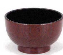
82327-809 [A] 5寸桐木目井 トチ内黒 1,000円 100人 (φ14.5×8.5cm・870cc)