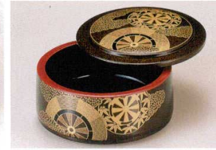
82308-809 [A] D.X富士型ちらし桶 梨地御所車 1,700円 60人 (φ16×8.5cm・内寸14φ×5cm)