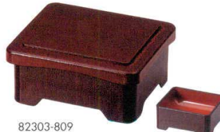
82303-809 [A] 若丸井重 溜刷毛目内朱 2,750円 60人 (16.6×14.2×7.5cm・内寸14.3×11.8×4.6cm)