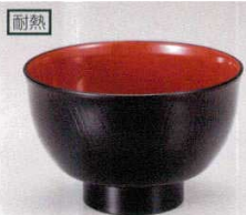
82325-809 [TA] ニュー羽反木目井 黒内朱 900円 80人 (φ13.3×8.7cm・870cc)