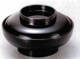
82321-809 [A] 5.5寸大平椀 黒内朱天黒 1,300円 60人 (φ16.6φ×9.5cm・430cc) 82322-809 [A] 6寸大平煮物椀 黒内朱天黒 1,350円 60人 (φ18.1φ×9.5cm・580cc)