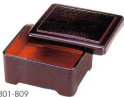
82301-809 [TA] 耐熱井重 新木目溜内朱塗 1,850円 60人 (16.8×14.3×7.8cm・内寸14.3×11.8×4.6cm)