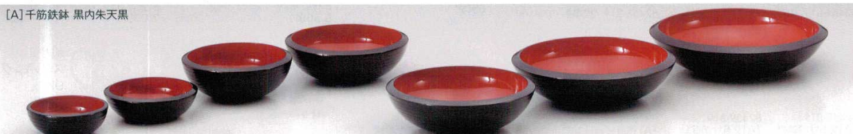
[A] 千筋鉄鉢 黒内朱天黒 82330-809 4寸 700円 200人 (φ11.4×4cm・260cc) [TA] 耐熱ABS樹脂 洗浄機対応 82331-809 4.5寸 800円 160人 (φ13.3×4.2cm・350cc) [A] ABS樹脂 耐熱温度60℃程 82332-809 5寸 1,200円 100人 (φ16×6.4cm・730cc) 82333-809 6寸 1,400円 80人 (φ18.4×6.5cm・980cc) 82334-809 7寸 1,800円 60人 (φ21×6.5cm・1,190cc) 82335-809 8寸 2,100円 40人 (φ23.6×6.5cm・1,650cc) 82336-809 9寸 2,500円 30人 (φ26.8×6.8cm・2,170cc)