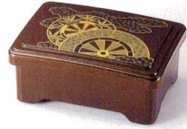
82306-809 [A] 天重 梨地御所車内朱塗 2,600円 50人 (18.7×13.7×8.5cm・内寸16.6×11.5×4.3cm)