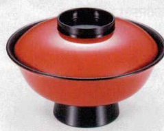
82313-809 [A] 8寸大名型井椀 朱つば黒 4,150円 30人 (φ23×14.8cm・1,700cc) ※段無