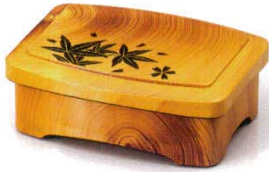
82305-809 [A] 朝倉井重 花梨春秋内朱塗 3,950円 60人 (19.1×14.9×7.3cm・内寸16.8×12.6×4.5cm)