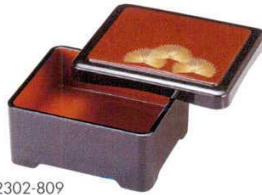
82302-809 [A] 象足井重 朱パール若松内朱塗 1,950円 60人 (16.8×14.3×7.6cm・内寸14.3×11.9×4.5cm)