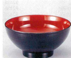
82328-809 [A] 6寸乱筋木目井 黒内朱 900円 100人 (φ17.8×8.7cm・1,060cc)