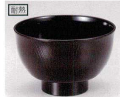
82326-809 [TA] ニュー羽反木目井 溜内黒 1,100円 80人 (φ13.3×8.7cm・870cc)