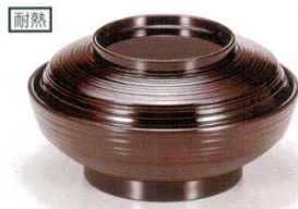
82323-809 [TA] 5.5寸線筋平煮物椀 溜内黒 2,550円 50人 (φ16.5×9.6cm・500cc) ※洗 82324-809 [TA] 6寸線筋平煮物椀 溜内黒 2,900円 50人 (φ18×9.6cm・620cc) ※洗