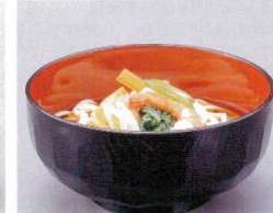
82329-809 [A] 6寸亀甲鉢 黒内朱 1,050円 60人 (φ18.5×8.4cm・1,470cc)