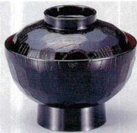
[A] 亀甲井黒内朱 82317-809 (中) 1,400円 80人 (φ13.3×11.7cm・380cc) 82318-809 (大) 1,400円 50人 (φ15.6×13.8cm・580cc)