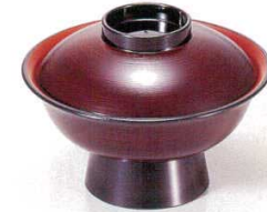
82315-809 [A] 6寸大名椀 溜刷毛目内朱 2,900円 60人 (18×12.4cm・600cc) 82316-809 [A] 7寸大名型井椀 溜刷毛目内朱 3,200円 50人 (19.6×13cm・1,010cc) ※段無