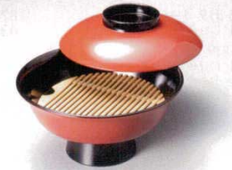
82314-809 [AP] 18.5φ目皿 (8寸用) 780円 200人 (φ18.5×0.6cm)