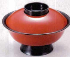
[A] 低型大名椀 朱つば黒 82309-809 5寸 2,350円 80人 (φ15×9.8cm・420cc) ※段無 82310-809 5.5寸 2,600円 60人 (φ16.3×10.9cm・600cc) ※段無 82311-809 6寸 2,800円 60人 (φ18×11.3cm・830cc) ※段無 82312-809 7寸 3,250円 60人 (φ19.6×13cm・1,010cc) ※段無