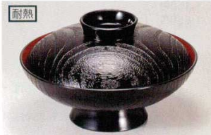
82319-809 [TA] 5.5寸小楡木目椀 黒内朱 2,200円 60人 (φ16.7×10.1cm・500cc) ※洗 82320-809 [TA] 6寸小楡煮物椀 黒木目内朱 2,400円 60人 (φ18×10.5cm・750cc) ※洗