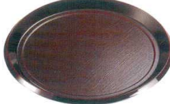
[A]8寸丸布目そば皿 溜 82418-819 本体 950円 (23.2×3cm)