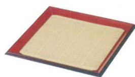
[A]7寸角布目そば皿 朱黒 82410-819 本体 850円 (21×21×3cm)