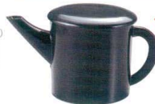
[A]丸湯筒(小) 黒 82439-819 1,600円 (9×9.5cm・300cc)