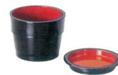
[A]瀧太千代口 黒内朱 82453-819 850円 (8×6.2cm)