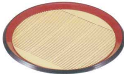
[A]8寸丸布目そば皿 朱黒 82414-819 本体 850円 (23.2×3cm)