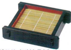
[A]ツノセイロ(中) 黒内朱 82404-819 本体(底板無) 3,500円 (21.5×19.7×5cm)