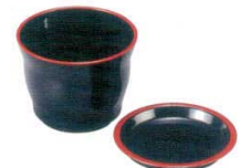
[A]まゆ型千代口 黒天朱 82455-819 550円 (8.1×6.2cm)