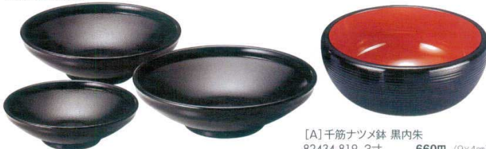
[A]ふる里鉢 黒ゆず天目 82431-819 6.5寸 1,950円 (19.5×5.8cm)