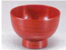
[A]河和田権 うず根来内朱 82425-819 4.3寸 1,850円 (13×9cm・570cc)