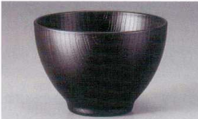
[TA]耐熱ウッディーボール 総黒 82427-819 8.8cm 550円 (8.8×5cm)