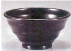
[TA]耐熱段付鉢 黒石目 82422-819 13cm 1,000円 (12.6×6.4cm・360cc)