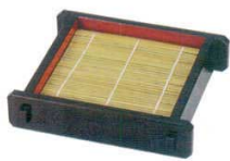
[A]ツノセイロ(小) 黒内朱 82401-819 本体(底板無) 3,350円 (18.8×17×5.1cm)