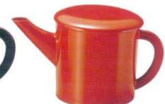
[A]丸湯筒(小) 朱 82441-819 1,600円 (9×9.5cm・300cc)