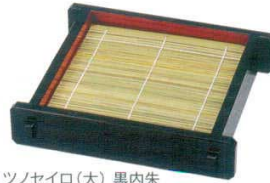
[A]ツノセイロ(大) 黒内朱 82407-819 本体(底板無) 3,900円 (22.6×21×5cm)