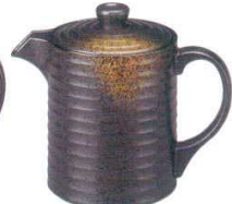
[TA]樹脂製やすらぎ汁次 82448-819 (ミニ) 焼き締め 3,800円 (14×8.2×11.7cm・250cc)