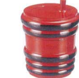
82457-819 [A]樽七味入 朱黒ひも 650円 (6×6.5cm)