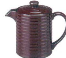
[TA]樹脂製やすらぎ汁次 82443-819 (ミニ) 新溜 2,900円 (14×8.2×11.7cm・250cc)