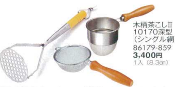
木柄茶こしII 10170深型 (シングル網) 86179-859 3,400円 1入 (8.3cm)