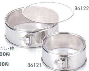
18-8取替網式蒸ごし・枠