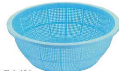
PPデラックス丸ザル