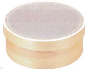
木枠ステン張蒸ごし