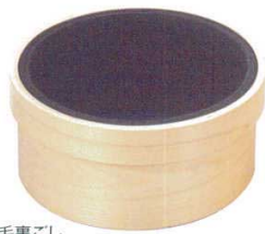
木枠代用毛蒸ごし