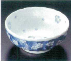
09219-739 濃桜散し小鉢 600円 5×24入 (12.4×5cm)