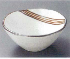
09210-339 志野流線丸盛鉢 小 1,200円 80入 (12.4×12.4×6.5cm)