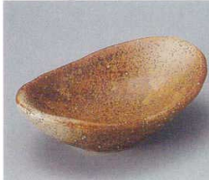
09223-309 備前吹舟形小鉢 630円 100入 (12.5×8.2×3.8cm)