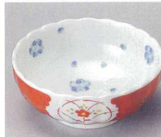
09216-739 錦赤濃丸紋万歴小鉢 950円 5×24入 (12.4×5cm)