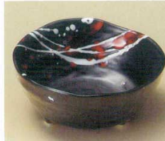
09222-239 潮ろくべい取鉢 800円 100入 (12.5×5.5cm)