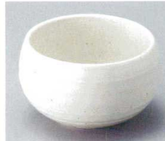
09221-459 粉引丸ボウル 880円 60入 (10×7cm)