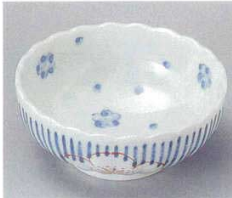
09218-739 錦十草梅小鉢 950円 5×24入 (12.4×5cm)