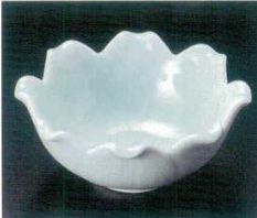
09214-739 青白磁百合型小鉢(有田焼) 1,500円 5×16入 (12.5×5cm)