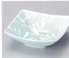
09211-739 はふり小鉢 松(青)(波佐見焼) 1,600円 5入 (12×12×4cm)