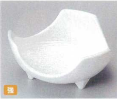
09204-439 白磁流水型小鉢 2,200円 90入 (12.5×5.8cm)