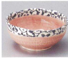
09206-469 唐草ピンク丸取鉢 2,000円 40入 (13.2×12×6cm)