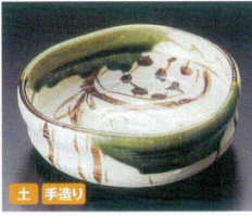
09208-519 織部三角小鉢(手造り) 1,650円 80入 (12.5×4cm)