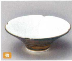
09202-439 黒巻き金渦朝顔小鉢 3,630円 80入 (12.5×4.6cm)