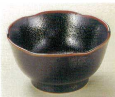
09230-279 ゆず柑天目4.0小鉢 750円 60入 (12.5×6.6cm)