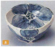
09207-339 ひし葉(SS)ポール 1,800円 60入 (12.5×6cm)