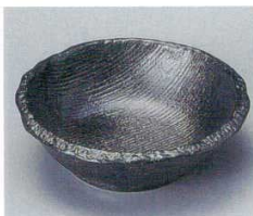
09229-459 刻窠小鉢 780円 80入 (12.5×4cm)