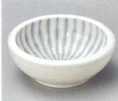
09224-319 ひより白括り手4.0深鉢 600円 80入 (12.5×4.7cm)