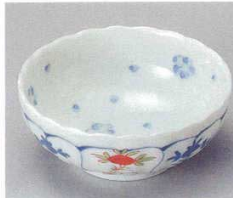
09217-739 錦花方割立花小鉢 950円 5×24入 (12.4×5cm)