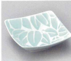
09212-739 はふり小鉢(竹・青)(波佐見焼) 1,600円 5入 (12.5×12.5×4cm)