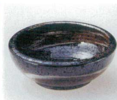
09228-189 白刷毛4.0小鉢 530円 60入 (12.5×4.5cm)