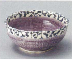
09205-469 唐草紫丸取鉢 2,000円 40入 (13.2×12×6cm)