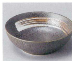
09226-459 白刷毛天目3.9ボウル 550円 100入 (12×4cm)