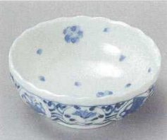
09220-739 染間取花小鉢 600円 5×24入 (12.4×5cm)