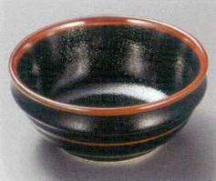
09225-279 ゆず柑天目4.0深鉢 580円 60入 (12.5×5.5cm)