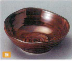
09209-559 ア×箱小鉢(大) 1,170円 80入 (12.4×12.2×4.5cm)