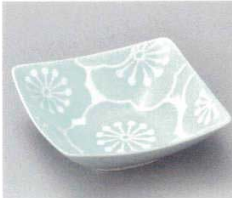
09213-739 はふり小鉢(梅・青)(波佐見焼) 1,600円 5入 (12.5×12.5×4cm)