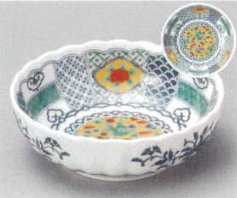
09215-109 九谷花鳥4.0小鉢 850円 80入 (12.4×4.2cm)