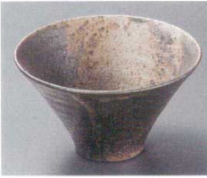
09203-669 窯変そり小鉢(信楽焼) 3,000円 100入 (12.4×7cm)