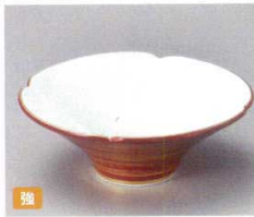
09201-439 赤巻き金渦朝顔小鉢 3,630円 80入 (12.5×4.6cm)