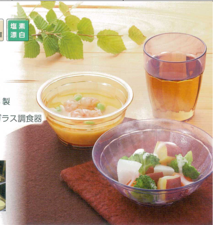
使用食器 | U-5 B サラダボール、U-3 AN 小鉢、U-1 B コップ