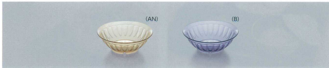
U-5 サラダボール 128 × 44 ・ 290ml ¥1,340 C-206 ¥410 → P.289