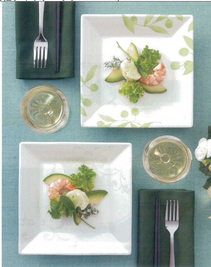
●使用製品 / 20cm角平皿 (E1120L / E112AQ) ・デザートフォーク ST (H342SLV) ・21cmPBT蓋 (H71MBK)

中世のフランス発祥、郊外や田舎に多い、料理に主軸をおいた宿のこと。土地の食材を活かした料理が魅力で、“癒し”が求められる近年の日本でも人気を誇っています。