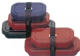
★B-610 システムレンジ弁当三段用バンド 610 ¥600 ★B-490 システムレンジ弁当二段用バンド 490 ¥540 ※バンドは受注生産です。