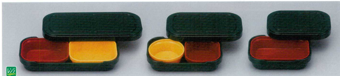
NR-8G システムレンジ弁当(身・蓋)(L)(グリーン) 260×119×52 ¥4,400 中子セット例(左から) TPM-2R/TPM-2Y 合計価格 ¥6,300(弁当箱(身・蓋)・中子)