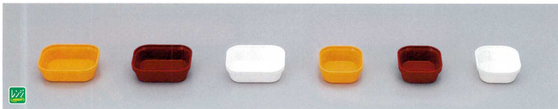
TPM-2Y PP中子(大)(イエロー) 120×101×35 270cc ¥950 TPM-2R PP中子(大)(レッド) 120×101×35 270cc ¥950 TPM-2 PP中子(大)(ホワイト) 120×101×35 270cc ¥850 TPM-1.5Y PP中子(中)(イエロー) 90×101×35 200cc ¥660 TPM-1.5R PP中子(中)(レッド) 90×101×35 200cc ¥660 TPM-1.5 PP中子(中)(ホワイト) 90×101×35 200cc ¥620