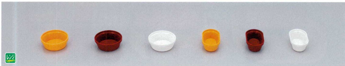
TPM-RY PP中子(丸)(イエロー) 90×35 160cc ¥620 TPM-RR PP中子(丸)(レッド) 90×35 160cc ¥620 TPM-R PP中子(丸)(ホワイト) 90×35 160cc ¥600 TPM-1Y PP中子(小)(イエロー) 60×102×35 120cc ¥560 TPM-1R PP中子(小)(レッド) 60×102×35 120cc ¥560 TPM-1 PP中子(小)(ホワイト) 60×102×35 120cc ¥530

システムレンジ弁当対応/システム食器・システム食器ニュークリックの中子組み合わせ例です。