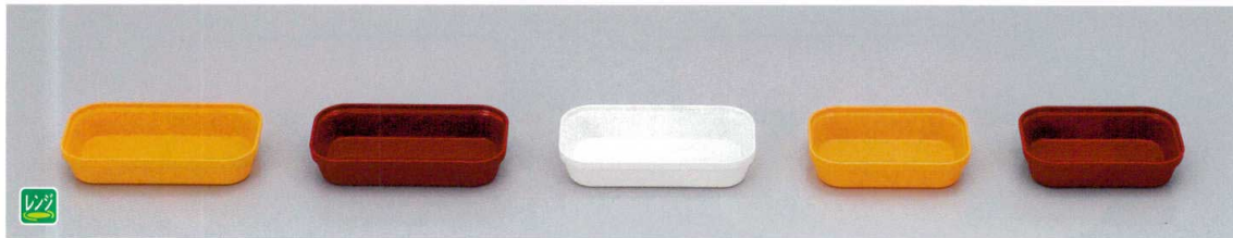
TPM-3Y PP中子(特大)(イエロー) 180×101×35 440cc ¥1,150 TPM-3R PP中子(特大)(レッド) 180×101×35 440cc ¥1,150 TPM-3 PP中子(特大)(ホワイト) 180×101×35 440cc ¥1,050 TPM-2.5Y PP中子(大々)(イエロー) 148×101×35 320cc ¥1,030 TPM-2.5R PP中子(大々)(レッド) 148×101×35 320cc ¥1,030