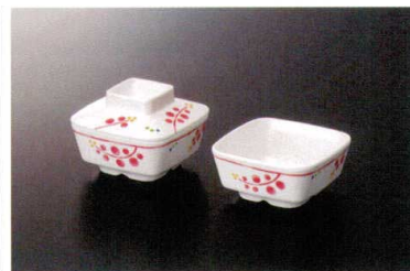
W-105RU 角小鉢(身) 123 86×86×40 62 160cc ¥740 W-106RU 角小鉢(蓋) 86×86×28 ¥670