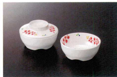
G-462RU 丸小鉢(身) 123 100×40 60 190cc ¥830 G-462FRU 丸小鉢(蓋) 100×24 ¥640 共用蓋B