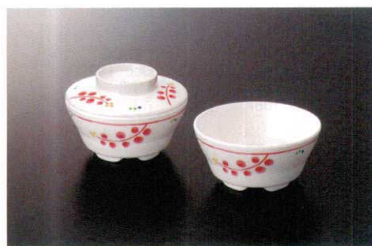
G-463RU 丸小鉢(身) 123 100×48 68 200cc ¥850 G-462FRU 丸小鉢(蓋) 100×24 ¥640 共用蓋B