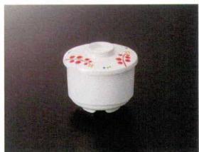
G-461I むし茶碗(身)(アイボリー) 123 76×60 73 180cc ¥650 C-61FRU むし茶碗(蓋) 84×18 ¥440