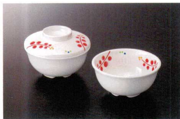
G-467RU 丸小鉢(身) 123 110×50 76 280cc ¥860 G-467FRU 丸小鉢(蓋) 110×31 ¥720 共用蓋A