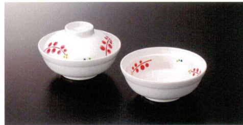
G-767RU 煮物碗(身) 123 130×50 80 350cc ¥1,070 G-768RU 煮物碗(蓋) 119×40 ¥800