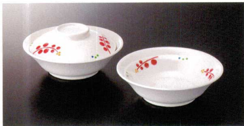
Y-171RU 煮物碗(身) 123 160×48 72 450cc ¥1,290 Y-172RU 煮物碗(蓋) 139×34 ¥830