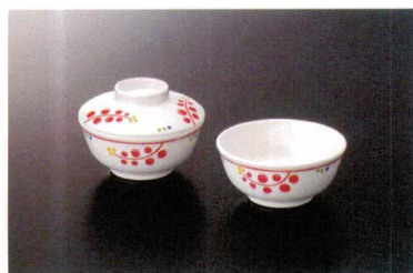
W-107RU 丸小鉢(身) 123 92×42 65 160cc ¥720 Y-141FRU 丸小鉢(蓋) 92×28 ¥630