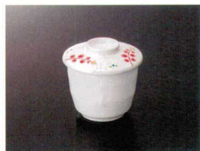
G-1461 むし茶碗(身)(アイボリー) 123 81×72 87 220cc ¥480 G-146FRU むし茶碗(蓋) 90×20 ¥360