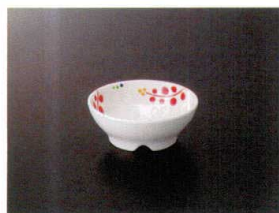
G-438RU のぞき 88×35 ¥600