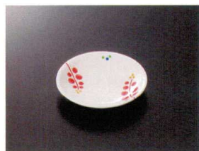
G-453RU 小皿 100×18 ¥470