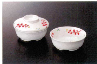
G-464RU 丸小鉢(身) 123 110×40 64 220cc ¥870 G-464FRU 丸小鉢(蓋) 110×31 ¥720 共用蓋A