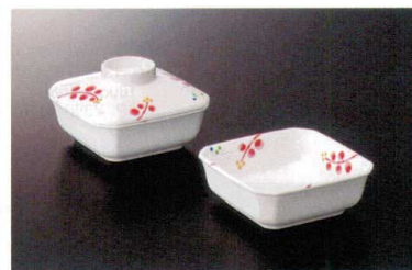
Y-151RU 角小鉢(身) 123 110×110×40 70 250cc ¥950 Y-151FRU 角小鉢(蓋) 110×110×36 ¥760