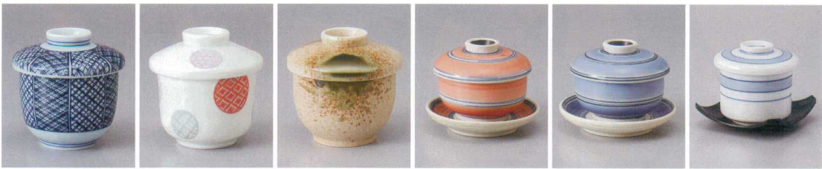
202-13-2H 1,250円 青白磁祥瑞むし碗 7.5×8.7cm 202-14-71H 1,200円 源氏丸紋蒸し碗 7.4×8.3cm 170cc 202-15-77H 1,650円 伊賀織部蒸し碗(小) 7.5×8.2cm 200cc 202-16-71H 1,300円 太駒筋ピンクミニ蒸し碗 7×6.2cm 120cc 202-17-71H 400円 太駒筋ピンク受皿 9×2cm 202-18-71H 1,300円 太駒筋青ミニミニ蒸し碗 7×6.2cm 120cc 202-19-71H 400円 太駒筋青受皿 9×2cm 202-20-77H 800円 紺ラインむし碗(小) 7×8cm 202-21-27H 720円 黒隅切茶碗蒸し台 9.5×9.5×2.2cm