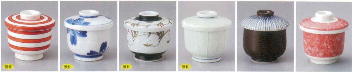
強化 202-1-78H 2,080円 赤絵筋マツ糸蒸し碗 6.5×7.2cm 120cc 強化 202-2-71H 1,510円 一珍青花蒸し碗 7.5×7.5cm 強化 202-3-78H 1,660円 梨地唐草蒸し碗 6.3×8.3cm 130cc 強化 202-4-79H 1,500円 ヒツ磁一珍十草むし碗 6.5×7.2cm 120cc 202-5-71H 1,250円 南蛮青十草小蒸し碗 7×8cm 150cc 202-6-25H 850円 翔鳳(赤蒸し碗(小)) 7.5×8cm