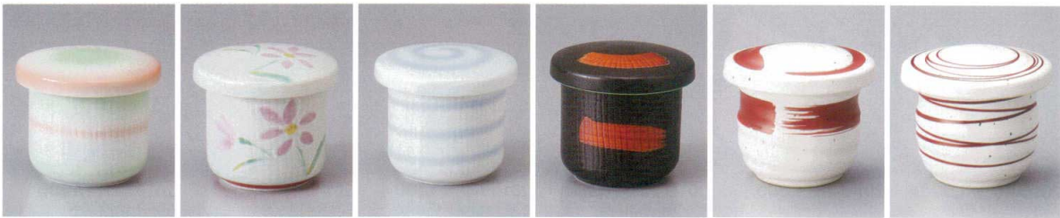
202-7-32H 980円 白磁二色吹小むし 6.3×6.5cm 120cc 202-8-32H 890円 白磁かおり小むし 6.3×6.5cm 120cc 202-9-32-48H 820円 白磁布目湯小むし 6.3×6.5cm 120cc 202-10-32H 840円 黒赤ハケミミニむし碗 6.3×6.5cm 120cc 202-11-34H 1,200円 手描き赤絵ハケミ豆むし碗 6.5×6.8cm 100cc 202-12-34H 1,200円 手描き赤絵ラセン豆むし碗 6.5×6.8cm 100cc