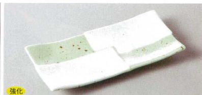
220-9-79H 1,520円 現代市松突出皿 21×9.8×2.3cm