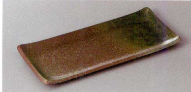
220-1-71H 1,600円 南蛮オリベ鮎皿 25.2×10.6cm