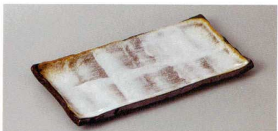
220-15-77H 1,470円 備前志野長角突出皿 20.5×10.2×1.6cm