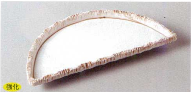
220-10-71H 1,450円 茶淵巻半月突出皿 20.5×9.6×2cm