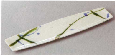
220-5-71H 1,500円 乱舞突出皿 29×6.7×1.4cm