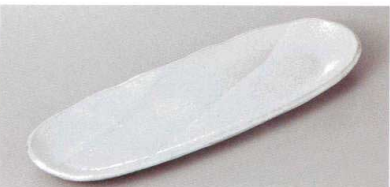
220-17-77H 1,470円 白軸重ね9寸精円細皿 27×9.2×2.3cm