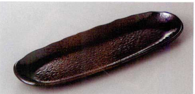
220-16-77H 1,470円 備前灰袖9寸精円細皿 27×9.2×2.3cm