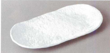
220-4-33H 1,730円 白磁白小雪付出し 24×11×2.4cm