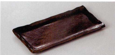
220-14-77H 1,470円 備前灰袖突き出し7寸長角皿 20.5×10.5×1.5cm