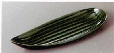
220-12-34H 1,480円 織部笹型長皿 27×9.5×4.2cm