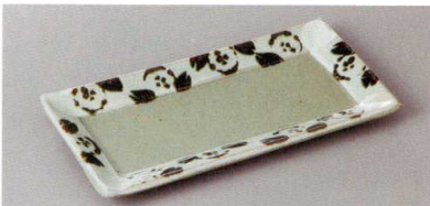
220-11-78H 1,700円 唐津樽突出皿 21.3×10.3×1.8cm