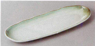
220-7-71H 1,550円 深草精円突出皿 27×9.3×2cm