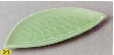
220-19-77H 1,450円 ヒワ花紋付出皿 22×9×1.5cm