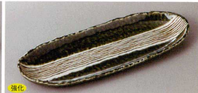
220-3-71H 1,600円 織部錆帯9.0舟形皿 27.2×10.5×2.3cm