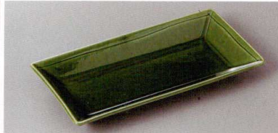
220-2-43H 1,600円 織部長角皿(小) 23.2×11.2×2.8cm