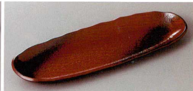
220-6-71H 1,560円 東山9.0小判突出皿 26.7×9×2cm