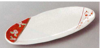
220-20-25H 1,450円 間取赤絵精円たたら皿 26.7×11.3×2.4cm