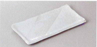
220-13-77H 1,470円 白軸重ね突き出し7寸長角皿 20.5×10.5×1.5cm