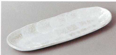
220-8-71H 1,550円 うのふ精円突出皿 27×9.3×2cm