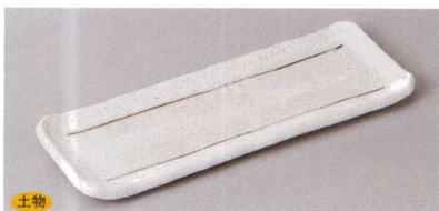
223-10-73H 1,060円 ネズミ志野付出皿 24×8×1.5cm