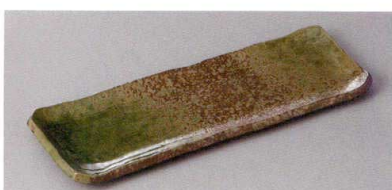
223-15-71H 1,050円 南蛮オリベ細突出皿 23.8×8cm