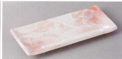
223-6-60H 1,120円 桜志野長角皿 22.5×9.5×2.5cm