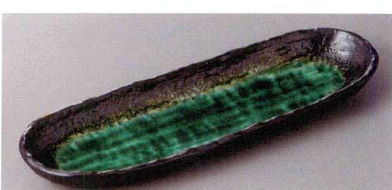
223-21-31H 1,100円 深海レー 30×9.7×3cm