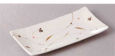
223-20-71H 1,000円 銷唐草突出皿 22.5×10.2×2.6cm