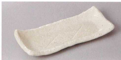
223-2-24H 1,500円 民楽22cm長皿白伊賀 22.3×9×2cm