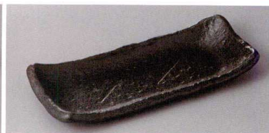
223-3-24H 1,500円 民楽22cm長皿黒織部 22.3×9×2cm