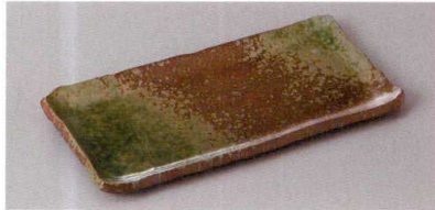
223-4-71H 1,200円 南蛮オリベ突出皿 20.5×10cm