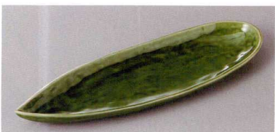
223-13-43H 1,050円 織部リーフ小判皿(小) 25.7×8.2×2.2cm