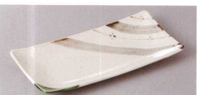
223-19-71H 1,000円 織部梅紋ストライプ突出皿 22.5×10.2×2.6cm