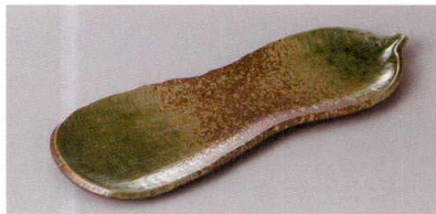
223-1-71H 1,200円 南蛮オリベ瓢型突出皿 24×9cm