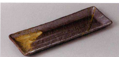
223-14-43H 1,050円 吹き流し付き出し皿 25.8×8.7×1.7cm