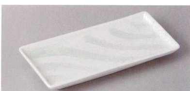
223-18-71H 1,000円 流水突出皿 20.5×9.5×2.7cm