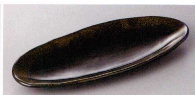
223-9-71H 1,200円 金彩天目楕円たたら皿 26.8×11.2×2.7cm