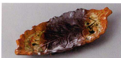
223-12-84H 1,050円 南蛮一珍木ノ葉付出皿 26×11×3cm