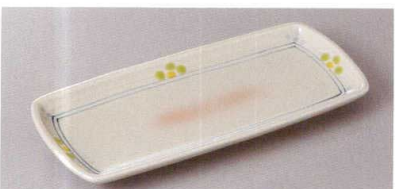
223-16-77H 1,100円 萩風早春付出皿 25×10.7×2.5cm