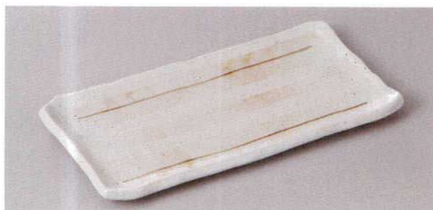
223-7-71H 1,100円 石焼突出皿 20.7×10×1.8cm