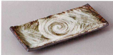
223-5-60H 1,120円 うず潮突出皿 22.5×9.5×3cm