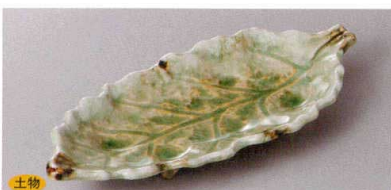
223-11-84H 1,050円 砂ビードロ木ノ葉付出皿 26×11×3cm