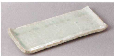
223-8-71H 1,150円 白雲突出皿 24.5×9.7×2.2cm