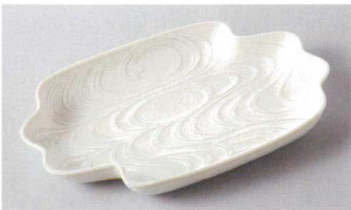
246-18-21H 1,800円 白うのぶ雲海皿 22.3×14.3×2.5cm