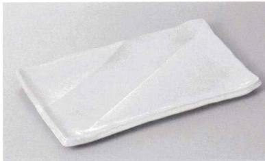
246-1-77H 1,890円 白軸重ね8寸長角皿 23.5×14.5×1.5cm