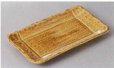
246-12-71H 1,850円 黄瀬戸そぎ格子8.0焼物皿 25.5×14×2.5cm