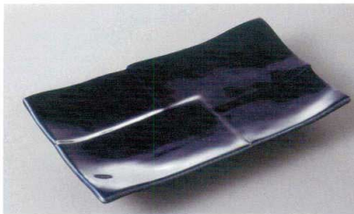
246-10-71H 2,000円 藍市松焼物皿 22.1×13×2.9cm