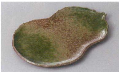
246-13-71H 2,000円 南蛮オリベ瓢箪型9.0皿 24.5×16.5cm