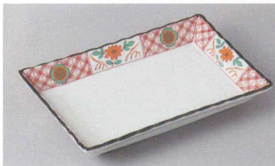
246-4-51H 1,850円 七宝菊焼物皿 20×12.8×3.5cm