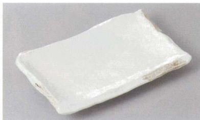
246-14-33H 1,730円 くらま焼物皿 22.5×13.6×3cm