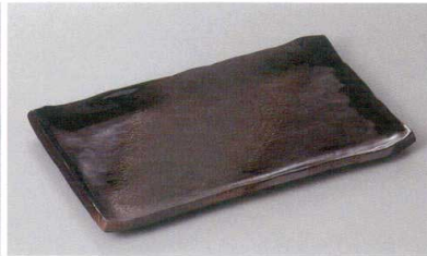
246-2-77H 1,890円 備前灰釉8寸長角皿 23.5×14.5×1.5cm