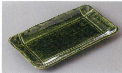
246-11-71H 1,850円 織部そぎ格子8.0焼物皿 25.5×14×2.5cm