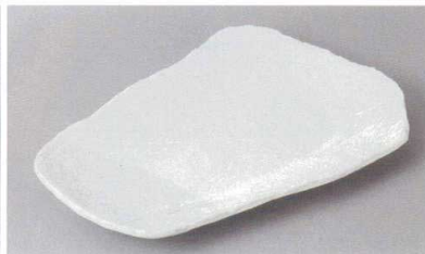
246-5-33H 1,850円 白軸砂目焼物皿 26×17.5cm