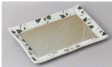
246-8-78H 2,020円 唐津椿7.0焼物皿 21.7×14.8×2cm