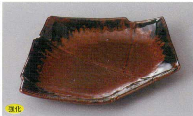
246-17-71H 1,700円 みのり結び皿 21.2×15.5×3cm