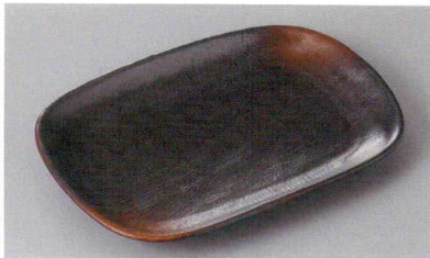
246-3-77H 1,880円 焼締め小判型多用皿(大) 20.7×14×2.2cm