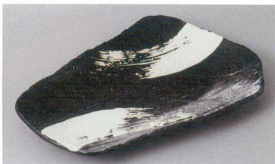
246-6-36H 1,850円 黒炭白刷毛焼物皿 25.5×17.2×3cm