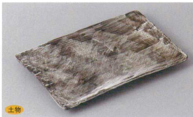
246-7-45H 1,850円 かいらぎ焼物皿 40入 21.5×13.3×2cm