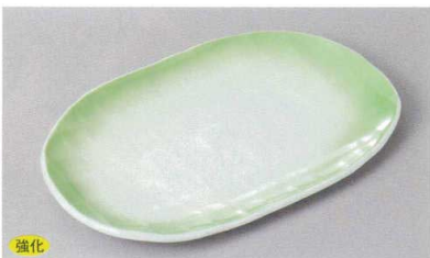
246-15-79H 1,880円 ヒロ吹格子小判多用皿 21.3×13.5×1.6cm