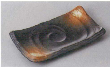
246-16-8H 1,700円 黒備前 足付焼物皿 小 21.5×12×3cm