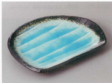
256-14-32H 1,100円 半月深海水色貫入前菜皿 23×16.5×2.5cm