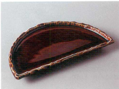
256-1-71H 2,300円 キャラメル半月7.0皿 23×13×2.4cm