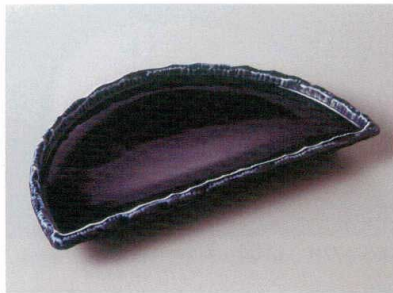
256-2-71H 2,300円 藍半月7.0皿 23×13×2.4cm