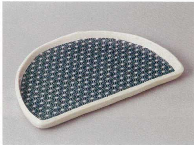
256-6-2H 1,800円 麻の葉切立半月皿 22×14×1.5cm