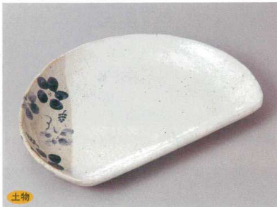
土物 256-4-73H 1,840円 雪花粧藍花8.0半月皿 23.5×16×2.3cm