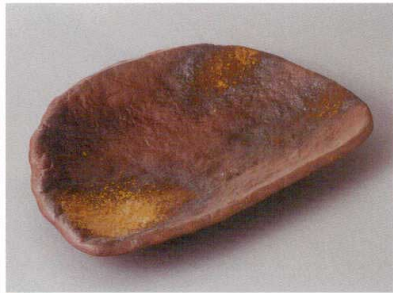
256-8-36H 1,530円 むさしの半月皿 22.5×15×3cm