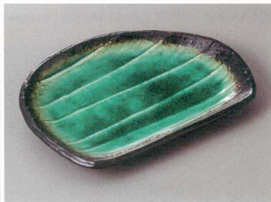
256-15-32H 1,100円 半月深海グリーン貫入前菜皿 23×16.5×2.5cm