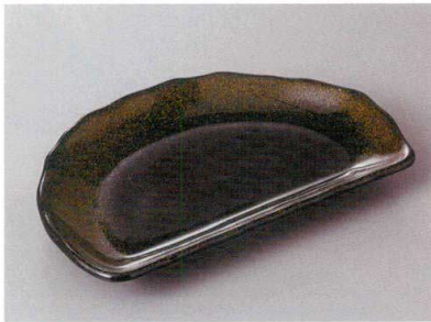
256-7-71H 1,550円 金彩天目半月皿 21.7×13×2.6cm