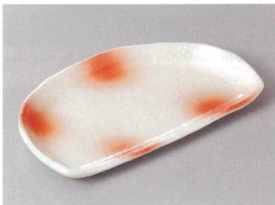
256-10-32H 1,420円 粉引色散半月焼物皿 22×12.5×2cm