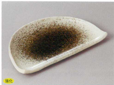
強化 256-3-73H 1,940円 織部かすみ半月7.0皿 21.2×12.7×2cm