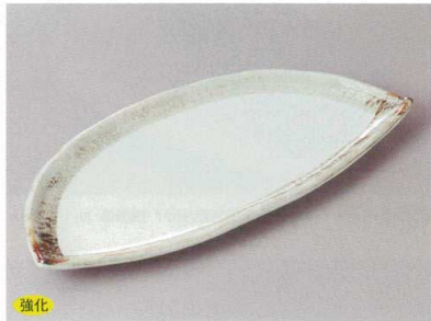
強化 256-5-71H 1,700円 湧錆9.0半月皿 26.7×12×2.5cm