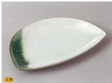
土物 256-11-31H 1,350円 カイラギ織部半月焼物皿 25.5×15.3×2.9cm