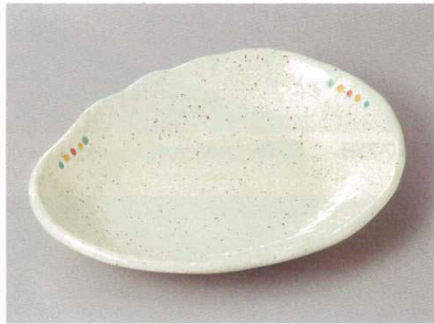
256-9-43H 1,380円 楕円三角焼物皿 21×16.5×3cm