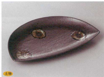
土物 256-12-31H 1,200円 南蛮吹半月焼物皿 24.8×15.6×2.6cm