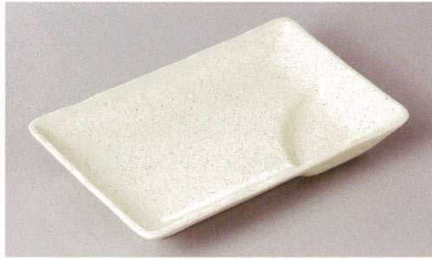
269-8-79H 700円 粉引6.0長角仕切皿 17.5×11.5×2.7cm