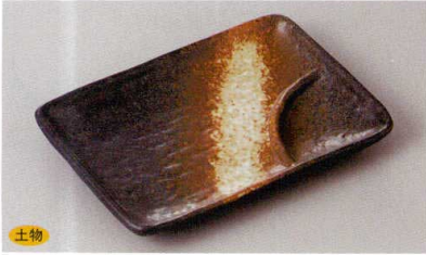
土物 269-16-79H 600円 黒備前6.0仕切皿 17.5×12×2cm