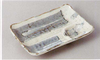
269-18-23H 650円 藍染仕切付サシミ皿小 16.7×11.2×2.7cm