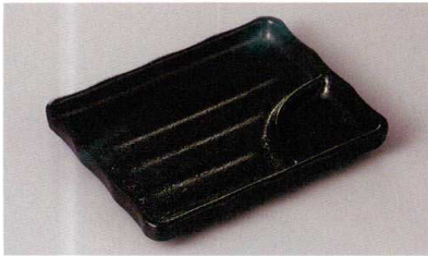
269-4-79H 900円 瀬戸黒5.5長角仕切皿 14×11×2cm