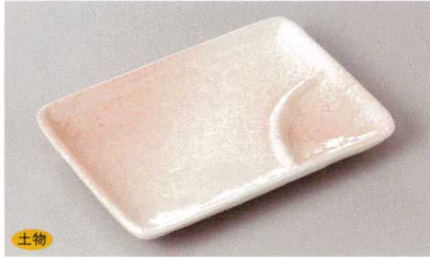
土物 269-17-79H 600円 桜志野6.0仕切皿 18×12.3cm