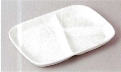
269-10-78H 680円 粉引仕切皿 23×15.2×2.5cm