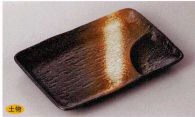
土物 269-5-79H 1,080円 黒備前7.0長角仕切皿 20.7×14×2.5cm