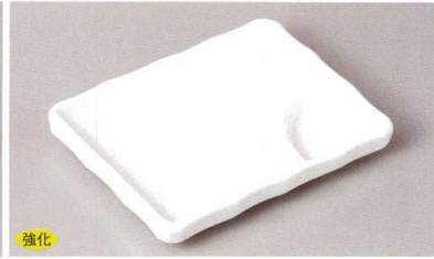
強化 269-3-79H 900円 白磁5.5長角仕切皿 13.5×10.5×1.8cm