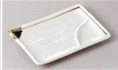
269-12-79H 600円 志野茶ライン6.0仕切皿 17×11.3cm