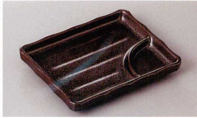
269-2-71H 900円 鉄仙花5.5仕切皿 13.5×10.5×2cm