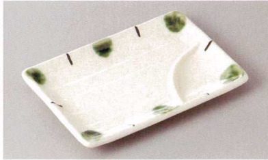
269-11-79H 600円 漣織部十華6.0仕切皿 17.3×11.3cm