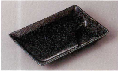
269-7-79H 700円 黒青軸6.0長角仕切皿 17.5×11.5×2.7cm