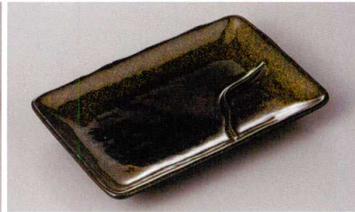
269-6-71H 800円 金彩天目6.0仕切焼物皿 17.5×12×2cm