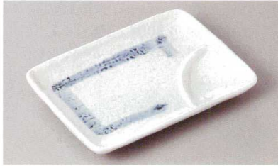
269-14-71H 600円 オフケ6.0仕切皿 17.5×12×2cm