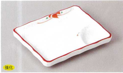
強化 269-1-71H 1,800円 赤絵小花5.5長角仕切皿 13.5×10.5×2cm

刺身向付 中鉢小鉢組小鉢 小付珍珠 松花堂蓋向 円菓子碗小吸碗 むし碗土瓶むし 前菜皿 付出血焼物皿仕切皿 天皿香水 組皿和皿 盛皿オードブル 大鉢盛鉢組鉢 組丹ホール 酒器蓋物器卓上小物 器フレンチレゾ成皿