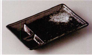
269-15-78H 700円 天目トカンツ皿 21.2×13.5×2.6cm