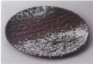
330-4-26H 2,400円 雪化粧 8.0皿 25.2×2cm