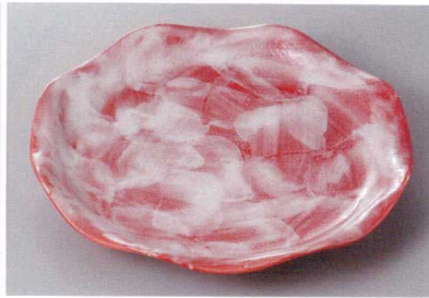
330-3-60H 2,500円 赤彩花型 8.0皿 25×3.5cm