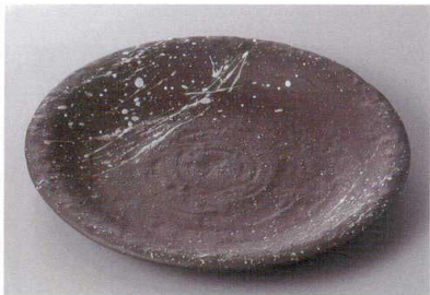
330-12-25H 1,800円 吹墨石目 8.0皿 25.5×3.5cm