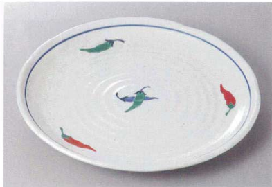
330-8-34H 2,400円 赤絵とうがらし大皿 29.7×3.3cm