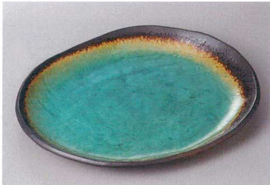
330-7-26H 2,400円 新海変形小判大皿 26.2×22.2×2.3cm