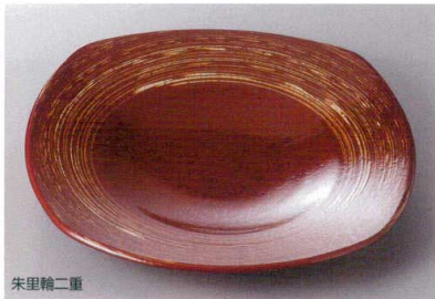
330-15-21H 2,400円 9.5尺角皿 29.9×27.7×4.6cm