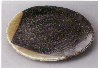
330-5-21H 2,400円 星野濃 8.0丸皿 25.5×2cm