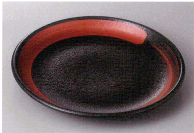
330-11-22H 2,150円 赤銀彩 8.0丸皿 24.6×3.2cm