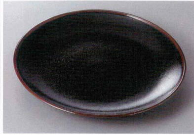
330-2-43H 2,550円 ゆず天目 9.0皿 28.7×4.2cm