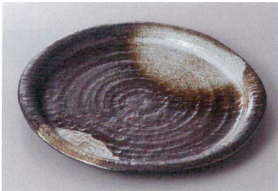
330-10-35H 2,200円 白吹天目 8.0波測皿 24.5×2.8cm