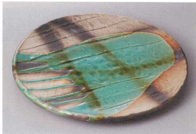
330-6-26H 2,400円 黒ダスキ織部 8.0皿 25.2×2cm