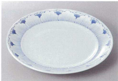
330-9-35H 2,300円 ろんど 8.0丸皿 25×3.2cm