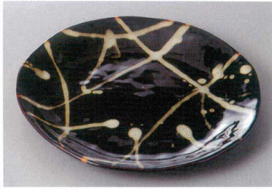
334-3-71H 2,750円 天目うのぶ撒し7.5皿 23.5×2.2cm