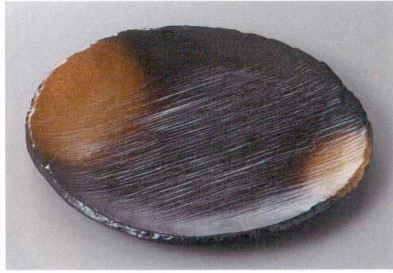
334-6-31H 2,300円 備前風金茶吹8.0丸皿 25.2×2.7cm