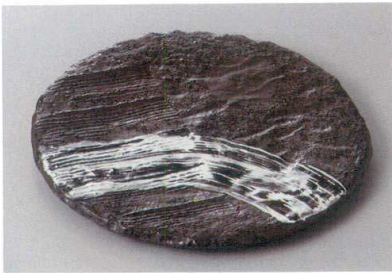
334-1-41H 3,000円 銀河三ツ足7.0皿 21×2.5cm