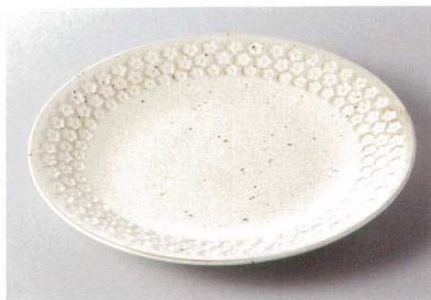
334-7-8H 1,400円 コットン印花型80皿 25.5×3cm