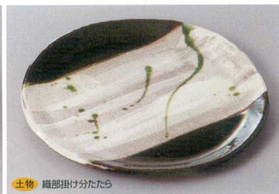
土物 織部掛け分たたら 334-19-2H 4,200円 七寸皿 21.7×1.8cm 334-20-2H 2,300円 五寸皿 15.8×1.5cm