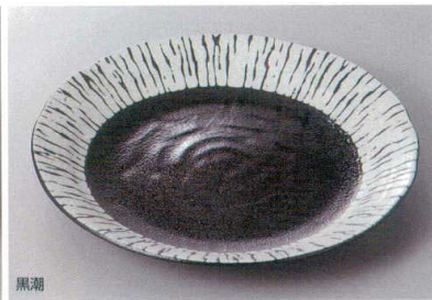
黒潮 334-14-34H 1,300円 8.0寸皿 26.5×3.5cm 334-15-34H 880円 7.0寸皿 24.2×2.9cm