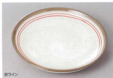
赤ライン 334-16-33H 2,300円 7.5平皿 23.5×3cm 334-17-33H 1,400円 6.0平皿 20.3×2.5cm 334-18-33H 960円 5.0平皿 17.5×2.3cm