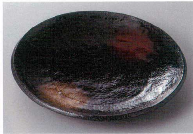
334-9-77H 1,340円 塵手捺り8寸皿 24×3.5cm