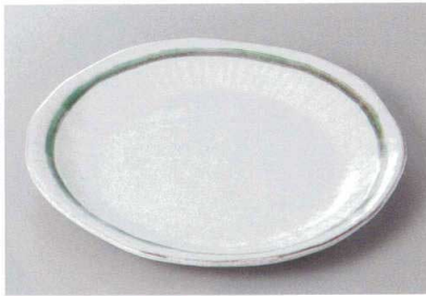
334-4-71H 2,900円 あおい7.5丸皿 23.5×2.5cm