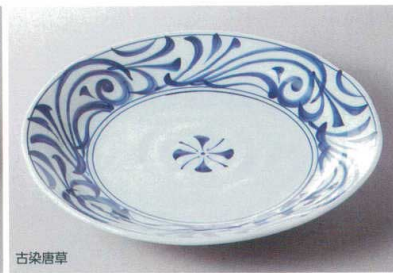
古染唐草 334-21-57H 1,200円 8.5皿 26.5×3.5cm 334-22-57H 800円 7.5皿 24×2.5cm