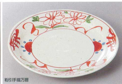
粉引手描万暦 334-12-32H 1,460円 7.0天皿 24×3cm 334-13-32H 1,120円 6.0皿 19×2.8cm