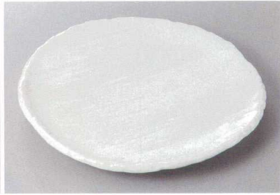
334-5-33H 2,200円 白河8.0丸皿 25×2.5cm