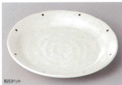
粉引ドット 334-10-57H 1,500円 8.5皿 26.5×3.5cm 334-11-57H 750円 6.0皿 19.2×3cm