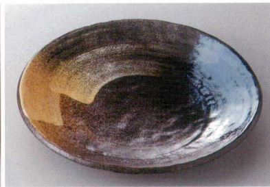
334-8-77H 1,180円 二色刷毛自手びねり8.0寸皿 24×4cm