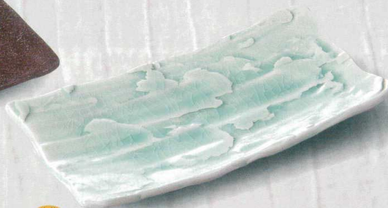
土物 342-1-45H 21,000円 黒陶 洩立盛皿(手造) 37×29×2cm