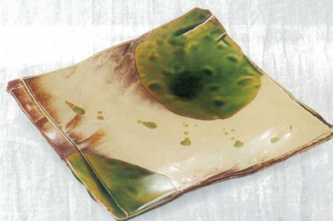
356-6-78H 4,850円 錆袖ヒワ流長角9.5皿 30×28.4×4.8cm