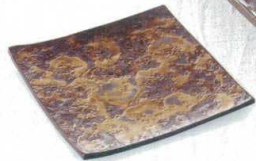
356-1-2H 9,000円 ゴールのオースクエアプレート 21×20.8×2.7cm