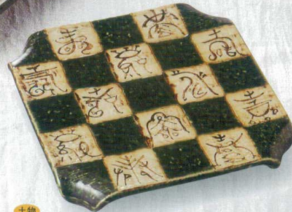
土物 356-3-21H 7,900円 織部市松寿四つ曲げ正角盛皿大 24.2×3.5cm