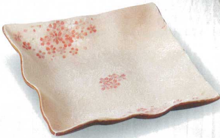
356-2-10H 7,100円 平安桜正角大皿 27.5×27.5×5.6cm