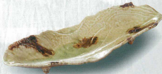
372-2-27H 8,000円 ビード口欄目長皿 43×15×6cm