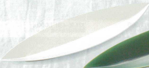
笹型 372-3-23H 8,800円 長皿(大白) 52.4×15×4.2cm 372-4-23H 4,400円 長皿(中)白 44×10.5×2.8cm 372-5-23H 1,300円 長皿(小)白 30.3×7.5×2.7cm