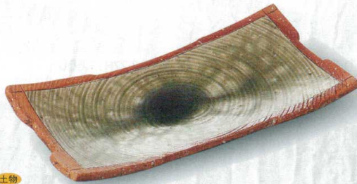
土物 372-1-45H 8,800円 伊賀灰袖うず巻長角大皿(手造) 33×16.5×4.5cm

わびさびにも通じる、自由な造形は和食器ならではの。 何物にもとられない自由な造形は、創造性に富んだ料理を受け止めます。