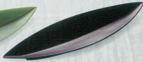
笹型 372-9-23H 8,800円 長皿(大)黒 52.4×15×4.2cm 372-10-23H 4,400円 長皿(中)黒 44×10.5×2.8cm 372-11-23H 1,300円 長皿(小)黒 30.3×7.5×2.7cm